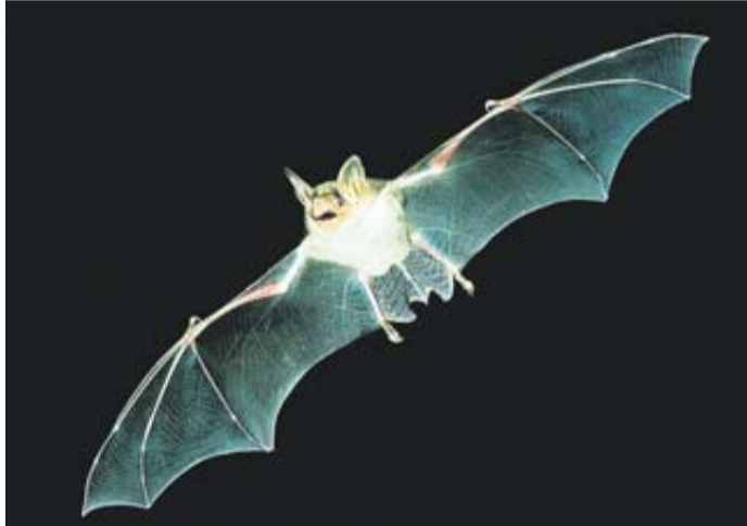
Eine fliegende Mausohr.

Bad Nauheim. Fledermäuse haben für viele Menschen etwas Geheimnisvolles, für manche sogar Unheimliches. Durch ihre nächtliche Lebensweise und ihren schnellen geräuschlosen Flug bekommt man sie nur selten zu sehen. Pünktlich zu internationalen Batnight laden die NABU-Gruppen Friedberg und Bad Nauheim am Freitag, 29. August wieder zu ihrer traditionellen und besonders bei Kindern beliebten Fledermauswanderung zu den Bad Nauheimer Waldteichen ein. Treffpunkt ist um 19.30 Uhr der Parkplatz am Hauptfriedhof Bad Nauheim in der Homburger Straße. Da die Zahl