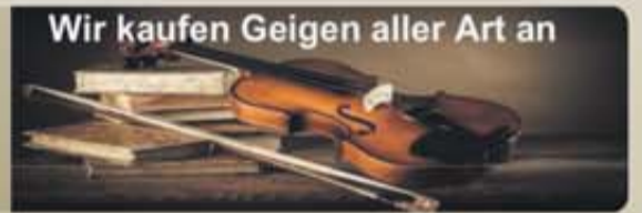
Wir kaufen Geigen aller Art an

Wir zahlen sofort den ermittelten Wert in BARGELD aus!