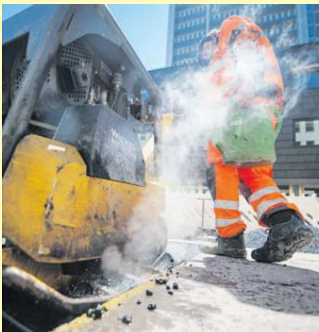
Richtige Arbeitsschutzkleidung darf auch bei widrigen Wetterbedingungen nicht einfach abgelegt werden.

30 Grad oder mehr: Wer bei solchen Temperaturen etwa einen Anzug tragen muss, fühlt sich wahrscheinlich nicht so richtig wohl. Doch wenn das zur vorgeschriebenen Arbeitskleidung gehört, kann man sich nicht einfach etwas anderes anziehen. „Arbeitnehmer dürfen das Tragen berechtigterweise vorgegebener Kleidung nicht eigenmächtig unterlassen“, erklärt Nathalie Oberthür, Fachanwältin für Arbeitsrecht. Für diese Faustregel ist aber grundsätzlich zwischen einfacher Arbeitskleidung und Arbeitsschutzkleidung zu unterscheiden. Arbeitsschutzkleidung muss wegen rechtlicher Bestimmungen zum Schutz der An-