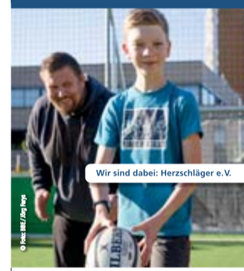
Wir sind dabei: Herzschläger e.V.

Jetzt mitmachen unter www.engagement-macht-stark.de