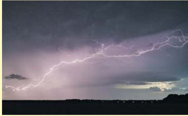
Bei Gewitter gilt: raus aus dem Zelt und blitzschnell ab ins Auto.

Wenn der Zeltplatz durch Regen eher Matsch statt Platz ist und Blitz und Donner dazukommen, ist das Zelt kein sicherer Ort. Zumal, wenn die Unwetterwarnung schon „Gefahr für Leib und Leben“ bedeutet. Tatsächlich besteht bei einem Gewitter in einem Zelt kein Schutz vor direktem Blitzeinschlag, so das Fachgremium Blitzschutz und Blitzforschung des VDE-Verband der Elektrotechnik Elektronik Informationstechnik. Man sollte daher bereits vor dem Gewitter das Zelt verlassen und – wenn möglich – sich in ein Fahrzeug oder ein Gebäude begeben, rät der ADAC in seinem „Pin-Camp“-Magazin. Sollte das nicht möglich sein, gilt: • Zeltwand und Zeltgestänge nicht berühren, auch