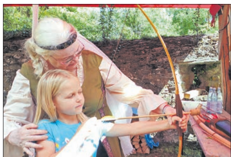
Mit Pfeil und Bogen konnte im Ritterlager geschossen werden.