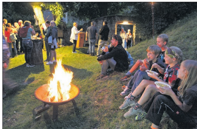
Stimmungsvoll war es am Samstagabend an der Feuerschale bei den Landsknechten im Ostzwinger.