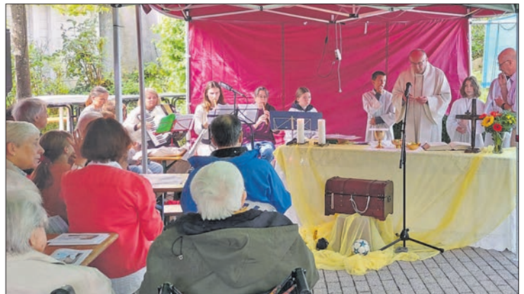
Freiluftgottesdienst beim Sommerfest in Ehlhalten.

Am Sonntagmorgen begann der Gottesdienst ausnahmsweise für Ehlhalten um 11 Uhr. Für diesen Tausch bedankte sich die Gemeinde bei ihren Partnern aus Vockenhausen, die es ermöglicht haben. Dadurch waren bei dem Familiengottesdienst alle Bänke besetzt und die Besucher kamen auch aus den umliegenden Gemeinden zum Freiluftgottesdienst. Auch für Familien mit Kindern war der Beginn passend. Während des Gottesdienstes stand eine Schatzkiste bereit, die von den Kindern ausgepackt wurde. Jeder hat zu seinem wertvollsten Schatz seine Gedanken mitgeteilt nach dem Motto „Wo dein Schatz ist, da ist auch dein Herz“. Durch das Spielen der Musikgruppe mit modernen Liedern war es für alle ansprechend gestaltet und es wurde kräftig mitgesungen.