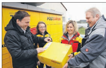
Im März 2023 ging die Poststation am Valterweg in Betrieb.

Sehr deutlich wird die Stadt gegenüber der Bundesnetzagentur zur Bewertung der Situation: „Im Ergebnis kann ein derart gelagertes – fast schon als eiskalt zu bezeichnendes – Verhalten der Deutschen Post AG nicht zu billigen sein.“ Die Stadt hegt laut Simon die Hoffnung, dass der Antrag der Deutschen Post AG abgelehnt wird. EZ