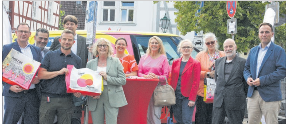
Vertreter der IHK, der Stadt, des Magistrats und des Eppsteiner Gewerbevereins IHH nahmen am Heimat-shoppen-Rundgang teil.

ihres Lädchens, „This is my happy place“.