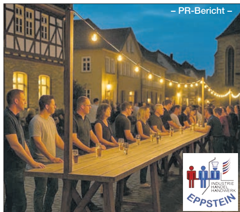
Eine lange Tafel zieht sich beim Weinfest durch die Altstadt.

Das Weinfest verspricht ein unvergessliches Erlebnis voller Genuss, Gemütlichkeit und Gemeinschaft. „Teilen Sie diese Neuigkeit in Ihrem Freundes- und Bekanntenkreis, um gemeinsam diesen schönen Abend in der Altstadt zu feiern“, wirbt der IHH.