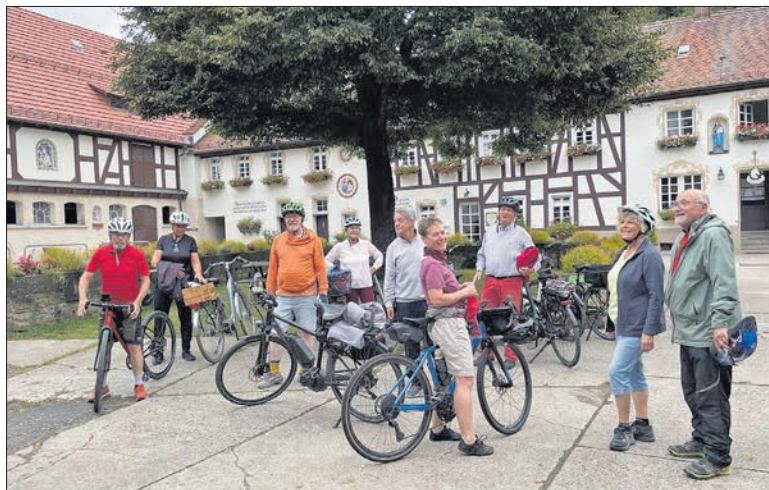
Die Radlergruppe bei ihrer Station am Gut Rettershof bei Kelkheim.

Alles in allem war der Ausflug wieder eine gelungene Sache bei schönstem Wetter, guter Verpflegung und sehenswerter Natur. Peter Lange