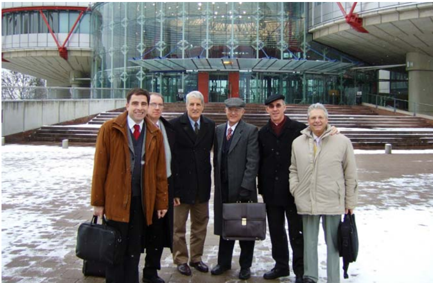
Unser Team von Rechtsexperten vor dem EGMR (2010)