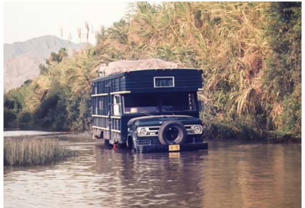
„Die Arche“ (1974)

1974 ernannte mich der peruanische Zweig mit nur 18 Jahren zum Sonderpionier. Zusammen mit vier weiteren Sonderpionieren ging es in unberührtes Gebiet hoch in den Anden zum Volk der Quechua und Aymara. Unser Zuhause war ein Camper, den wir wegen seiner Kastenform liebevoll „Die Arche“ nannten. Ich erinnere mich gern