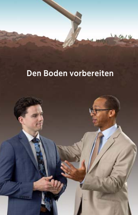
Den Boden vorbereiten