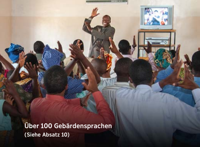
Über 100 Gebärdensprachen (Siehe Absatz 10)