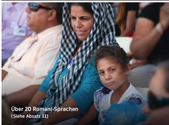
Über 20 Romani-Sprachen (Siehe Absatz 11)

Unsere Publikationen sind in über 1000 Sprachen verfügbar (Siehe Absatz 10-11)