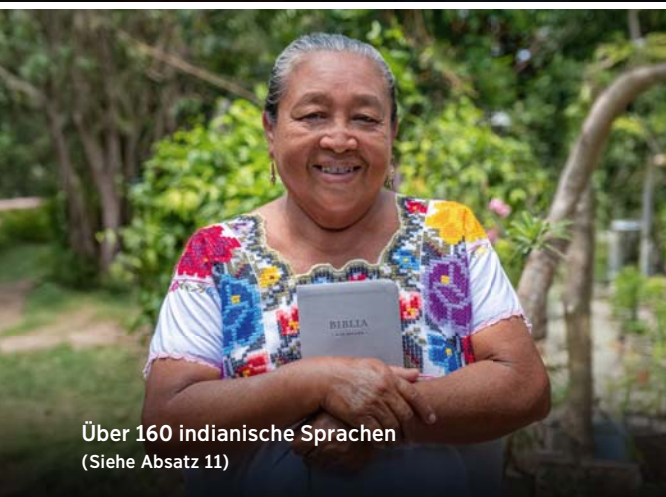
Über 160 indianische Sprachen (Siehe Absatz 11)