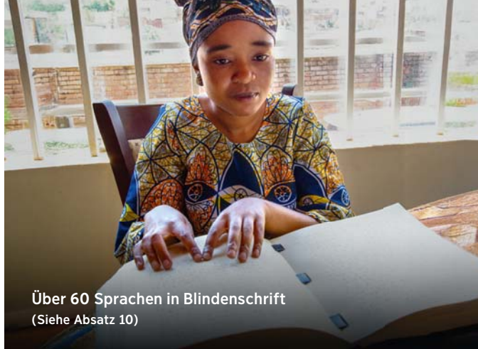
Über 60 Sprachen in Blindenschrift (Siehe Absatz 10)