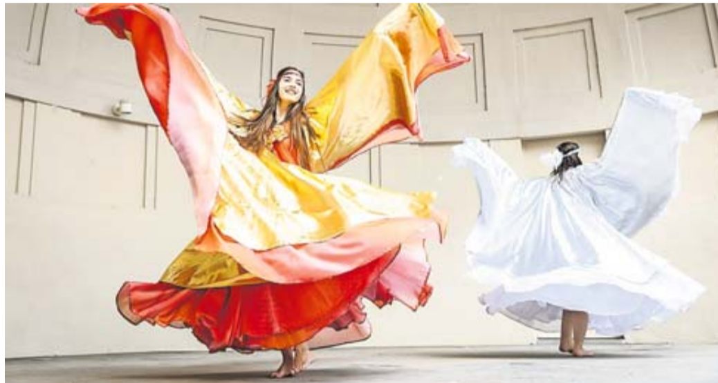
Tanzvorführung am Jugendstilfestival.

Bad Nauheim. Bad Nauheim feiert sein Jugendstilerbe und lässt beim diesjährigen Jugendstilfestival am 13. und 14. September die Belle Époque wieder aufleben. Musik, Tanz, Mode, Ausstellungen, Kinderprogramm, Antiquitäten und Kunsthandwerk verwandeln die Trinkkuranlage in ein lebhaftes Festivalzentrum. Der Eintritt ist frei und am Festivalsamstag haben zudem die Geschäfte in der Bad Nauheimer Innenstadt geöffnet.