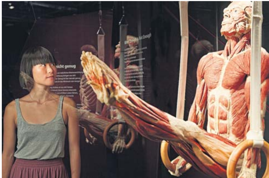
Faszinierende Einblicke in den Zyklus von Entstehen und Vergehen zeigt die Körperwelten-Ausstellung ab 26. September in Hanau. Foto: Gunther von Hagens „Körperwelten“

Eine Vielzahl einzigartiger Präparate, darunter viele Ganzkörper-Plastinate, führen Besucher durch den menschlichen Körper und erläutern leicht verständlich die einzelnen Organfunktionen sowie häufige Erkrankungen. Im Fokus stehen der menschliche Körper und seine Veränderung im Lauf der Zeit, von der Zeugung bis ins hohe Alter. Körperwelten zeigt anschaulich, was jeder