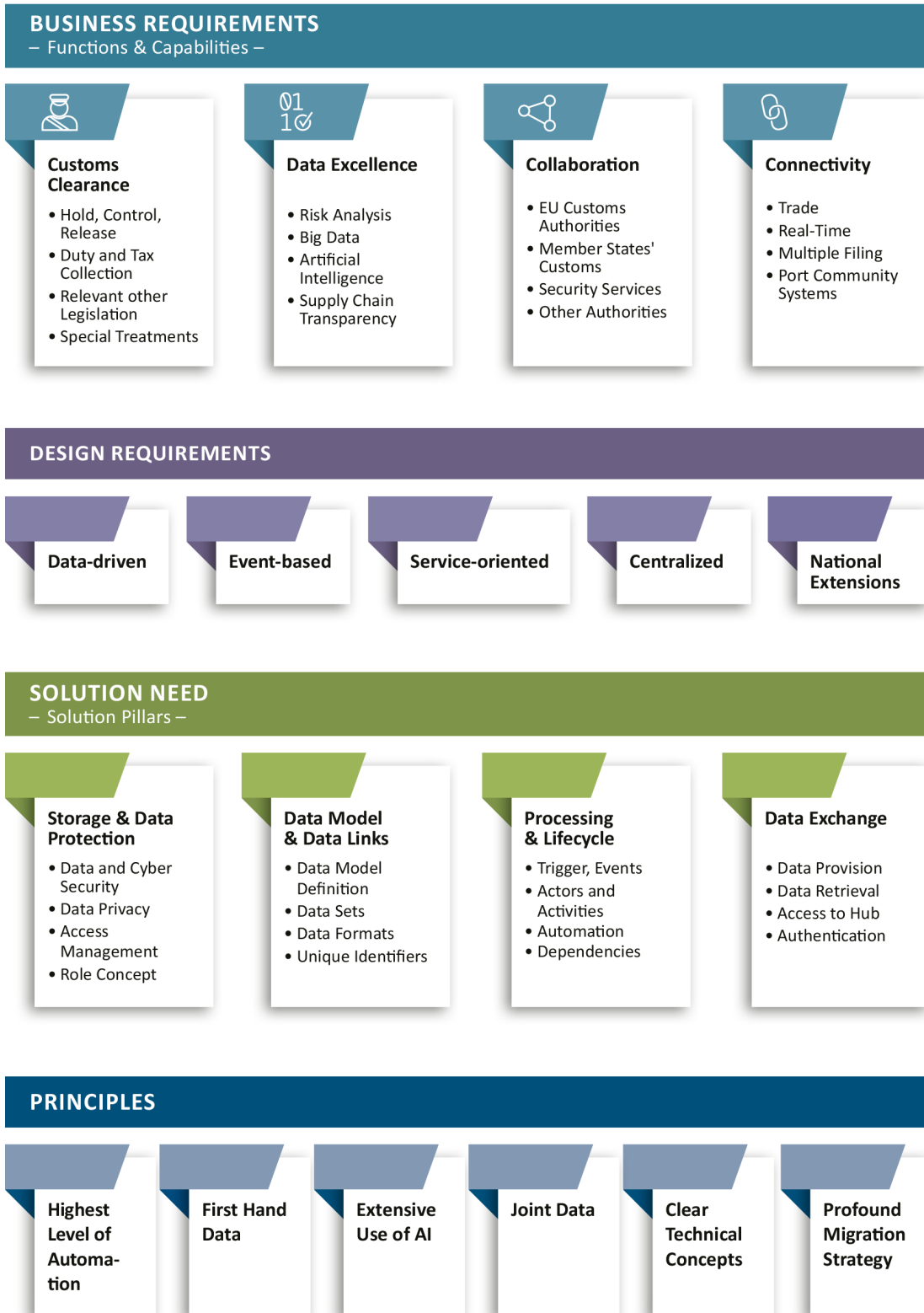
Abbildung 3 – Gesamtübersicht Data Hub Anforderungen, Lösungsansätze und Prinzipien