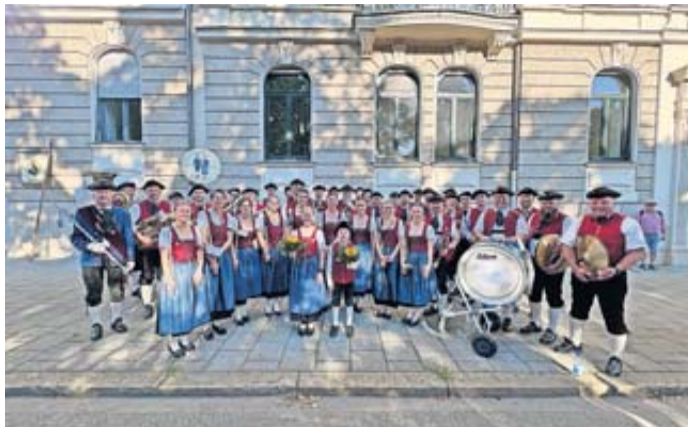
Vor dem Trachten und Schützenzug.

Sinntal. Mit großer Vorfreude reisten die Musikfreunde Weiperz nach München, um beim Oktoberfest mitzuwirken. Am Samstag begleiteten sie erstmals den feierlichen Einzug der Festwirte der „Oiden Wiesn“ musikalisch. Pünktlich zum Anstich des ersten Bierfasses traf die Kapelle im Festzelt ein und erlebte diesen besonderen Moment live.