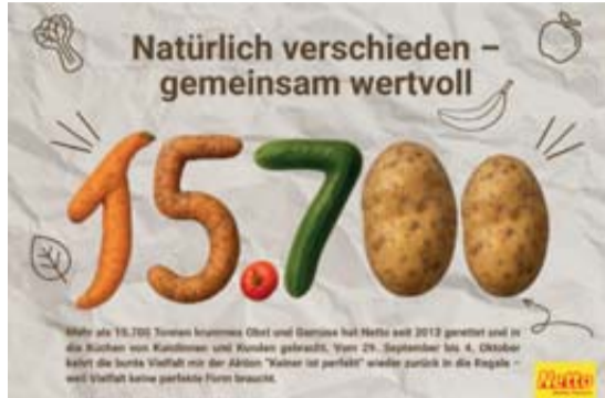
Wird ein 15.700 Tonnen krummes Obst und Gemüse bei Netto seit 2012 gesammelt und in die Regale von Kassen und Kunden gebracht. Vom 29. September bis 4. Oktober führt die bunte Vielfalt mit der Aktion "Keiner ist perfekt" wieder zurück in die Regale und Vielfalt keine perfekte Form braucht.

In Deutschland landen jährlich rund 10,8 Mil-