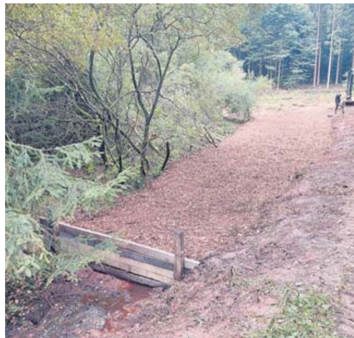
Moorflächen im Revier Mernes.

Die Moorflächen im Revier Mernes befinden sich derzeit in keinem guten ökologischen Zustand. Alte Entwässerungsgräben und der Anbau von Fichten haben den Wasserhaushalt nachhaltig gestört – das Moor trocknet zunehmend aus. In der Folge verliert der Torfkörper an Volumen und setzt dabei Kohlenstoff frei, der zuvor über Jahrhunderte gespeichert war. Die geplanten Renaturierungsmaßnahmen sollen diesen Prozess nicht nur stoppen, sondern langfristig umkehren.