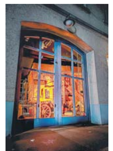
Sichtbar von außen.

Wer die Dauerausstellung also noch einmal – oder zum ersten Mal – erleben möchte, sollte sich beeilen: Der Countdown läuft.