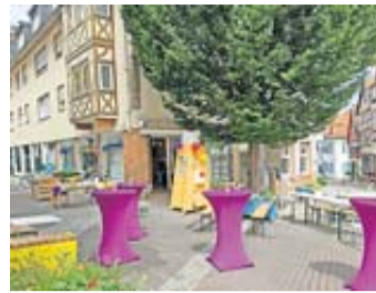
Der Fünf-Finger-Treff außen.

Jede Woche Dienstag ab 16 Uhr können Menschen hier miteinander ins Gespräch kommen, neue Kontakte knüpfen und nebenbei in ungezwungener Atmosphäre Sprachkenntnisse verbessern. Freunde und Familie sind auch sehr herzlich willkommen.