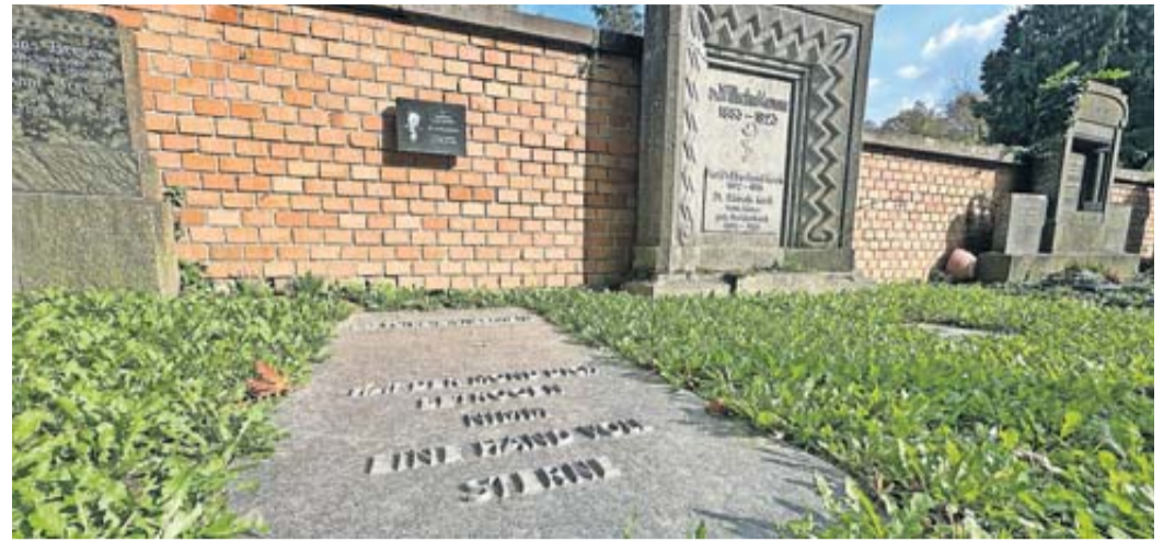
Die Führung vorbei an den Grabsteinen zeigt Bad Nauheimer Lebensspuren.

Bad Nauheim. Auch in der kälteren Jahreszeit präsentiert die Gesundheitsstadt Bad Nauheim ihre vielfältigen Facetten, die es zu entdecken gilt. Das neue Winterführungsprogramm der Bad Nauheim Stadtmarketing und Tourismus GmbH verspricht eine abwechslungsreiche Auswahl an Gästeführungen, die Geschichte, Kultur und Kulinarik auf spannende und unterhaltende Weise vereinen.