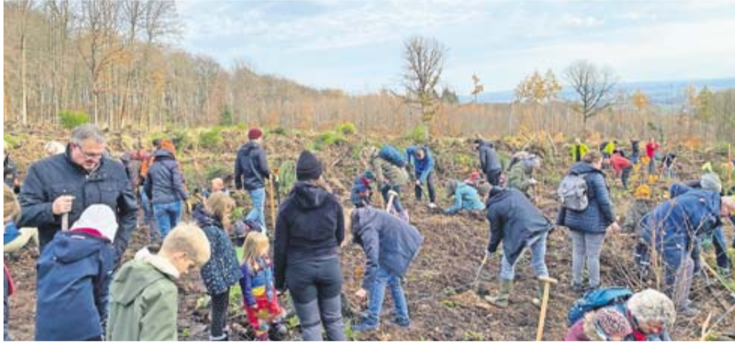
Zahlreiche Helfer bei der vergangenen Pflanzaktion.