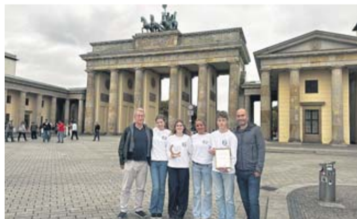
Die Teilnehmende an dem Wettbewerb „YouStartN“.

Beträge zwischen 5.000 und 15.000 Euro erhalten. Im Landeshaushalt stehen in diesem Jahr mindestens 1,5 Millionen Euro für „Ehrenamt digitalisiert!“ zur Verfügung. Das Gesamtbudget in den sechs Jahren belief sich auf rund 9,2 Millionen Euro. Mit dem Förderprogramm „Ehrenamt digitalisiert!“ können gemeinnützige Institutionen, deren hessische Dachverbände sowie gemeinnützige juristische Personen des Privatrechts Unterstützung für Digitalisierungsvorhaben beantragen. Der Schwerpunkt der Digitalisierungsvorhaben muss auf der internen Verwaltung oder Struktur der Organisation liegen, wie beispielsweise der Mitgliederverwaltung oder digitalen Besprechungen sowie der Gewinnung neuer Mitglieder. Darüber hinaus können Bildungs-, Beratungs- und Unterstützungsprojekte gefördert werden.