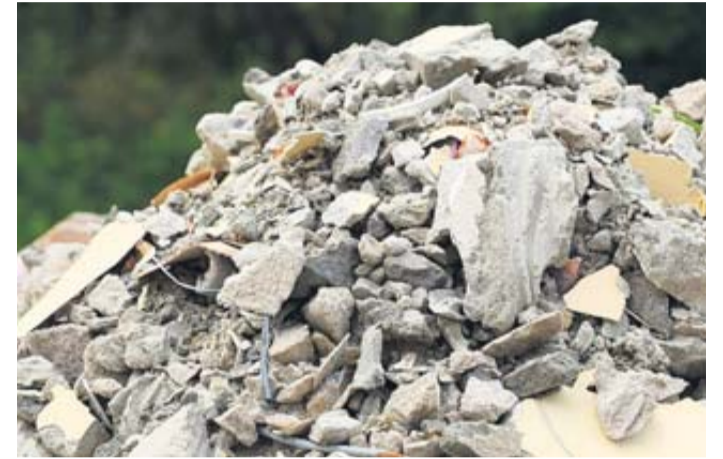
Illegale Müllablagerungen von Bauschutt.

Die Stadt Rosbach dankt allen Bürgerinnen und Bürgern für ihre Mithilfe und ihr Engagement zum Schutz der Umwelt und des Stadtbildes.