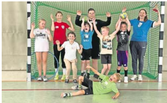
Spiel und vor allem Spaß stehen bei den Rockenbergen Ferienspielen im Vordergrund.

Interessierte können sich ab sofort melden