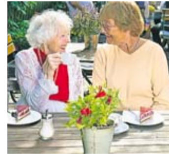
Frühstücken und gemeinsam eine schöne Zeit verbringen.

Anmeldungen für das Frühstück werden ab sofort unter der Telefonnummer 06007-7617 entgegengenommen. Der Unkostenbeitrag in Höhe von 15 Euro pro Person kann direkt vor Ort beim Wirt entrichtet werden. Wer den Bürgerbus nutzen möchte, kann sich bis zum Freitag davor unter der Telefonnummer 06003/822-555 anmelden.