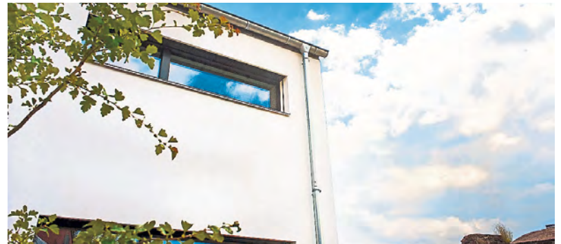
Algenschutz ohne Chemie: Dank innovativer Fassadenputze kann heute auf den Einsatz giftiger Biozide verzichtet werden.

Gut zu wissen: Einige Kommunen knüpfen die Vergabe von Fördermitteln bereits an den Einsatz biozidfreier Produkte.