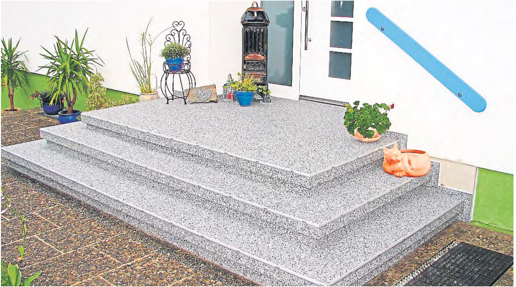
Ein neuer Belag sorgt dafür, dass Treppen wieder gefahrenlos betreten werden können.

Mit einer zeitsparenden Modernisierung verlieren alte Treppen ihren Schrecken