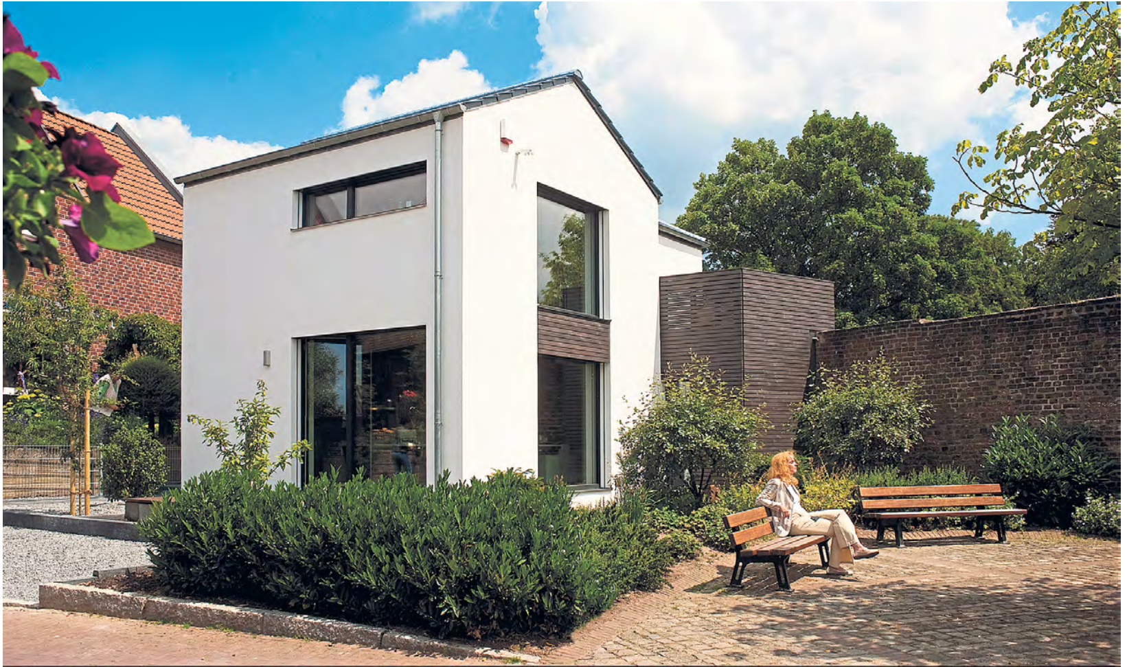
Die Fassade prägt das Eigenheim. Beim Verputzen müssen keine giftiger Biozide mehr verwendet werden.

Mit der Auswahl des passenden Putzes Verunreinigungen vorbeugen