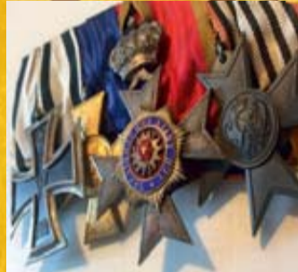
Militariat und Orden