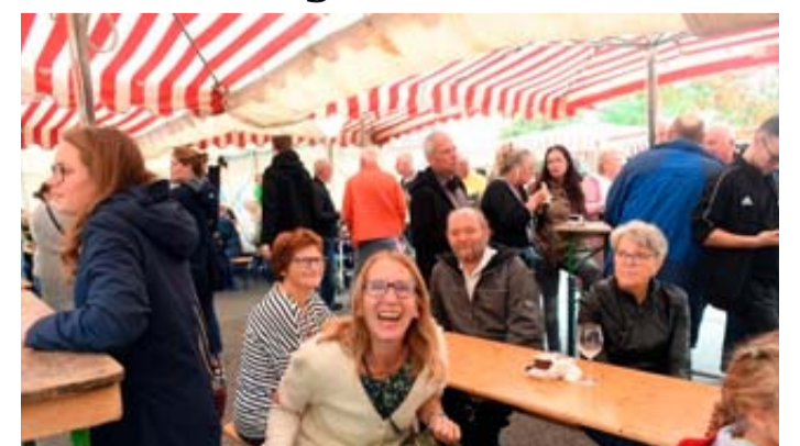
Ausgelassene Stimmung herrschte auf der Kirmes in Rockenberg.

wäre ein solches Fest nicht möglich. Dafür möchten wir uns noch einmal ganz herzlich bedanken.“ Mit Musik, Tanz, Essen sowie einem Dämmerstopp fand das Fest seinen gelungenen Abschluss. Die Gemeinde Rockenberg freut sich bereits auf die Fortsetzung im kommenden Jahr. Auch im nächsten Jahr findet die Kirmes am dritten Wochenende im September statt.