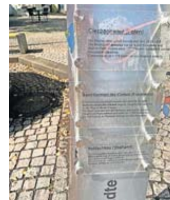
Die beschädigte Stele

Die Stadt weist in diesem Zusammenhang darauf hin, dass