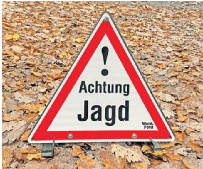
Schilder warnen Spaziergänger und Wanderer vor dem Betreten eines Waldstücks während der Jagdzeit.

Es gilt, die entsprechenden Warnhinweise zu beachten, denn die Durchführung entsprechender Gesellschaftsjagden unterliegt keiner Anzeige- oder Genehmigungspflicht. Die erforderlichen Si-