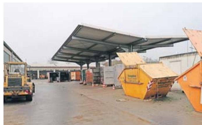
Der Recyclinghof in Rosbach.

Die Stadt Rosbach v. d. Höhe bittet um Verständnis für diese notwendige Maßnahme und bedankt sich für die Mithilfe aller Nutzerinnen und Nutzer bei der Umsetzung. Die Mitarbeiter vor Ort stehen für Fragen zur Verfügung.