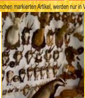
Tierpräparate aller Art**