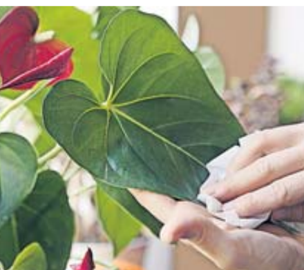
Einmal wischen, bitte: Eine Staubschicht auf den Blättern kann die Energiegewinnung einer Pflanze einschränken.

Bücherregal, Kommode, Nachttischschränkchen: Sie alle sind beim Staubwischen meist automatisch im Blick. Doch wie sieht es eigentlich mit Ihren Zimmerpflanzen aus? Auch auf deren Blättern können sich schließlich mit der Zeit Staubbeläge bilden. Und das sieht nicht nur unschön aus, es kann den Pflanzen auch schaden: Sie bekommen nicht mehr genug Licht ab für ihre Photosynthese - und wachsen womöglich schlechter. Die Plants & Flowers Foundation Holland rät deshalb, Zimmerpflanzen regelmäßig, also zum Beispiel einmal im Monat, abzustauben. Bei großblättrigen Pflanzen kann man dafür einfach ein feuchtes, weiches Tuch