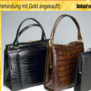
Wir zahlen bis zu 800,- € für Krokotaschen