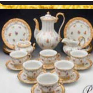
Porzellan namhafter Hersteller**