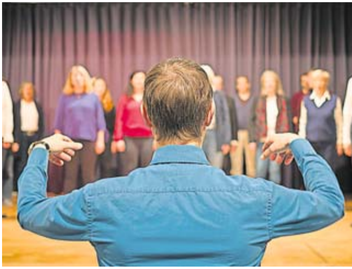
Der Kammerchor freut sich auf viele Besucher.