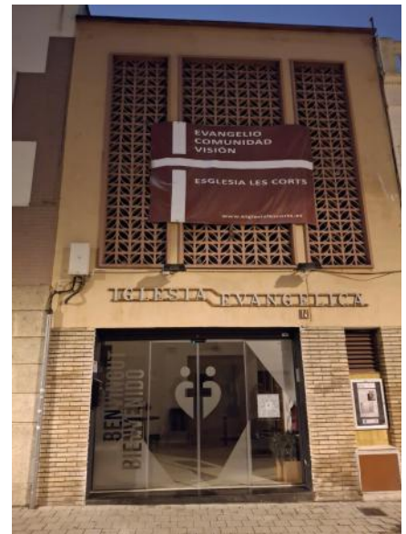
Gemeinde Les Corts

Abschließend eine Gebetsrunde – sehr viel später als gedacht kommen wir weg und schaffen es gerade so zum Check-in nach Palafrugell, wo wir noch ein paar Tage Urlaub machen bevor wir am 26. März von Girona aus nach Hause fliegen. ■