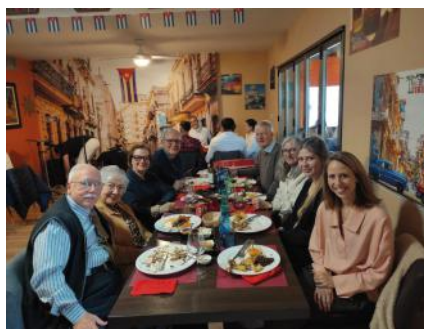
im El Cubanito