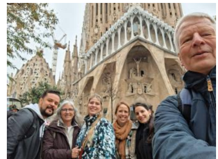
vor der Sagrada Familia