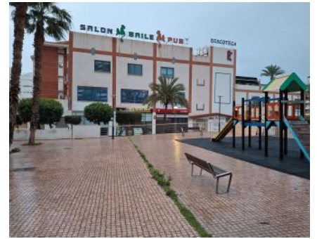
Gemeinde El Faro in der ehemaligen Diskothek

Ein amerikanischer Missionar hatte vor vielen Jahren dafür gebetet, dass diese Räumlichkeiten einmal zu seiner Ehre genutzt werden würden! Er hat es selber nicht mehr erlebt – Gottes Zeitpläne sind anders und Gottes Mühlen mahlen langsam – Aber sein Gebet ist erhört und sein Wunsch erfüllt worden! Seit ca. 5-6 Jahren hat sich die Gemeinde El Farro hier eingemietet und die Räumlichkeiten für die Ge-