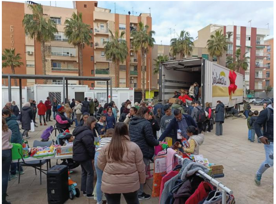
Verteilung von Kleidung und Lebensmittel

Um diese Mission zu erfüllen, wurde ein Kooperationsnetzwerk organi-