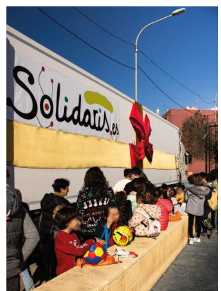
Verteilung von Weihnachtsgeschenken für Kinder