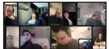
Onlinebibelstunde für Männer