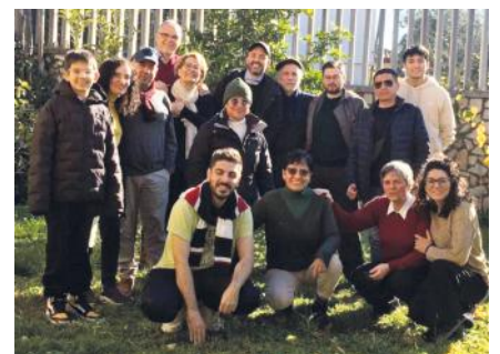
unsere Gemeinde mit Gästen