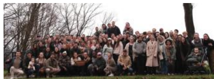
Recruits in Belgium

Seit etwa anderthalb Jahren freunden wir uns immer enger mit einer Organisation hier in Belgien namens The Recruits an ( www.recruits.be ). Ihre Mission besteht darin, ein Netzwerk von Jüngern aufzubauen, das sich jährlich vervielfacht. „Kommt und folgt mir nach; ich will euch zu Menschenfischern machen“ Lukas 5:10. Um dies zu erreichen, konzentrieren sie sich auf starke Gemeinschaften und Jüngerschaftstraining. Wir sehen immer mehr Überschneidungen in unseren Tätigkeiten. Derzeit treffen sich 5 Jüngerschaftsgruppen im Sofa&Zo. Die meisten Mitglieder sind etwa 18–25 Jahre alt. Es gibt auch eine Gruppe von 40-Jährigen. Gemeinsam werden wir über mindestens ein Jahr hinweg vier Bücher durchgehen. Wir treffen uns wöchentlich, um zu besprechen, was wir in den Büchern