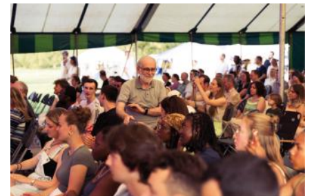
24/7 Alle Generationen