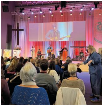
Zeugnisse während des Frauenwochenendes

Im November haben wir zum ersten Mal seit langer Zeit unser Frauenwochenende veranstaltet. Ein Wochenende, an dem wir etwas über die starke Frau erfahren, die in Einheit mit Gott leben möchte, die aus Ihm ihre Kraft schöpft und viel Frucht bringt. Es war ein wunderbares Wochenende mit viel Raum für Studium, Anbetung, Gebet, Gemeinschaft und innere Heilung.