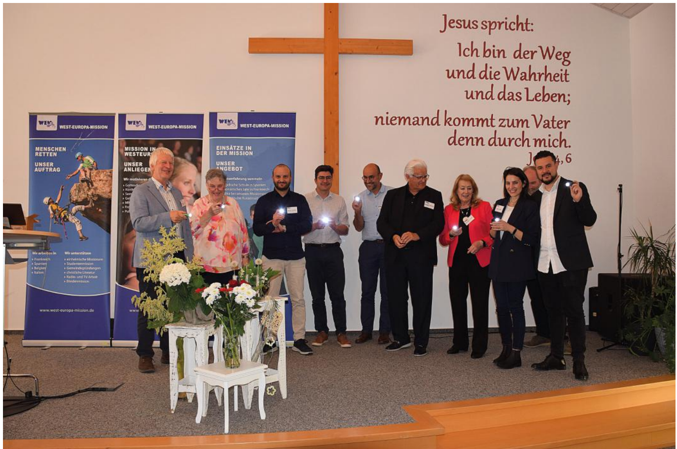
Aussendung der Missionare