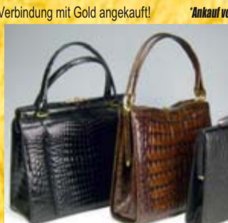
Wir zahlen bis zu 800,- € für Krokotaschen