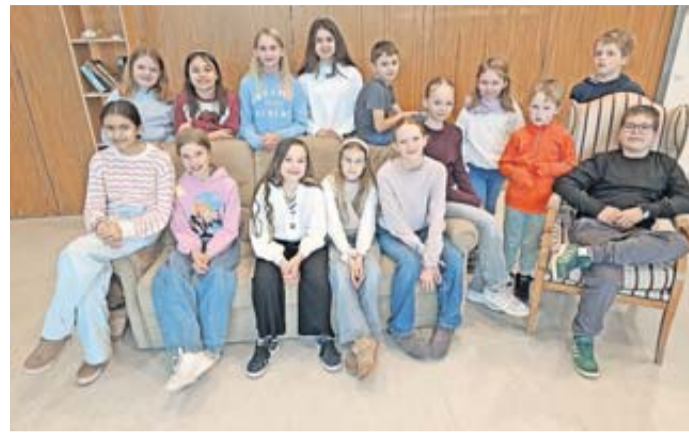
Beim jüngsten Probenwochenende im Kulturhaus ging es bei der Jungen Bühne Münzenberg hoch her: Es wurde fleißig für die Aufführungen des Stückes „Das Geheimnis der Geistervilla“ geprobt, Kostüme und Requisiten wurden besprochen – und bei einer gemeinsamen Pizza-Pause kam natürlich auch der Spaß nicht zu kurz.

Die Junge Bühne Münzenberg, eine Kooperation der Traaser Schaustecker und des Freundeskreises Burg und Stadt Münzenberg, sorgt mit dem Stück „Das Geheimnis der Geistervilla“ erneut für Theaterfreude in der Region. Nach dem erfolgreichen Debüt im vergangenen Jahr mit dem Stück „Hilfe, die Herdmanns kommen“ bereitet die Nachwuchsgruppe nun ihre zweite große Produktion