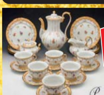
Porzellan namhafter Hersteller**