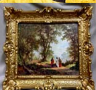
Gemälde aller Art**