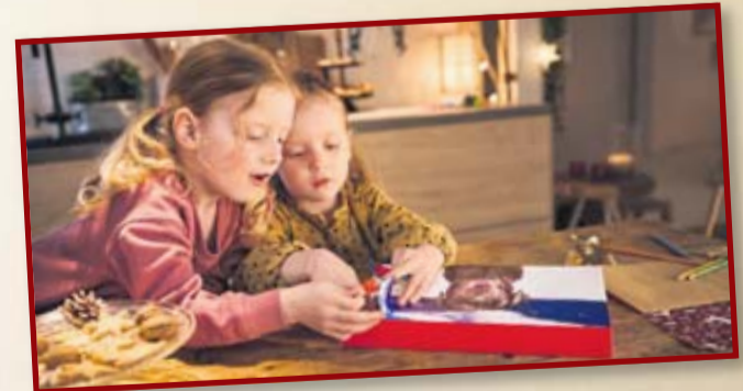
Vorfreude auf Weihnachten: Ein kreativ gestalteter Adventskalender verkürzt die Wartezeit bis zum Fest.

Statt den aufgebrauchten Adventskalender nach Weihnachten zu entsorgen, verwandelt er sich mit wenig Aufwand in ein liebevolles Silvester-Mitbringsel. So funktioniert's: Kerzenreste oder Wachs einschmelzen und mit einem Docht in die Mulden des leeren Kalenders gießen. Ist das Wachs fest, werden die einzelnen Mulden auseinandergeschnitten und jeweils mit Fotos – zum Beispiel mit den Türchenmotiven des Adventskalenders – dekoriert. Am Silvesterabend werden die kleinen Kerzen aus der Umhüllung genommen, auf einem Löffel angezündet, eingeschmolzen und in kaltes Wasser gegossen. Das geformte Stück kann dann gedeutet werden. (DJJ)