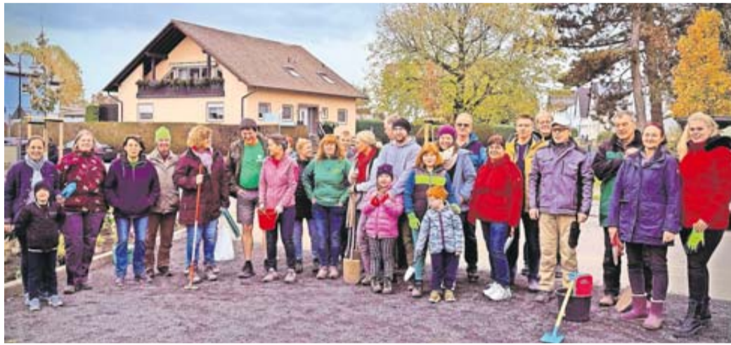
Die beteiligten bei der Aktion am Karl-Kempff-Platz im Stadtteil Beienheim.