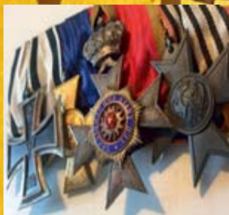
Militariat und Orden