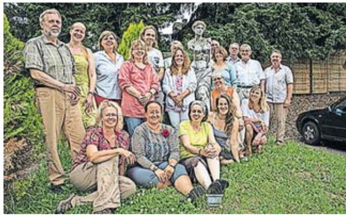
Sie stellen gemeinsam das Jahresprogramm vor.