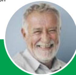
Abbildung Betroffenen nachempfunden, Name geändert. RUBAXX, Wirkstoff: Rhus toxicodendron Dtl. D6. Homöopathisches Arzneimittel bei rheumatischen Schmerzen in Knochen, Knochenhaut, Gelenken, Sehnen und Muskeln und Folgen von Verletzungen und Überanstrengungen. • Zu Risiken und Nebenwirkungen lesen Sie die Packungsbeilage und fragen Sie Ihre Ärztin, Ihren Arzt oder in Ihrer Apotheke. • PharmaSGP GmbH, 82166 Gräfelfing

„Lange Zeit habe ich mich mit rheumatischen Gelenkschmerzen geplagt, bis ich durch Empfehlung dieses Medikaments eingekommen habe. Schon nach zwei Wochen habe ich eine Besserung verspürt. Ich kann dieses Medikament nur jedem weiterempfehlen.“ Dieter W.