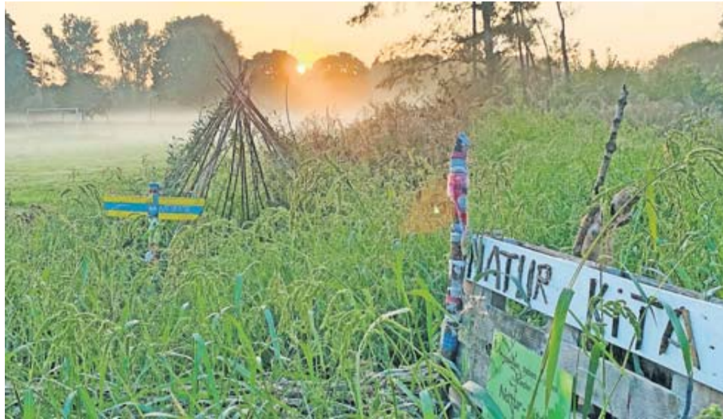
Natur-Kita am Limespark.

Am „Hässeler Weiher“ haben alle Interessierten die Möglichkeit, die positiven Auswirkungen einer extensiven Beweidung zu beobachten. Durch eine begrenzte Anzahl von Tieren pro Flächeneinheit soll das auf der Weide zur Verfügung stehende Futter im Sommer nur zum Teil abge-