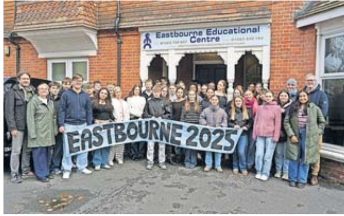
Gelungene Sprachreise nach Eastbourne.

Schlüchtern. Müde, aber gespannt machten sich 50 Schülerinnen und Schüler der Jahrgänge neun und zehn des Ulrich-von-Hutten-Gymnasiums auf den Weg nach Eastbourne. Begleitet wurden sie von Pfeifer, Kolb, Ickes und dem Leiter der Fahrt, Brasch. Nach einer mehrstündigen Busfahrt erwischte sie eine frühere Fähre in Calais. In diesem Jahr benötigte man für die Einreise nach Großbritannien zusätzlich zum gültigen Reisepass eine ETA-Reise genehmigung. Um 20 Uhr Ortszeit kamen sie in Eastbourne beim Treffpunkt an, wo sie von den Gastfamilien abgeholt wurden. Der Dienstag begann mit einem Frühstück in der Gastfamilie und dem ersten Block Sprachunterricht im Eastbourne Educational Centre, wo der Gruppe vier britische Lehrer zur Verfügung standen. In Kleingruppen fand eine intensive sprachliche und landeskundliche Schulung statt. Gegen Mittag erkundeten die Schülerinnen und Schüler erstmals Eastbourne, eine typische Seestadt mit über 100.000 Einwohnern, und konnten etwas essen. Nach der Freizeit trafen sich alle vor der Schule für eine Stadtführung und Rallye. Geleitet von den vier Lehrern, liefen alle im Anschluss zum Pier. Von dort aus hatten sie einen beeindruckenden Blick aufs Meer und auf die Stadt.