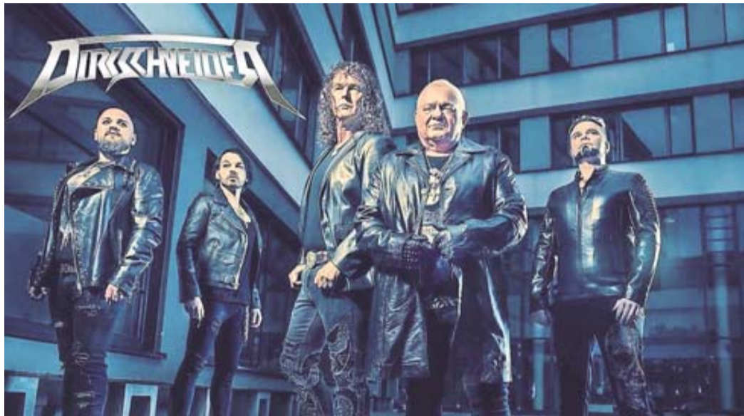
Mit DIRKSCHNEIDER kommt eine absolute Wacken-Legende nach Ulmbach.