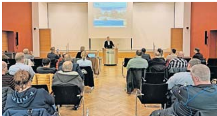
„Landwirtschaftliche Betriebe bringen nicht nur Wertschöpfung in die ländlichen Räume, sie stehen auch für kurze Transportwege und frische regionale Lebensmittel“. Erster Kreisbeigeordneter bei seiner Ansprache an heimische Landwirtinnen und Landwirte.