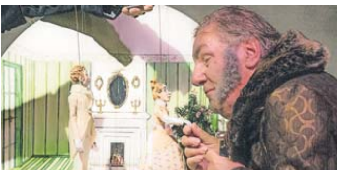
Das Theatrum Steinau bringt „A Christmas Carol“ zurück auf die Bühne.

Steinau. Wenn im Theatrum Steinau jemand „Humbug!“ ruft, dann bedeutet das nur eines: Endlich ist wieder Weihnachten. Und endlich kehrt wie jedes Jahr die wohl berühmteste Weihnachtserzählung der Welt zurück auf die wunderschöne Bühne des Theaters in Steinau.