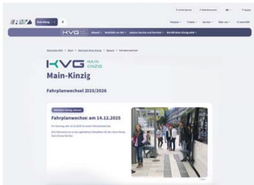
Alle wichtigen Infos zum diesjährigen Fahrplanwechsel finden Sie unter rmv.de/fahrplanwechselsmkk .

Zudem enden die Züge der Sinntalbahn (RB53) nicht mehr in Schlüchtern, sondern in Flieden. Dort bestehen zeitnahe Anschlüsse an die Regionalexpresszüge nach Frankfurt und Fulda.