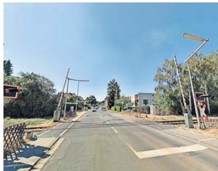
Die Deutsche Bahn baut am Bahnübergang Waldstraße.

Als Gründe für die deutliche Verzögerung nennt die DB sich verzögernde Materiallieferungen, schwierige Bodenverhältnisse und aufwendige Leitungsarbeiten. Für die Verkehrsteilnehmenden bedeutet dies, dass die Sperrung des Bahnübergangs in der Waldstraße für den Kraftfahrzeugverkehr bis voraussichtlich 26. Januar 2026 bestehen bleibt. Die Gleisüberquerung für Fußgänger ist weiterhin über den provisorischen Überweg möglich. Laut DB sind ab dem 14. Dezember 2025 weiterhin Nachtarbeiten möglich. Über die Weihnachtsfeiertage und den Jahreswechsel, vom 22. Dezember 2025 bis einschließlich 1. Januar 2026, sollen die Arbeiten ruhen.