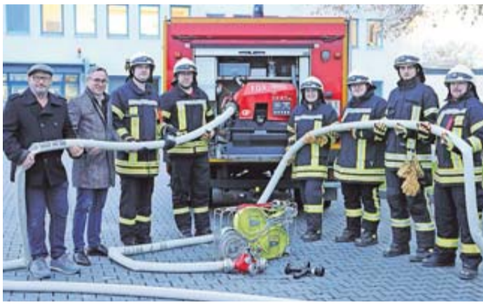
Die neue Pumpe der Feuerwehr.

Wölfersheim. Schlauch dran, Hahn auf, löschen? Ganz so einfach, wie es sich manch einer vorstellen mag, ist ein Feuerwehreinsatz nicht. Damit das Löschwasser aus dem Fahrzeug, dem öffentlichen Leitungsnetz oder einer Entnahmestelle mit dem richtigen Druck bei den Einsatzkräften ankommt, sind spezielle Pumpen erforderlich. Das Einsatzfahrzeug der Wohnbacher Feuerwehr wurde nun mit einer neuen modernen, leistungsstarken Pumpe ausgestattet.