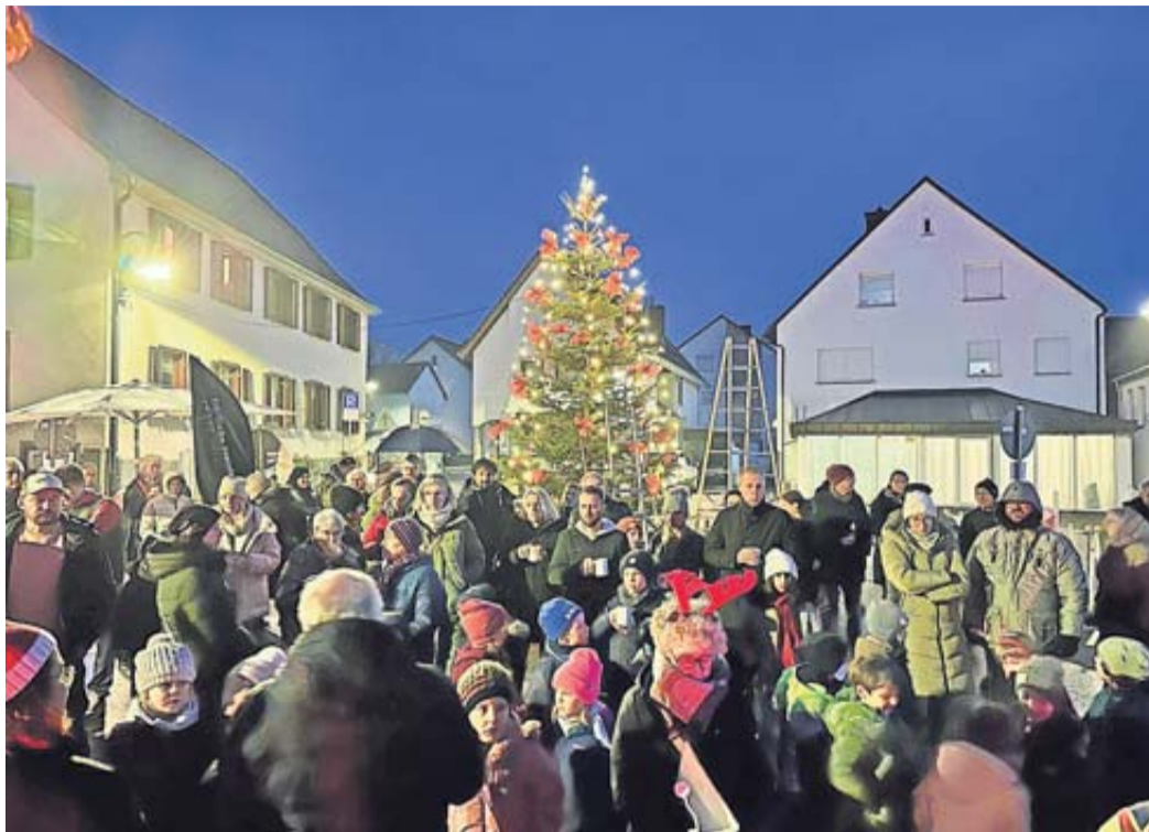
Festlicher Schmuck in der Dorfmitte von Steinfurth.

Auch der Verein Menschen in der Nähe war mit seiner Wunschbaumaktion dabei. Die Wünsche, welche von Kindern und Erwachsenen zuvor per Wunschzettel abgegeben wurden, können nun in den nächsten Wochen vom Baum gepflückt und erfüllt werden. Der Rosenlöschchor der Freiwilligen Feuerwehr Steinfurth, der extra für diese Aktion Weihnachtslieder einstudierte und dadurch nicht nur zum Mitsingen einlud, sorgte für eine besinnliche und vor-