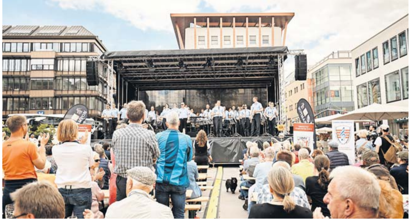
Vom 11. bis 13. Juni 2027 wird Büdingen Austragungsort eines der größten Musikereignisse Hessens und damit im Rahmen der Landesgartenschau Oberhessen 2027 zur Bühne für die vielfältige Amateurmusikszene des Landes. Die Entscheidung des Hessischen Musikverbandes unterstreicht die große Bedeutung der Blas- und Spielleutemusik in Büdingen und der Region.