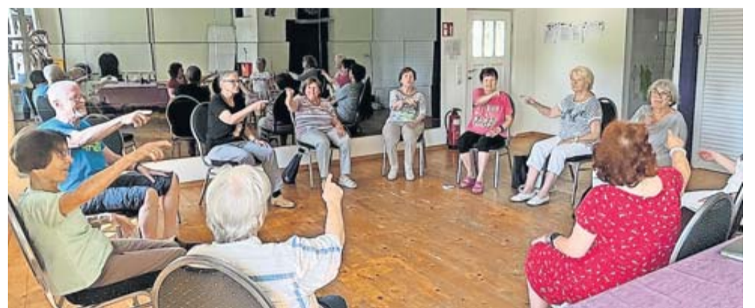
Gemeinsam bewegen: Sitztanz im Haus der Begegnung.