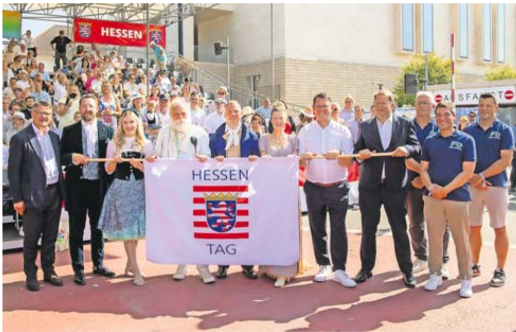
Der Hessentag war in vielerlei Hinsicht ein Gewinn für Bad Vilbel.

Die Stadt Bad Vilbel kann für den Hessentag auch finanziell ein ausnahmslos positives Fazit ziehen. Rund 7,75 Millionen Euro beträgt der Überschuss. Dem operativen Defizit von 4,9 Millionen Euro stehen 12,65 Millionen Euro Zuschüsse für 23 investive Maßnahmen gegenüber, die vor dem Hessentag oder dank des Hessentags umgesetzt wurden und werden. Zu den Gesamtausgaben im operativen Geschäft von rund 14,52 Millionen Euro gehören beispielsweise die Bereiche Infrastruktur (5,2 Millionen Euro), Sicherheit (3,2 Millionen Euro) und die Öffentlichkeitsarbeit (540.000 Euro). Dem ge-