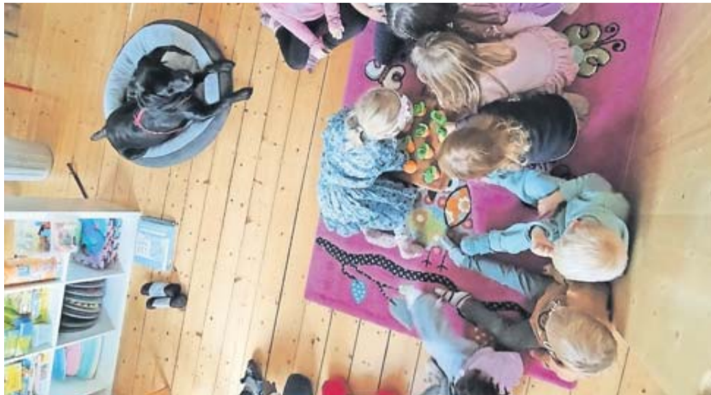
Runa, eine zweijährige Labradorhündin, sorgt für leuchtende Kinderaugen.

Begleithündin Runa kommt regelmäßig zu Besuch