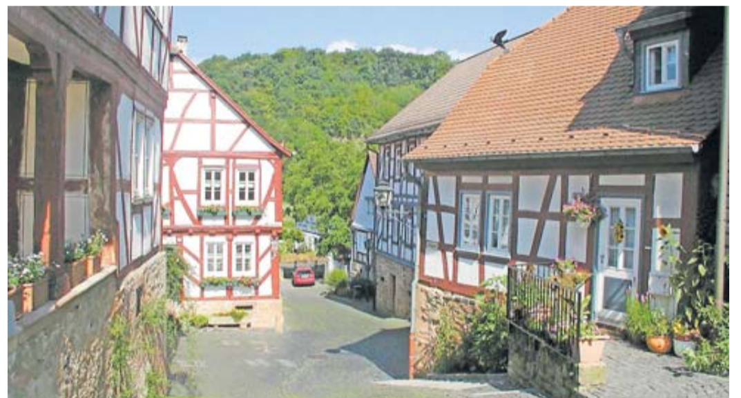
Historische Ortskerne möchte die Gesellschaft für Wirtschaftsförderung und Regionalentwicklung im Wetteraukreis mbH durch die Erstbauberatung in der LEADER-Region Wetterau/Oberhessen erhalten und nachhaltig stärken.

Gefördert wird eine qualifizierte Erstberatung durch ein Fachbüro aus dem Auswahlpool der Dorf-Akademie. Diese Beratung umfasst bis zu sechs Stunden und ist für Teilnehmende vollständig kostenfrei. Beratungsgutscheine können für Gebäude mit einem