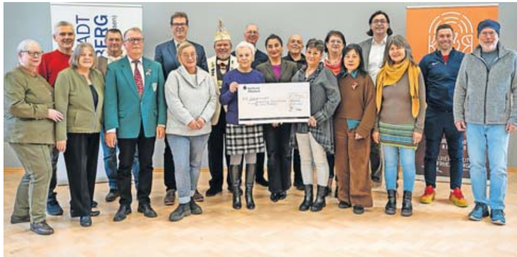
Gemeinsame Spendenübergabe im Rathaus: Vertreter der geförderten Friedberger Vereine nahmen symbolisch den Spendenscheck entgegen.

Die Spenden stammen aus der langjährigen Partnerschaft mit der ESO Offenbacher Dienstleistungsgesellschaft mbH, die als Betreiberin