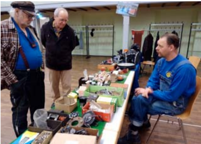
Kommen Sie zum Oldtimer-Teilemarkt des Oldtimer-Club Steinfurth am 31. Januar.

Der Markt findet im Rosensaal Steinfurth in 61231 Bad Nauheim, Bad Nauheimer Straße 11, statt. Standgebühren betragen für Mitglieder des Veteranen-Fahrzeug-Verbandes (VFV) zehn Euro, für Nichtmitglieder 20 Euro. Die Stände sind etwa drei Meter mal 2,50 Meter groß. Achtung: Die Verkaufsstände sind fast alle reserviert, es gibt nur noch wenige freie Plätze. Weitere Informationen und Anmeldung für die letzten freien Plätze über die Homepage (oldtimerclub-steinfurth.de) oder telefonisch beim Vorsitzenden Christian Wölflick unter Tel. 06032/85454.