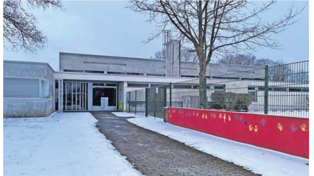
Die Sporthalle an der Gönser Grund Schule kann wieder genutzt werden.

Nachdem bau- und elektrotechnische Mängel am Gebäude festgestellt wurden, musste der Wetteraukreis als Schulträger die Sporthalle zunächst sperren. Davon betroffen waren sowohl der Schulsport als auch der Vereinssport. Hintergrund des Nutzungsverbots waren Erkenntnisse über Mängel an der Statik sowie der Elektrotechnik. Dank der Unterstützung der Stadt Butzbach konnte der Sportunterricht in die benachbarte Mehrzweckhalle verlegt werden. Die umgehend durch den Wetteraukreis veranlasste Prüfung des Gebäudezustands ergab, dass eine Gesamtanierung notwendig ist. Da diese Sanierung mit Planung und Durchführung mehrere Jahre dauern wird, wurden in den vergangenen Monaten einige Sofort-