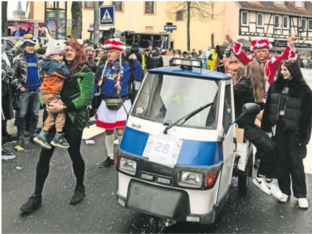
Der Schlüchterner Carneval-Club steuert auf die närrischen Höhepunkte der diesjährigen Kampagne zu.

Schlüchterner Carneval-Club startet in die Kampagne / Umfangreiches Programm