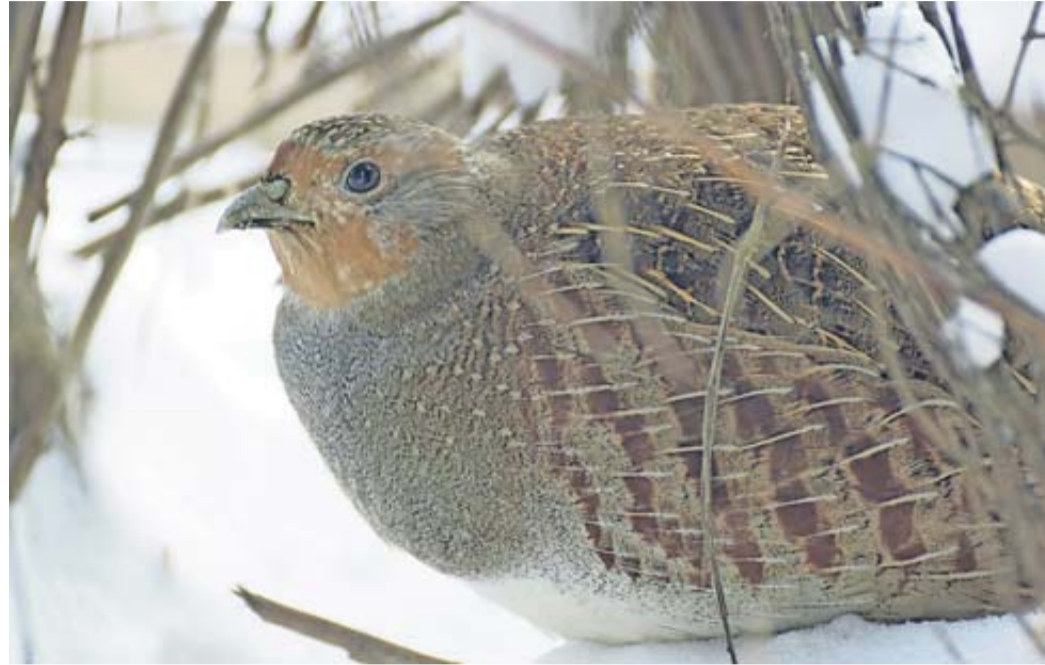
Leben im Energiesparmodus – bitte nicht stören! Gerade im Winter ist es wichtig, Rücksicht auf Rebhühner und andere Wildtiere zu nehmen.

Das Rebhuhn war im Landkreis Fulda einst weit verbreitet. In den vergangenen Jahrzehnten hat es allerdings stark an Boden verloren – im wahrsten Sinne des Wortes. Die Entwicklungen in der Landwirtschaft haben die Erträge, zum Beispiel beim Getreide, zwar fast verdoppelt, jedoch geht damit ein drastischer Lebensraumverlust einher. Hinzu kommt die Flächenversiegelung: Seit den 1980er Jahren sind im Landkreis Fulda mehr als 6.000 ha landwirtschaftliche Fläche un-