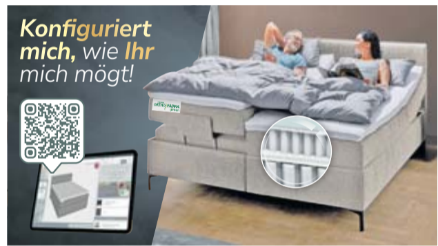
Jetzt Original Orthopädie Liegekomfort bequem online konfigurieren und bestellen oder vor Ort in Ruhe Probeliegen und von unserer Expertenberatung profitieren.

Das neue Jahr hat begonnen und das möchten wir gemeinsam mit Ihnen feiern! Besonders freuen wir uns über eine tolle Auszeichnung: Wir wurden vom Deutschen Institut für Service-Qualität (DISQ) als Testsieger unter allen deutschen Polstermöbel-Fachmärkten für herausragende Spitzenleistungen in Beratung, Service und Produktqualität ausgezeichnet. Dieser Erfolg macht uns stolz – und wäre ohne Sie nicht möglich gewesen. Deshalb sagen wir Danke und laden Sie herzlich zu unserer großen Danke-Aktionswoche ein. Ein Zeichen unserer Wertschätzung für Ihr Vertrauen, Ihre Treue und Ihre Begeisterung. Wir sagen DANKE ... ... an Sie, unsere Kunden, die uns Ihr Vertrauen schenken und uns mit ihren ehrlichen Google-Bewertungen mit 4,8 Sternen zeigen, wo wir wachsen, lernen und uns weiterentwickeln können. ... an unsere Mitarbeiter und ihre Familien, die täglich mit sehr viel Leidenschaft und Engagement unsere gemeinsame Visionen leben. ... an unsere Geschäfts- und Industriepartner, die unsere hohen