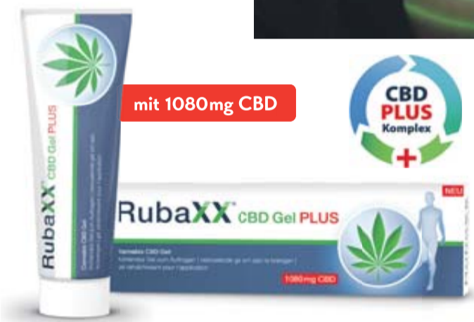
*CBD Gels; Absatz nach Packungen, Quelle: Insight Health, MAT 01/2025 • Rubaxx CBD Gel PLUS ist ein Kosmetikum und enthält CBD, kein THC. • Abbildung Betroffenen nachempfunden

Für Ihre Apotheke: Rubaxx CBD Gel PLUS (PZN 20136718) www.rubaxx.de