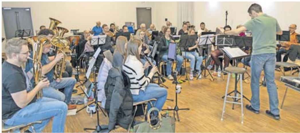
Der Musikverein probt für das Konzert.

Vielfältiges Programm mit Originalkompositionen und Medleys