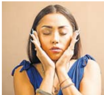
Menschen fassen sich etwa 800 Mal am Tag ins Gesicht: Diese Berührungen helfen, Stress zu reduzieren und Emotionen zu regulieren.