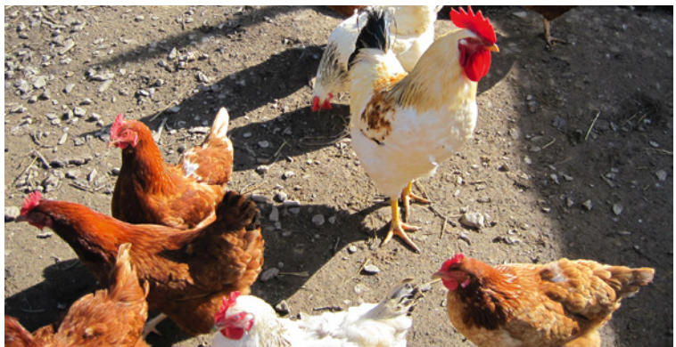
Eine glückliche Hühnerschar

Walluf ist von Bomben fast ganz verschont geblieben. Soweit ich weiß, sind nur zwei dieser Sprengkörper in Oberwalluf niedergegangen. Eine Bombe landete in einem Hühnerstall als Blindgänger. Der Herr der Hühner hatte offenbar starke Nerven und zog den unangenehmen Fremdkörper mit einer Harke bis auf die Straße, wo er dann irgendwann entsorgt wurde. Ob die Legeleistung der Hennen infolge dieser Aufregung nachließ, ist nicht bekannt.