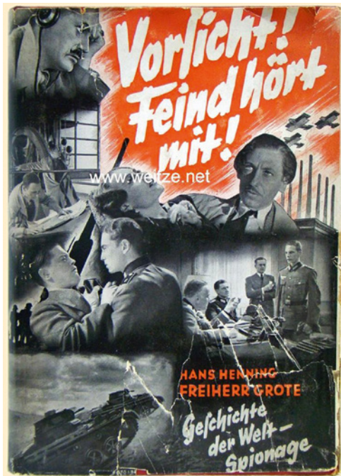
Abb. 1: Buchtitel „Vorsicht! Feind hört mit!“

Es gab fast täglich Bombenalarm. Sobald die Sirenen losheulten, wurden wir Kinder schnell nach Hause geschickt. Alle Kinder machten sich voller Angst und so schnell sie konnten nach Hause. Ich erinnere mich an ein Gefühl der Erleichterung, zuhause angekommen zu sein. Auch Papa und Mama waren jedes Mal froh. Papa wartete am Gartentor, bis wir alle da waren. Erst dann kam er auch in den Keller. Manchmal blieben wir auch gleich zuhause, wenn wir eine Frühwarnung vor bevorstehenden Angriffen erhalten hatten.