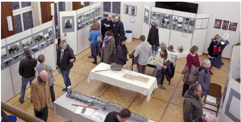
Reges Interesse und großer Besucherandrang in der Ausstellung

Bei den Vorbereitungen zu dieser Ausstellung sind wir auf die erschütternde Erkenntnis gestoßen: „Für die Betroffenen machte es keinen Unterschied, ob sie absichtlich bombardiert oder ‚nur‘ durch Fehlwürfe auf vermeintlich militärische Ziele heimgesucht wurden.“ Auch wenn das „Nie wieder Krieg“ schon lange weltweit wieder ad absurdum