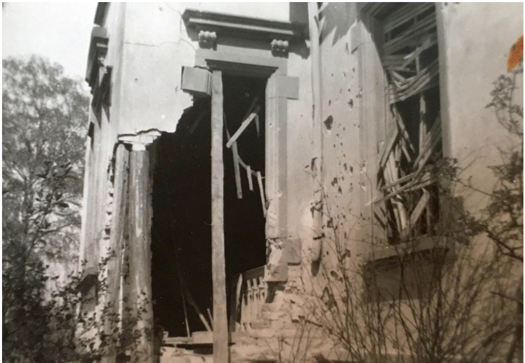
Abb. 2: Erker und Hauswand Kiedricher Straße 20 nach der Detonation

Als die ersten Wagen der Amerikaner durch Eltville rollten, waren wir erleichtert, und Papa hisste ein weißes Bettlaken als Fahne auf unserem Hausdach. (Anmerkung der Redaktion: Das Heraushängen von weißen Fahnen bedeutet Kapitulation bzw. den Verzicht auf Gegenwehr.)