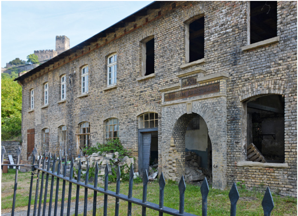
Abb. 1: Eingang zum Schieferstollen "Wilhelm Erbstollen"

Eines Tages, wir saßen beim Mittagessen, kamen Bomber so tief durch das Rheintal geflogen, dass wir die Piloten erkennen konnten. Wir kleineren Kinder ließen vor Angst das Besteck fallen und rannten in den Hof, stülpten die leeren Kohleimer über den Kopf und dachten, so nicht gesehen zu werden. Als der Spuk vorüber war und wir die Eimer vom Kopf nahmen, sahen wir erst, wie schwarz wir waren, und mussten trotz der Angst herzhaf