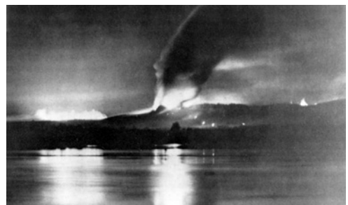
Abb. 1: Bombardierung von Schloss Johannisberg am 13. August 1942

Ich war beim Brand des Johannisbergs vier Jahre alt, und das schaurige Bild des brennenden Johannisbergs prägte sich tief in mein Gedächtnis ein. Noch lange nach Kriegsende erinnere ich mich bei Besuchen im Strandbad Frei-Weinheim an den schauerlichen Anblick der ausgebrannten Schlossruine auf der gegenüber liegenden Rheinseite. Die „Gerüchteküche“ lief damals auf Hochtouren. Die einen erzählten, Schuld sei ein nicht verdunkeltes Licht auf dem benachbarten „Schloss Hansenberg“ gewesen, das den Bombenabwurf ausgelöst habe. Andere wiederum erzählten von einem Zufallstreffer übrig gebliebener Bomben vom vorausgegangenen Angriff auf Mainz, oder es sei ein Fehlwurf gewesen. Was auch immer: Der Anblick des brennenden Schlosses Johannisberg war erschütternd und löste bei Sirenenalarm in mir zum ersten Mal Ängste und Beklemmungen aus. Bei Sirenenalarm bedeutete dreimal Aufheulen „Voralarm“ und sechsmal jeweils auf- und abschwellend „Vollalarm“. Dann sollten die Menschen Schutz im Luftschutzkeller gesucht haben.