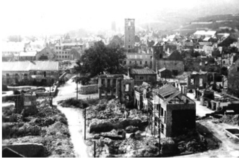
Rüdesheim war zu fast 60 Prozent zerstört. Große Teile der Altstadt lagen in Trümmern.

Immer mehr kamen wir zu der Erkenntnis, dass das - vermutlich - eigentliche Angriffsziel an jenem Tage Bingen, genauer Bingerbrück, und hier der große Rangierbahnhof, und nicht Rüdesheim sein sollte. Hatten wir hier den Schlüssel in der Hand, um endlich nach 75 Jahren die, wenn auch traurige, Gewissheit zu vermitteln? Die Gewissheit, auch wenn sie den Opfern von damals nicht mehr helfen kann, dass Rüdesheim nicht absichtlich, sondern mehr oder weniger „nebenbei“ bombardiert worden ist. Heute würde so etwas lakonisch „Kollateralschaden“ genannt werden.