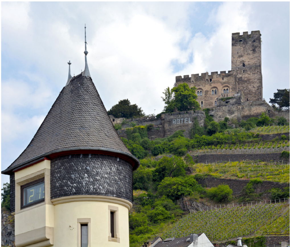
Abb. 2: Der Kauber Pegel und die Burg Gutenfels