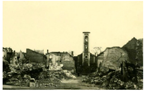
Blick auf die ev. Kirche vor und nach dem Katharinentag

ner Schülerin oder Schülers: „...hoffentlich passiert so etwas nicht [nie] wieder ...“