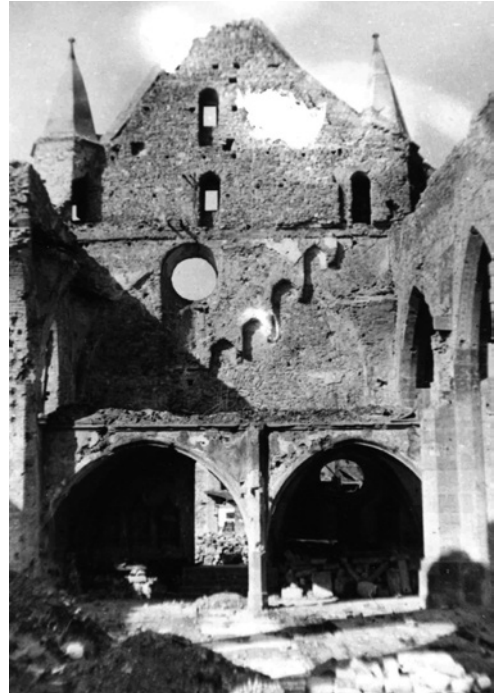
Ruine der Westwand der St. Jakobus-Kirche

Kaum eine Viertelstunde dauerte dieser Bombenangriff auf Rüdesheim, zu kurz für den menschlichen Geist, um zu erfassen, was geschehen war. Die Überlebenden versuchten instinktiv, zunächst sich selbst zu retten und zu entfliehen, und es dauerte oft eine Weile, um zu begreifen, dass Andere zu schützen und zu bergen waren. Es ist die Fassungslosigkeit, die lähmt, bevor man erkennt, das Richtige zu tun. Doch was war richtig? Waren die Bomber fort? Konnte man aus dem dunklen Keller ins Freie stürzen? Wie sah es draußen aus? Gab es überhaupt ein Entrinnen?