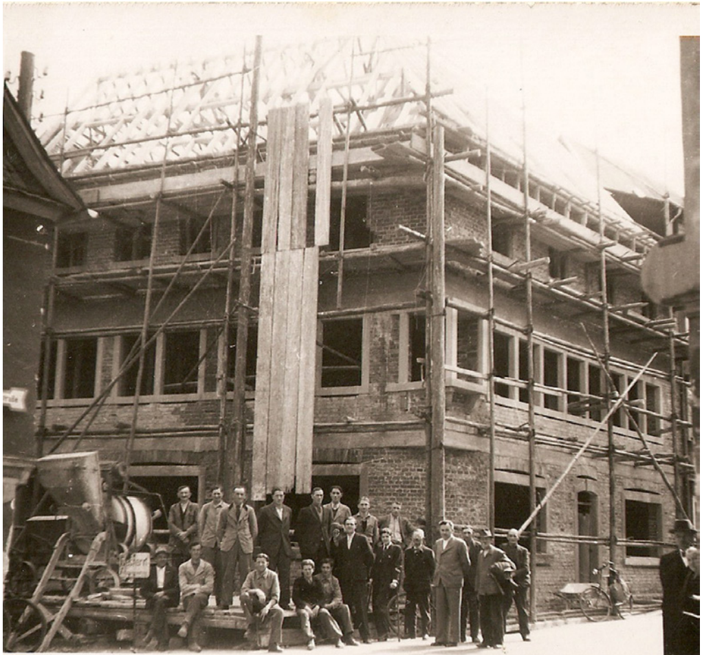
Abb. 2: Richtfest beim Wiederaufbau der „Mutter Müller“ 1946