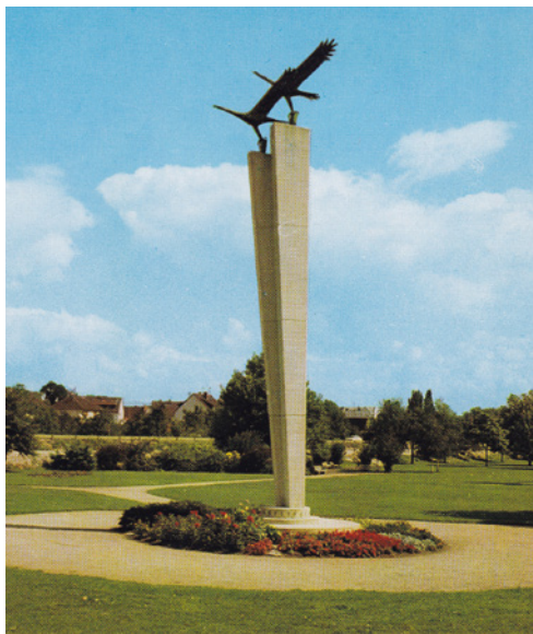
Das 1959 eingeweihte Jagdflieger-Ehrendenkmal in den Rheinanlagen von Geisenheim

Die zahlenmäßige Überlegenheit der britischen und amerikanischen Luftstreitkräfte wurde immer deutlicher. Daran konnten auch die deutschen Jagdflieger trotz großer Kühnheit und Tapferkeit nichts ändern. Auf Betreiben des Jagdfliegers und späteren Bürgermeisters der Stadt Geisenheim Konrad Branden wurde den Jagdfliegern nach dem Krieg in der Geisenheimer Rheinanlage ein Denkmal errichtet. 2