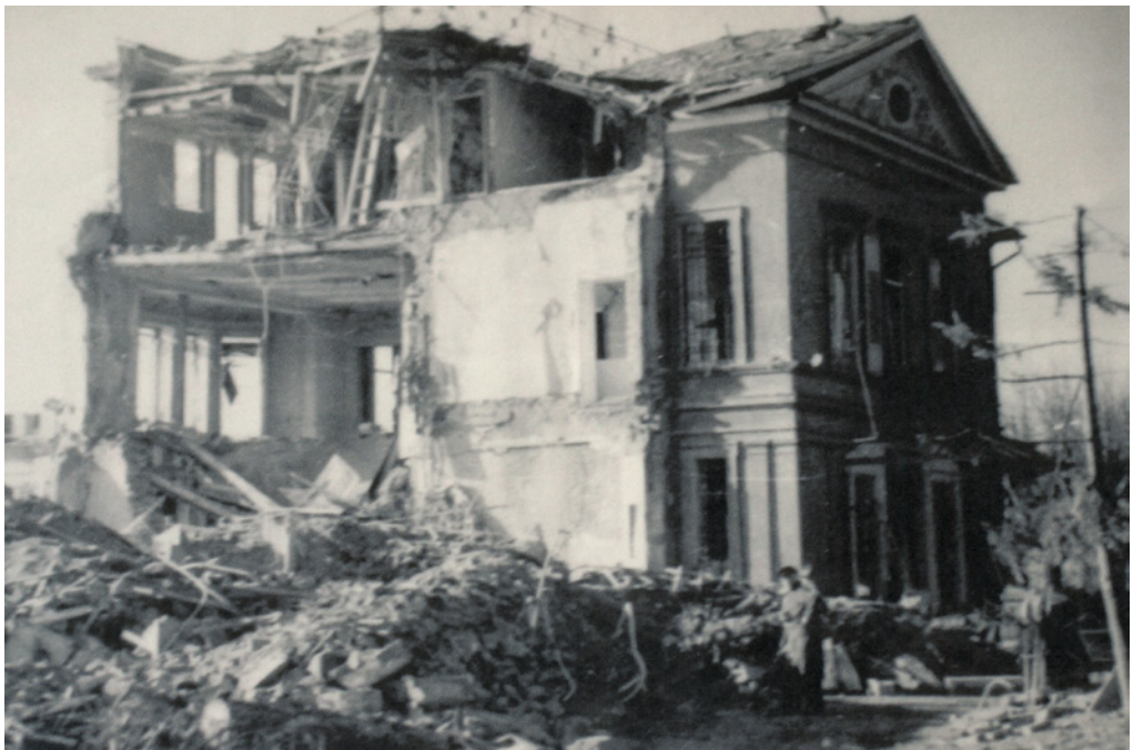
Abb. 3: Die zerstörte Villa Boltendahl