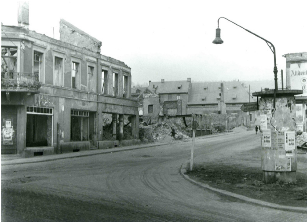
Grabenstraße, heute: Rheingauer Volksbank und im Vordergrund der ehemalige „Bäckerbub“

Die Rüdesheimer kannten die Schrecken des Krieges nur vom Hörensagen, aus den Berichten von den Luftangriffen auf deutsche Großstädte. Doch am 25. November 1944 um 12:14 Uhr sollten sie selbst erfahren, was Krieg, Schrecken und Todesangst sind: Da war anfangs das Dröhnen von wenigstens 800 schweren Flugzeugmotoren im Anflug, dann folgte das Rauschen und Heulen der aus rund 5000 Metern herabstürzenden Sprengbomben. Jede von ihnen war 227 kg schwer, ca. 25 cm dick, 70 cm lang. Die Detonation einer Sprengbombe in nächster Nähe war ein Knall, wie man ihn nie im Leben gehört hatte, wahrlich ohrenbetäubend und atemraubend. Die Druckwellen erschütterten auch die stärksten Keller wie ein Erdbeben, so dass die Menschen zu Boden stürzten. Putz und Steine fielen herab, man schlug unwillkürlich die Arme über den Kopf. Selbst die abgefeimtesten Atheisten stöhnten „Oh Gott! Oh Gott!“ und begannen in den Sekunden der Angst zu beten.