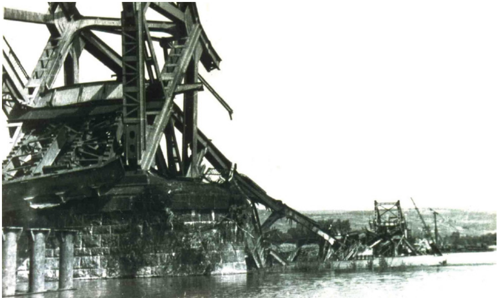
Die bei einem Fliegerangriff auf Bingen am 13. Januar 1945 zum Einsturz gebrachte Hindenburgbrücke. Am 15. März wurde das Zerstörungswerk von deutschen Pionieren vollendet.

Wenn z. B. eine Autorin schreibt, dass sie heute noch in Panik gerät, wenn sie das Heulen einer Sirene hört. Mit diesen hier zusammengetragenen Berichten soll das Verbrechen des Hitlerkrieges in keiner Weise relativiert werden, aber es erscheint doch angezeigt, die unmittelbar Betroffenen einmal authentisch zu Wort kommen zu lassen.