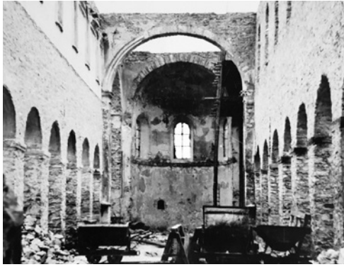
Abb. 2: Die zerstörte Kirche von Johannisberg