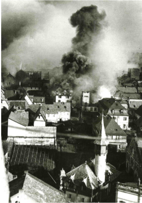
Kaum eine Viertelstunde dauerte der Bombenangriff auf Rüdesheim.