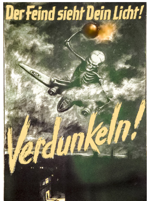
Abb. 2: „Verdunklungspflicht“ zum Schutz vor nächtlichen Fliegerangriffen

Sicher ist von diesen Erlebnissen nach beinahe 75 Jahren einiges aus dem Gedächtnis an die Jahre des Zweiten Weltkriegs und die damalige Kinderzeit verloren gegangen. Ich habe mich bemüht nach gründlicher Erinnerung diese Zeilen niederzuschreiben.