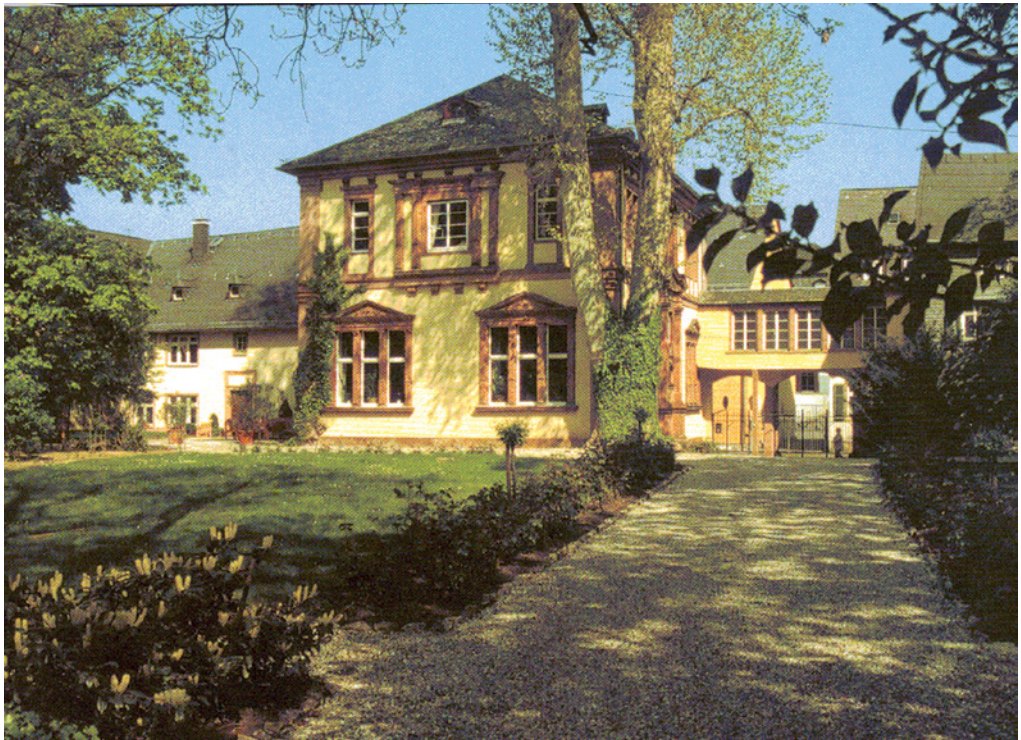
Abb. 4: Der Langwerther Hof: Von den Amerikanern als Quartier genutzt

Gilda Ebersbach, die in einer Villa an der Wallufer Straße wohnte, erinnerte sich an die letzten Kriegstage: 4 Die tiefen Weinkeller der Weinbauschule boten den ehemaligen Bewohnern der Wallufer Straße Schutz vor den Fliegerangriffen. Die übrigen Villen waren für die Stellen der Partei und der Wehrmacht beschlagnahmt. Auf dem Gelände der Villa Rheinberg war eine Reihe von Baracken entstanden, in denen Soldaten und auch Wehrmachts- bzw.