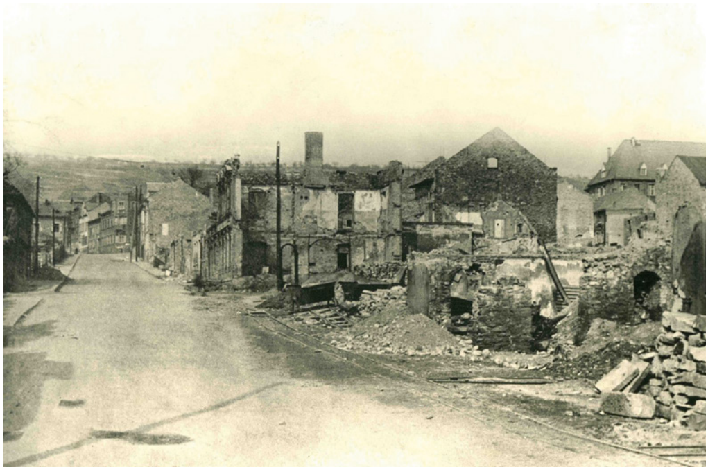
Das zerstörte Rüdesheim – Blick über die Grabenstraße Richtung Ringmauer