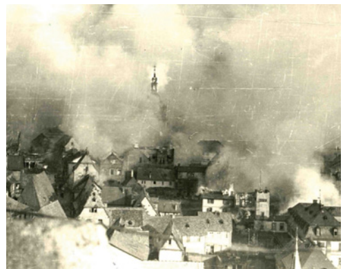
Das brennende Rüdesheim

Unsere Suche galt dem 25.11.1944 und dem Wort „Rüdesheim. Wir hofften in diesen unzähligen Dokumenten endlich den entscheidenden Hinweis zu finden, warum Rüdesheim damals bombardiert wurde. Gerne hätten wir auch dazu beigetragen, dass die verschiedenen, manchmal sehr abstrusen Spekulationen über die Hintergründe des Katharinentages endlich verstummen würden, wenn der eigentliche Grund bekannt wäre. Nicht mehr die Versammlung der Nazis am Nationaldenkmal. Oder die immer wieder in diversen Erzählungen auftauchenden, aber nie in natura zu sehenden Flugblätter, die angeblich von der geplanten Zerstörung von Rüdesheim berichtet hätten. Das Einzige, was wir für unsere Gegend unter dem Datum 25.11. fanden, war: BINGEN. Für jenen 25. November 1944 galt neben der Stadt Merseburg auch Bingen als Angriffsziel. In Merseburg sollten die LEUNA-Werke (synthetische Öl-