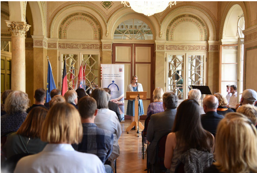
links: Eröffnung der Veranstaltung durch Staatssekretärin Tanja Eichner