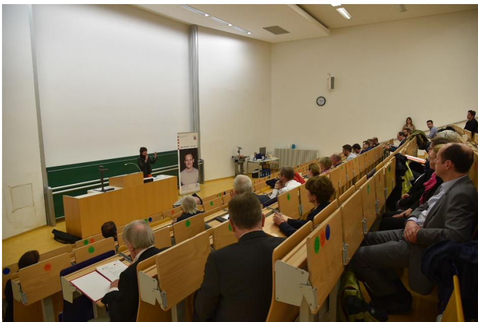
links: Treffen der Prävention in der Justus-Liebig-Universität Gießen

Nachdem das für den 3. November 2022 terminierte Treffen der örtlichen Präventionsgremien und des Landespräventionsrates leider ausfallen musste, fand es am Donnerstag, den 21. März 2023 in der Justus-Liebig-Universität, Campus Recht und Wirtschaft im Hörsaal 4 in Gießen statt. Das gemeinsam mit der Stadt Gießen erstellte Programm (Programm s.u.) war schwerpunktmäßig dem Thema "Beleidigungen, Bedrohungen, Hass und Gewalt gegen kommunale Amts- und Mandatsträgerinnen und Mandatsträger" gewidmet. Dieses aktuelle Thema erfordert eine wachsende Präventionsarbeit und verfolgt das Ziel, diesen teils subtilen, teils offenen Angriffen zu begegnen und derartigen Vorkommnissen nicht nur vorzubeugen, sondern diese gar nicht erst entstehen zu lassen. In den beiden Gesprächskreisen am Nachmittag des Veranstaltungstages konnten sich die Teilnehmenden über das Beratungsnetzwerk Hessen und das Haus der Prävention in Wetzlar und die dortige DEXT-Fachstelle informieren und darüber austauschen.