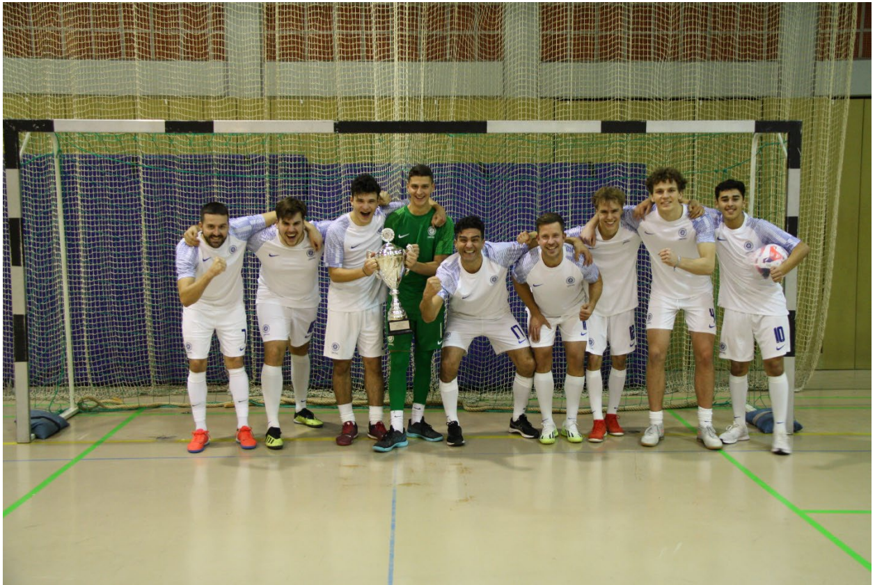
oben: Die Gewinnermannschaft des Tus Makkabi Frankfurt

Mit der Teilnahme der jüdischen Fußballmannschaft wird dem Turnier eine weitere Facette hinzugefügt und im Namen der Kriminalprävention ein klares Zeichen gegen den wachsenden Antisemitismus in unserer Gesellschaft gesetzt. Alle Mannschaften waren sehr engagiert und so kam es zu einem spannenden und sehr fairen Turnierverlauf, an dessen Ende sich die TuS Makkabi Frankfurt in einem ausgeglichenen Finale im Elfmeterschießen gegen den Fußballverein aus Rockenberg durchsetzte. Ganz im Sinne eines fairen Sportsgeistes entschieden sich die Spieler von Makkabi Frankfurt am Ende dafür, den Wanderpokal in der JVA zu belassen, um ihn dort bei nächster Gelegenheit zu verteidigen.