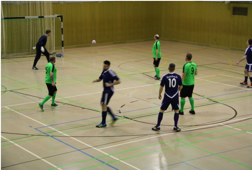
diese Seite: Fußballturnier in der JVA Rockenberg 2023