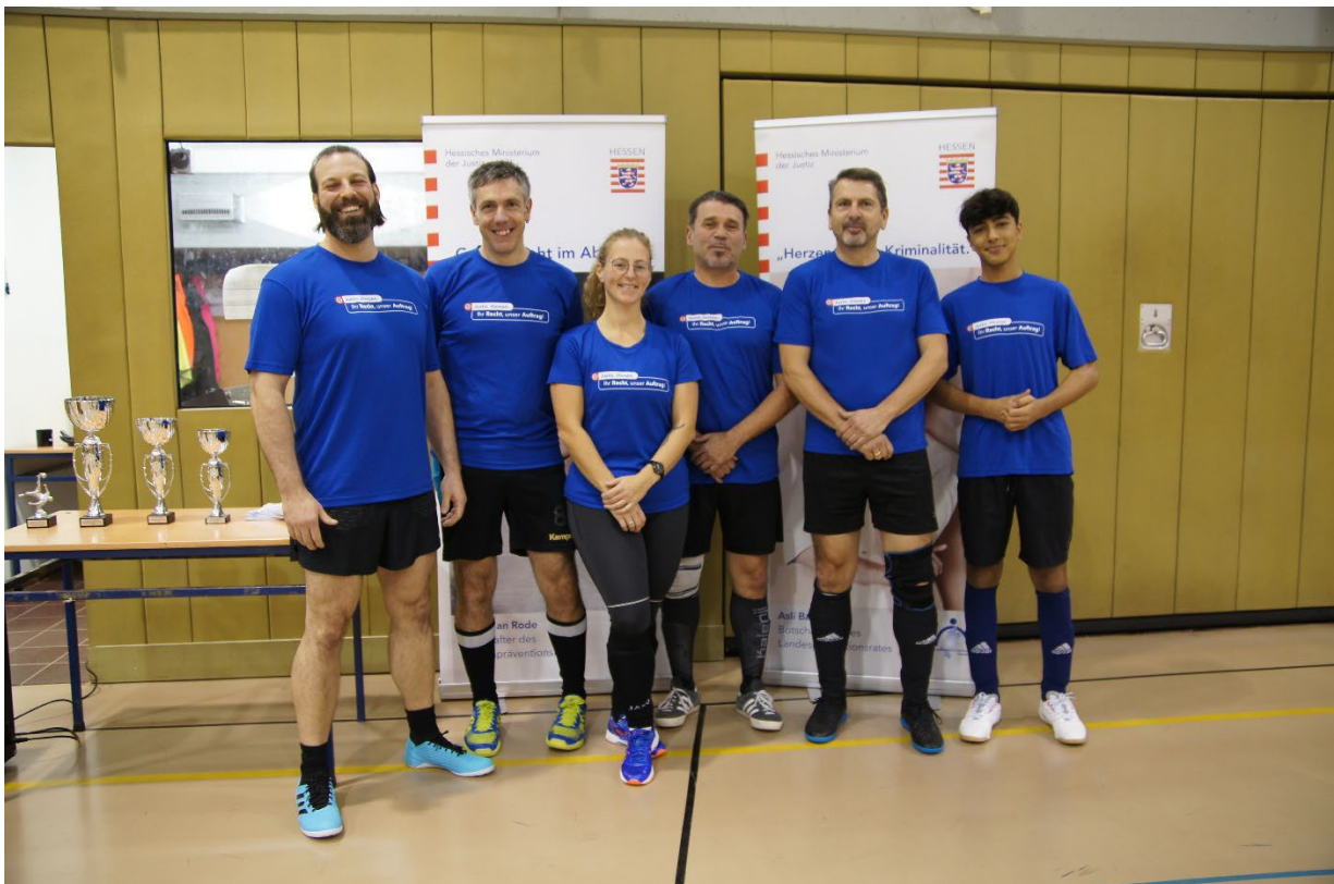
Das Team des HMdJ

Da das letzte Fußballturnier in der JVA Rockenberg bereits 2019 stattgefunden hatte, war es auch für die jungen Gefangenen ein ganz besonderer Tag. Insgesamt acht Teams nahmen an dem Turnier teil. Es spielten zwei Mannschaften der jungen Gefangenen aus der JVA Rockenberg, die Bedienstetenmannschaft der JVA Rockenberg, die SG Melbach, die Mannschaften von HMdJ/OLG und der Generalstaatsanwaltschaft Frankfurt am Main., sowie der Bundespolizei Frankfurt am Main und der Polizei Butzbach.