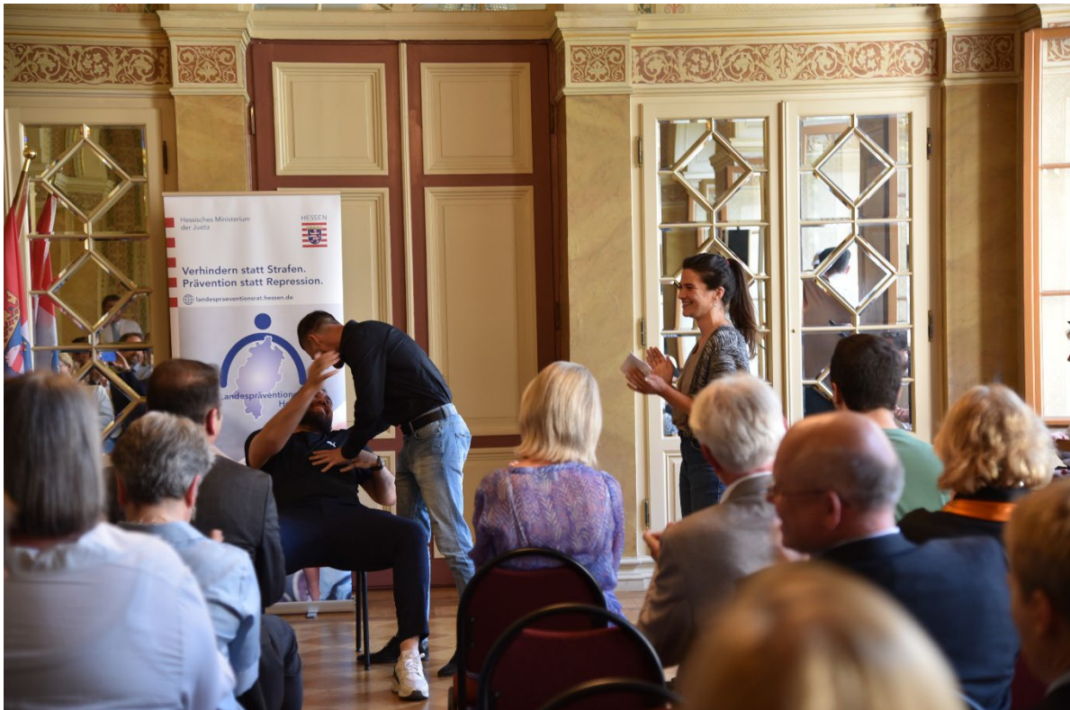
Präsentation des interaktiven Theaterstücks „Meschugge“