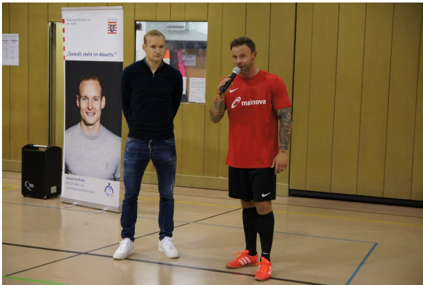
links und unten. Fußballturnier in der JVA Rockenberg 2022