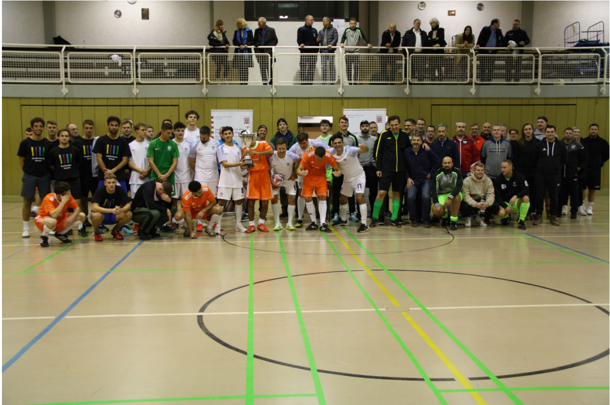
oben: alle Mannschaften des Turniers in der Sporthalle der JVA Rockenberg