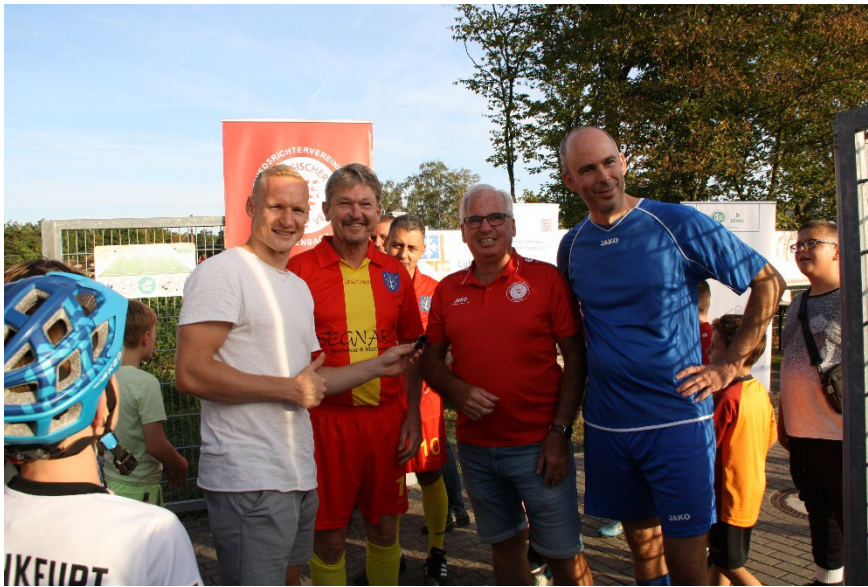
links und unten: Fußballspiel der hessischen Justiz gegen eine hessische Schiedsrichterauswahl in Rodgau