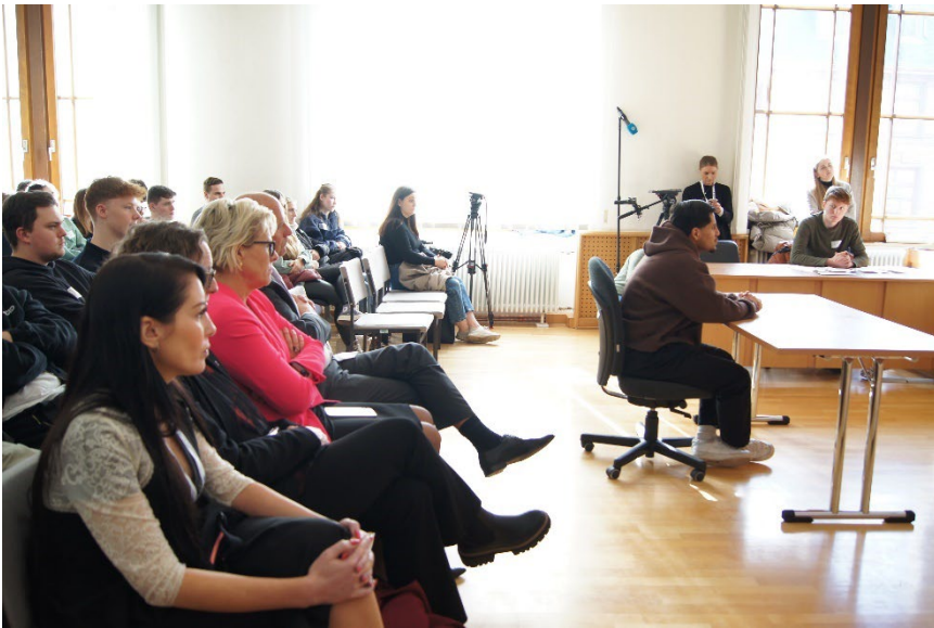
links und unten: Mitwirken in der Gerichtsverhandlung und Justizberufe Speed-Dating beim Amtsgericht Frankfurt am Main