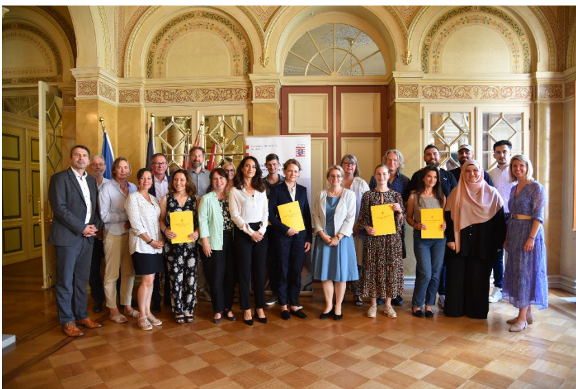
links: Die Preisträger des 13. Hessischen Präventionspreises