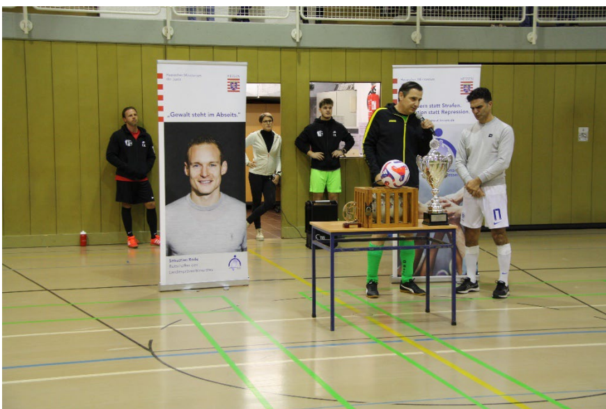
links. Fußballturnier in der JVA Rockenberg 2023