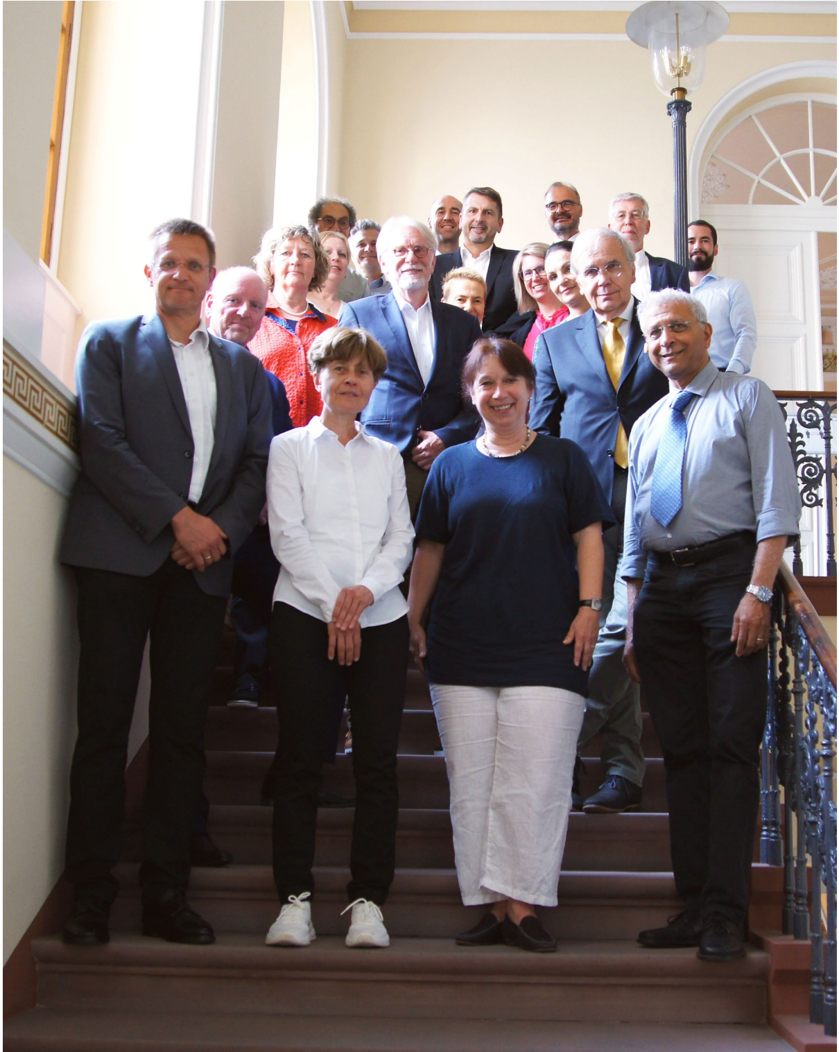
Mitglieder der Sachverständigenkommission der Hessischen Landesregierung