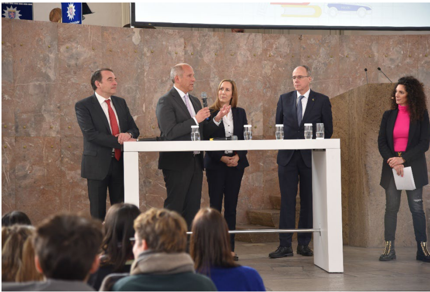
links und unten: Aufaktveranstaltung in der Paulskirche in Frankfurt/M.