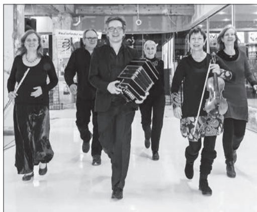
Am Samstag bei der Abendmusik in der Talkirche spielt das Tango-Sextett Flirteando.