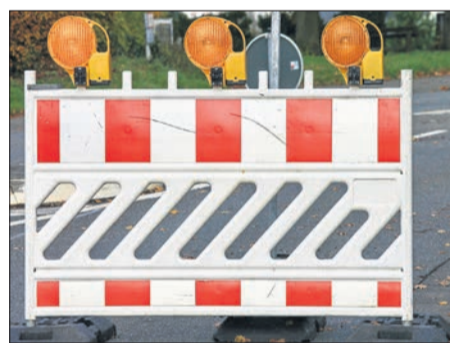
Erneut wird die Durchfahrt nach Lorsbach von Hessen Mobil für Monate gesperrt.

Laut Hessenmobil sind diese Sperrpausen langfristig koordiniert und seit drei Jahren bei der Bahn angemeldet. Die Brücke aus dem Jahr 1981 müsse dringend saniert werden, teilt Hessenmobil auf Anfrage mit: Geplant seien Arbeiten am Überbau und Unterbau der Brücke. Widerlager und Pfeiler sollen