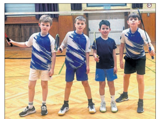
Die siegreiche erste U11-Mannschaft nach dem Spitzenspiel gegen Schwanheim.

Auch die Senioren waren mit der zweiten Mannschaft aktiv. In Hattersheim ging es gegen den Tabellenletzten der Bezirksliga. Die SGB hatte gute Chancen auf den zweiten der Tabelle aufzuschließen, verpasste aber diese Chance mit dem 4:4-Endstand. Noch vor den letzten beiden Einzeln stand es 4:2 für die SGB und alles sah nach einem erwartungs-