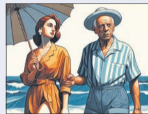
Françoise Gilot und Pablo Picasso. Picasso.