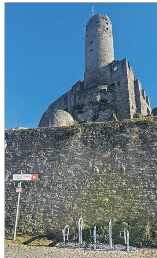
Am Westaufgang zur Burg stehen stabile Fahrradständer.

Pünktlich zur Fahrradsaison können Ritter oder solche, die gerne die Historie der Ritter auf Burg Eppstein erleben möchten, mit dem Fahrrad in die Burgstadt kommen. Elektrofahrräder können übrigens unweit von diesem Standort am Gottfriedplatz aufgeladen werden.