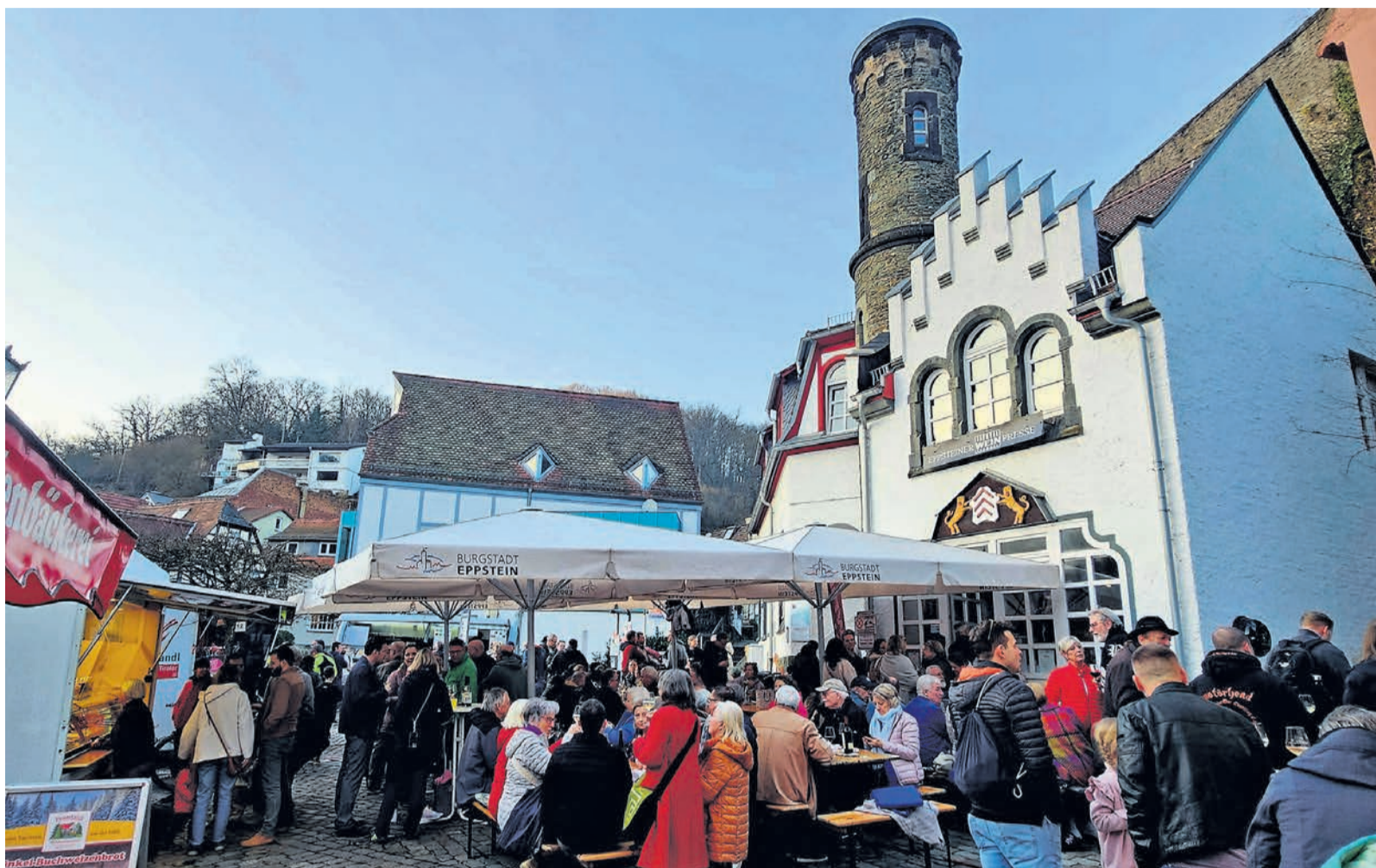
Buntes Treiben auf dem Gottfriedplatz. Beim Wochenmarkt trifft man sich und kommt ins Gespräch. Mehrere Einkaufsmöglichkeiten auf dem Marktgelände und im Umfeld stehen zur Verfügung.

Sonntag: Der BUND eröffnet seine Wanderungen mit der Nestschau . Treffpunkt ist um 14 Uhr am Rathaus-Parkplatz in Vockenhausen. Von 13 bis 16 Uhr Flohmarkt für Frühjahrs- und Sommersachen im Bürgerhaus Eppstein mit Kinderprogramm des Vereins Eppsteiner Kids & Freunde.