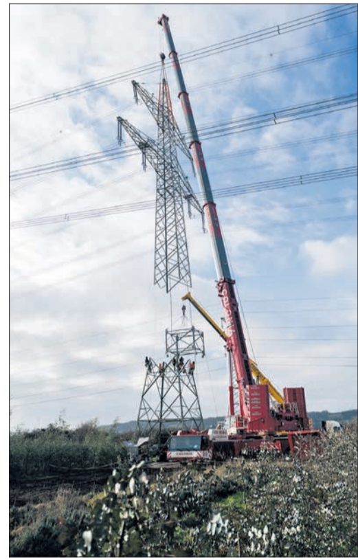
Amprion zeigt, wie die Masten erhöht werden.

Damit nicht genug, so der Verein, planen jetzt Amprion und BNetzA, die neuen Gleichstrom-Systeme der Erdkabel-Trasse Rhein-Main Link genau in die von den Kommunen vorgeschlagenen, alternativen Verschwenkungskorridore für Ultramet zu legen. EZ