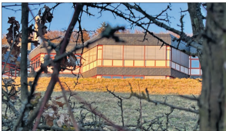
Blick durch die Hecke zum Gebäude der ehemaligen Sparkassenakademie am Sonnenhang von Vockenhäuser.

Auch Stöckel betont die Bedeutung einer aktiven Rolle der Stadt: „Die Sparkassenakademie darf nicht isoliert betrachtet werden. Sie ist Teil