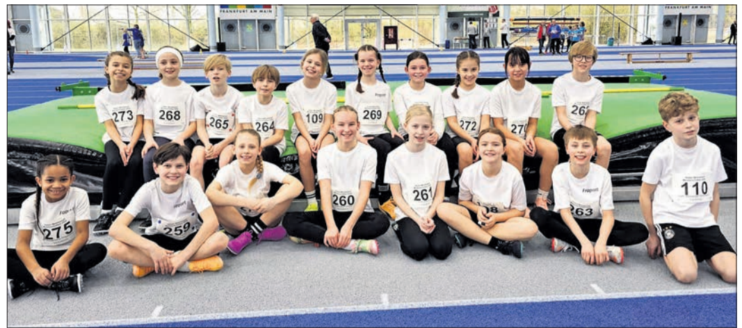
Die erfolgreichen Jugendlichen der Leichtathletikabteilung der SG Kelkheim.