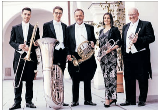
Harmonic Brass treten am 25. April in der Talkirche auf.