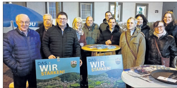
Beim Bürgertreff in Ehlhalten stellten sich die Kandidaten und Kandidatinnen der CDU für die Kommunalwahlen vor.

Andere Fragen drehten sich um das komplizierte Wahlverfahren der Kommunalwahl, dem Kumulieren und Panaschieren. Auf den jeweiligen Stimmzetteln ist oben immer die Anzahl