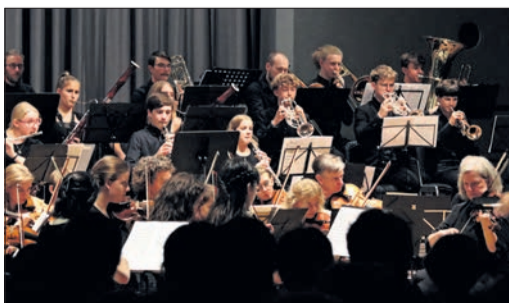
Archivbild des Jugendsinfonieorchesters

Das Angebot richtet sich an fortgeschrittene junge Instrumentalisten aus dem Main-Taunus-Kreis und der Region. Für Streicher und Bläser ist am 18. April ein Probespiel in der Main-Taunus-Schule Hofheim vorgesehen. Anmeldeschluss für neue Teilnehmer ist der 15. April; die Teilnahmegebühr beträgt 250 Euro. Der Anmeldeflyer mit näheren Informationen liegt im Kreisgebiet aus kann auf der Internetseite www.mtk.org heruntergeladen werden.