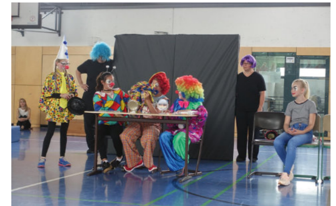
Vorführung eines Sketches

Den Höhepunkt bildete jedoch die erste Projektwoche mit Abschlussfest in der letzten Schulwoche vor den Sommerferien. Bereits im Herbst 2016 starteten die Vorbereitungen unter Federführung einer Arbeitsgruppe. Im Frühjahr wurden die