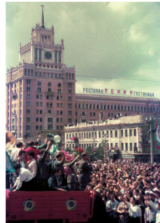
Der Umzug vor dem Restaurant „Peking“

Die folgenden zwei Wochen waren außerordentlich interessant. Kulturveranstaltungen der verschiedenen sozialistischen Teilnehmerstaaten, Industrieausstellungen, Tanzveranstaltungen, Besuch des Klosters Sagorsk, Kinobesuche, Besuch der Lomonossow-Universität, Kreml-Besichtigung etc. Interessant war für mich unter vielem anderen, dass es in Moskau dieser Zeit möglich war, eine katholische Messe zu besuchen.