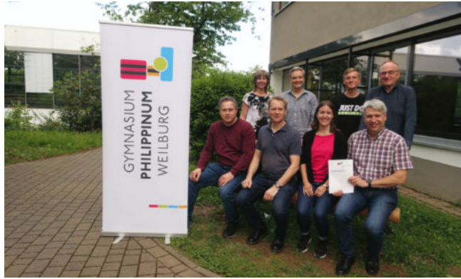
Die AG präsentiert das neue Schulprogramm

bild von der Schulkonferenz angenommen. Die Kernsätze wurden im Atrium an der Fensterfläche veröffentlicht. Die Implementierung des Leitbildes im Schulalltag bleibt ein ständiger Prozess.