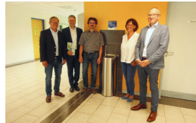
Die Einweihung des Trinkbrunnens in der Pausenhalle

Im Jahr 2018 installierte das Gymnasium Philippinum als erste Schule der Stadt einen Trinkbrunnen. Seitdem können alle Schülerinnen und Schüler während der Pausen kostenlos Wasser trinken, um die empfohlene Flüssigkeitsmenge zu erreichen. Die Idee entstand aus dem Wunsch der Eltern nach einer besseren Wasserversorgung für ihre Kinder im Ganztagsunterricht. Nach Rücksprache mit der Schülerschaft und Unterstützung durch Eltern, Schulleitung, Schulträger, Schülervertretung, der Stadtwerke Weilburg und örtliche Unternehmen wurde das Projekt realisiert.