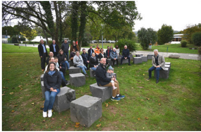
Die Einweihung der Außenklassenzimmer

lava-Blöcke verwendet, wobei die Lieferung und Umsetzung durch lokale Unternehmen ermöglicht wurden. Die Wilinaburgia finanzierte außerdem den Fallschutz für die Reckstangen, die jetzt das Pausenangebot erweitern. Insgesamt bieten die Grünen Klassenzimmer neue Sitzmöglichkeiten und Räume für Unterricht im Freien und gemeinsame Aktivitäten.