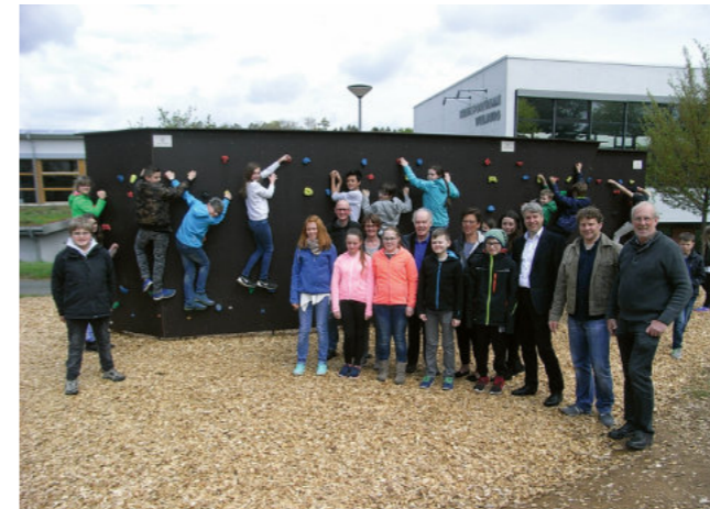
Die Einweihung der Boulderwand

tet. Die Wand misst neun Meter in der Länge und 2,5 Meter in der Höhe. Sie wird in den Pausen und im normalen Sportunterricht genutzt.