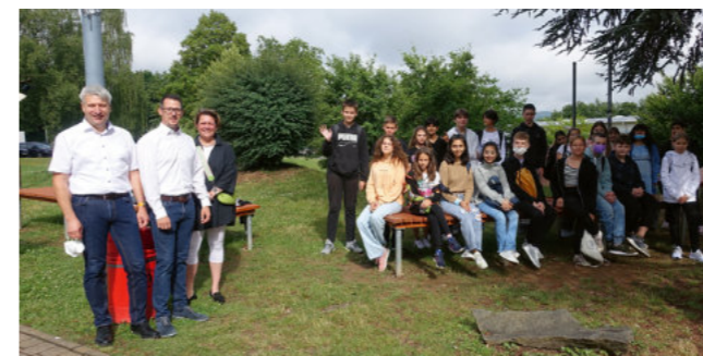
Die Übergabe der Mega-Sitzbänke durch den Gymnasialschulverein

Im Mai 2022 wurden drei neue „Megasitzbänke“ auf dem Schulgelände nahe dem Haupteingang aufgestellt. Sie bieten zusätzliche Sitzplätze und können für den Unterricht im Freien genutzt werden. Die Installation erfolgte durch ein Team aus