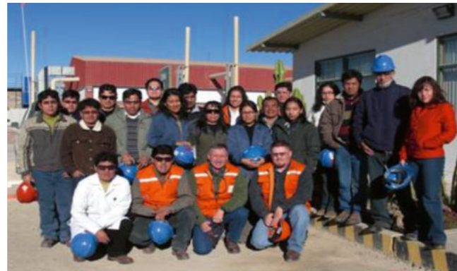
Der Autor (vordere Reihe zweiter von rechts) mit seinem Team 2008 auf einer Kupfermine in Peru

Klartext: Die Aufklärung der Schüler und Motivation für Rohstoff-Berufe wird für Deutschland eine Frage zur Sicherung der Zukunft. In meinem 42 Jahren im Auslandsbergbau habe