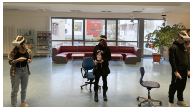
VR-Exkursion des Geographie Grundkurs zum Tagebau Garzweiler

Außerdem wurde ein vierter Informatikraum, ein „Maker Space“, mit 3D-Druckern, LEGO-Robotik-Materialien und VR-