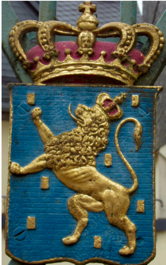
Das Nassauer Wappen im Weilburger Schlosspark

er u.a.: „... Die Landesverfassung, die nassauischen Hausgesetze und die europäischen Verträge berufen Mich auf den Thron des Großherzogtums. Ich bin Mir der schweren Pflichten bewusst, welche mit der Krone auf Mich übergegangen sind. ... Wir sind alle tief durchdrungen von dem Ernste des Augenblicks, wo sich die Verbindung des schönen Luxemburger Landes mit dem Hause, dem Ich vorstehe, sich vollzieht. Gott wolle diesen Bund segnen mit Festigkeit und Gedeihen.“