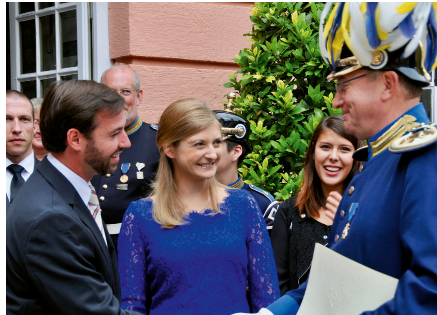
Antrittsbesuch des Großherzogs Guillaume und seiner Gattin in Weilburg

Der Vertrag wurde 1786 von Kaiser Joseph II. bestätigt. Die internationalen Abkommen von 1815 und 1867 bestätigten ebenfalls diesen Erbvertrag des Hauses Nassau. Demnach ging also das Zepter des Großherzogtums an den nächsten erbberechtigten Agnaten innerhalb des Gesamthauses Nassau über. Dies war der 73jährige Herzog Adolph von Nassau-Weilburg. Formal bestieg er am 9. Dezember 1890 den Luxemburger Thron. In seiner Rede vor der Kammer sagte