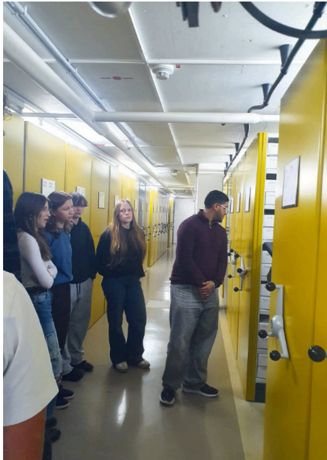
Vor Weilburger Archivalien in den Katakomben des Landesarchivs