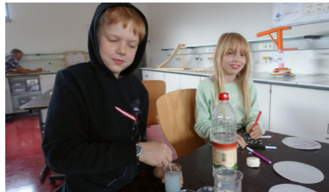
Schülerinnen und Schüler im Forscherraum

Ein Jahr vorher, im Jahr 2017 wurde der Forscherraum im Naturwissenschaftengebäude eröffnet und steht seitdem für Experimente mit Mechanik, Elektrizität und Optik bereit. Der Forscherraum soll handwerkliches Arbeiten fördern und ergänzt den MINT-Bereich der Schule, insbesondere für die „NawiKids AG“ (Klassen 5 und 6) sowie den Wahlpflichtunterricht in den höheren Klassen. Die Umsetzung wurde unterstützt durch den Verein Deutscher Ingenieure sowie durch finanzielle Förderung der Wilinaburgia mit 3000 Euro für die Inneneinrichtung.