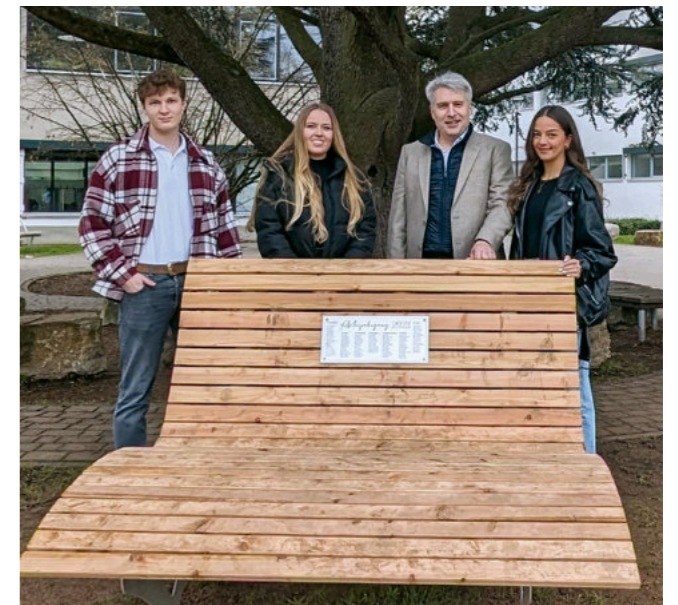
Übergabe der Panoramabank durch Vertreterinnen und Vertreter des Abi-Jahrgangs 2023

Die Idee zu den Klassenzimmern entstand während der Corona-Zeit und wurde nach intensiver Planung und Spendensammlung realisiert. Für den Bau wurden regionale Basalt-