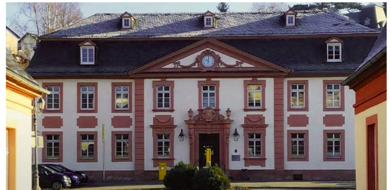
. . . 34 Jahre später Geschichte: Das Weilburger Postgebäude von 1786

Um der Landbevölkerung die Benutzung des Telegraphen im Postamt zu erleichtern, wurden die Landbriefträger ab dem 1. November 1876 ermächtigt, auf ihren Botengängen Telegramme zur Beförderung entgegenzunehmen. Um den ständig weitergehenden Wünschen des Publikums Rechnung zu tragen, wurde am 9. Februar 1880 im Telegraphenamt der volle Tagesdienst eingeführt. Ab dem 5. August 1890 wurde dann sogar ein zweiter Telegraphenapparat in Betrieb genommen. Mit der rasanten Entwicklung des Telefons wurden immer weniger Telegramme aufgegeben. Daher stellte die Deutsche Post am Beginn des Jahres 2023 ihren Telegrammdienst ein. Der Entwicklung geschuldet nahm die Post im Oktober 1972 in der Limburger Straße in Weilburg ein neues Fernmeldegebäude in Betrieb.