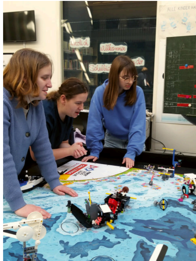
Schülerinnen der LEGO-Robotik AG

Für Schülerinnen und Schüler ohne eigene digitale Endgeräte stellte der Schulträger iPads zur Ausleihe zur Verfügung. Diese wurden nach der Pandemie wieder eingezogen und ste-