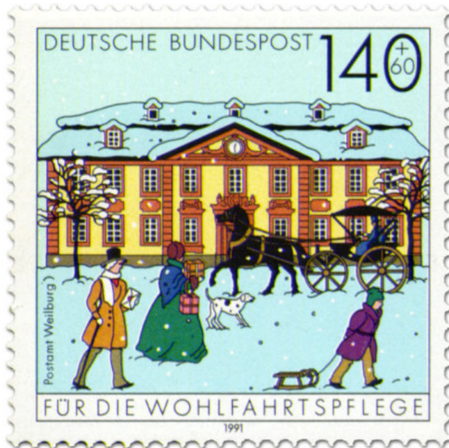
1991 als Briefmarke . . .

Nach fast 160 Jahren ist das Weilburger Postamt Geschichte – Von Heinz-Ulrich Mengel (1945)