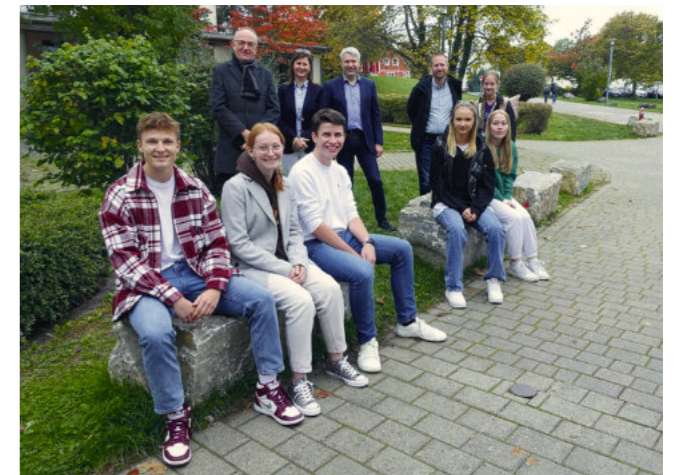
Die Schülervertretung testet die neuen Sitzsteine

Eltern, Schülern und Lehrkräften mit finanzieller Unterstützung des Gymnasialschulvereins.