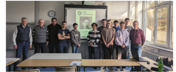
Einweihung einer Gedenktafel in der Niedergasse

Ein besonderes Projekt „Jüdisches Leben in Weilburg“ möchte ich noch gesondert erwähnen. Seit mehreren Jahren hat unsere Schule die Pflege des an das Schulgelände grenzenden Jüdischen Friedhofs übernommen. Federführend sind