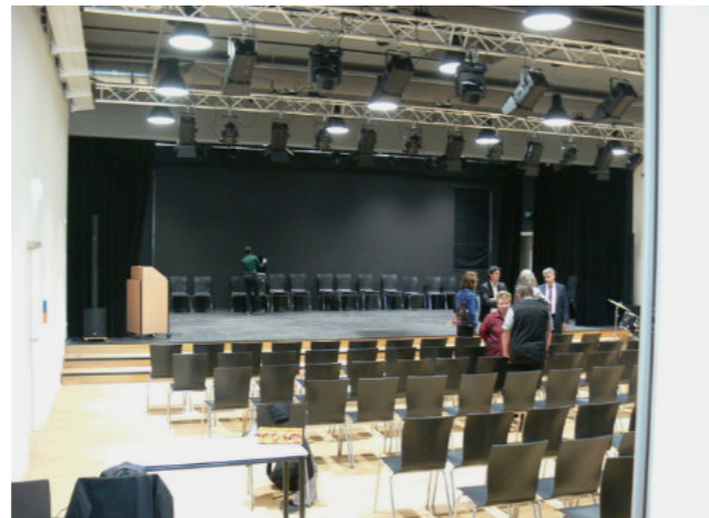
Blick in den Musiksaal mit Bühne

voller Teil des Schullebens ist und einen hohen Beitrag zur Identifikation mit der Schule leistet.