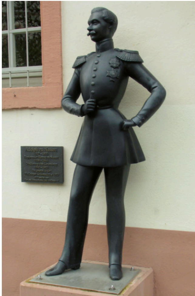
Denkmal Herzog Adolphs vor dem Bergbau- und Heimatmuseum

zogtum in niederländischer Hand und auch weiterhin Mitglied des Deutschen Bundes. Am 7. Oktober 1839 dankte Wilhelm I. zugunsten seines ältesten Sohnes Wilhelm II. ab. Diese Abdankung wurde als ein positives Ereignis angesehen. Wilhelm II. musste nach langwierigen Verhandlungen 1842 dem Eintritt Luxemburgs in den deutschen Zollverein zustimmen. Damit war das Herzogtum in doppelter Hinsicht an Preußen gebunden.