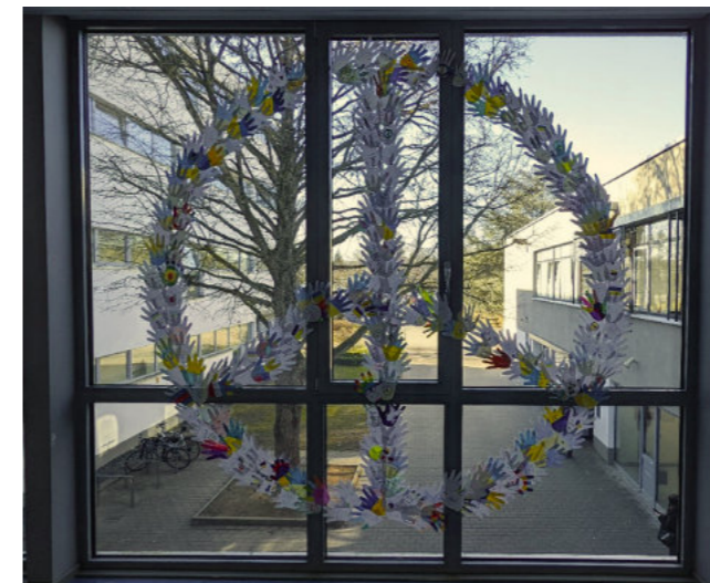
Peace-Zeichen an den Fenstern im Übergang MLZ

Dieser Beitrag gibt einen Einblick in die – aus meiner Sicht – wesentlichen schulischen Entwicklungen seit 2015. Es ist jedoch nur ein Einblick in einzelne Bereiche – punktuell und ex-