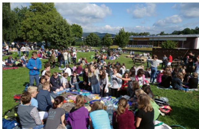
Schülerinnen und Schüler beim ersten Schulpicknick

Begleitet wurde diese Phase von der neu gegründeten „Koordinierungsgruppe“, deren Aufgabe es war, die Ergebnis-