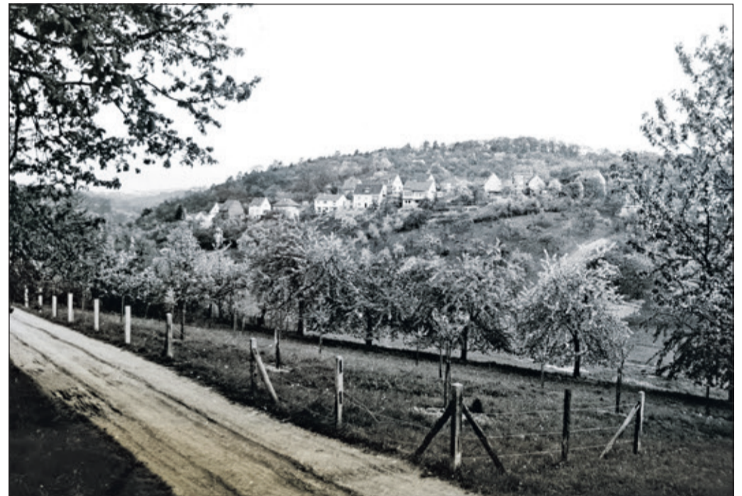
Ein Platz, an dem heute – aufgrund von Naturschutzauflagen – wahrscheinlich kein Kind mehr unbedarft spielen dürfte.