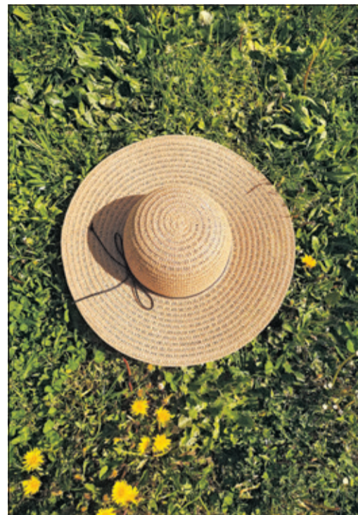
Wichtig: viel trinken und sich vor der Sonne schützen.