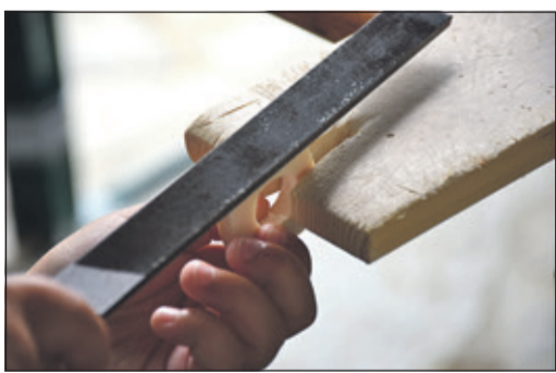
Handwerkstechniken der Römer im Römerkastell Saalburg kennenlernen, zum Beispiel das Beinschnitzen. So bezeichnet man das kunsthandwerkliche Bearbeiten von tierischen Knochen („Bein“ in alter Sprache). Dazu ist am kommenden Sonntag im Rahmen der „Sonntagsrömer“-Veranstaltung Gelegenheit.

Taunus (bs) – Das Römerkastell Saalburg lädt auch dieses Jahr wieder zu den „Sonntagsrömern“ ein, einem besonderen Tag voller Mitmachaktionen und Einblicke in das römische Alltagsleben. Am Sonntag, 28. Juni, haben Besucherinnen und Besucher die Gelegenheit, alte Handarbeitstechniken kennenzulernen und selbst auszuprobieren. Von 11 bis 17 Uhr können sich alle Interessierten im Nadelbinden versuchen, eine alte Handarbeitstechnik, die