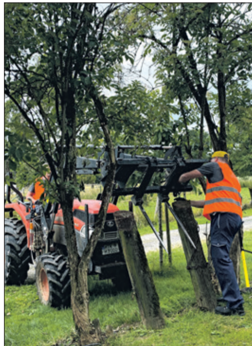
Zaunbau als Herausforderung: Zunächst mussten die alten Pfähle entfernt werden. Sie erwiesen sich als widerstandsfähig – es gelang schließlich mit Manpower und Traktor.

Während sich die Streifarbeiten am Stall als recht praktikabel und mit Leitern und Verlängerungsstilen als gut durchführbar erwiesen, war der Zaunbau eine echte Herausforderung. Nachdem der alte Holzzaun relativ schnell abgebaut war, stellte sich das Entfernen der alten Pfosten als schwierig dar. Da die Pfähle bis zu