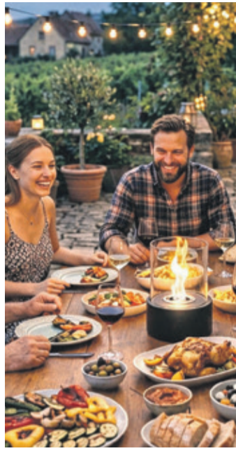
Gemütlichkeit im Schein der Flammen.

(DJD). Ob beim romantischen Dinner zu zweit oder in geselliger Runde: Tischfeuer sorgen an Sommerabenden für eine stimmungsvolle Atmosphäre. Allerdings sind nicht alle Modelle gleich sicher. So stehen Geräte mit Ethanol in der Kritik, da bei der Verbrennung gesundheitsschädliche Partikel entstehen können. Zudem besteht beim Nachfüllen die Gefahr von Verpuffungen oder Stichflammen. Als risikoarme Alternative gelten Tischfeuer mit speziellen Sicherheitsbrennstoffen, etwa von Feuerklar. Hochwertige Tischfeuerlösungen sind so konzipiert, dass die Flamme bei einem versehentlichen Umstoßen von selbst erlischt. Unter www.feuerklar.de gibt es dazu weitere Informationen, Erklärvideos und Modelle zum Auswählen.