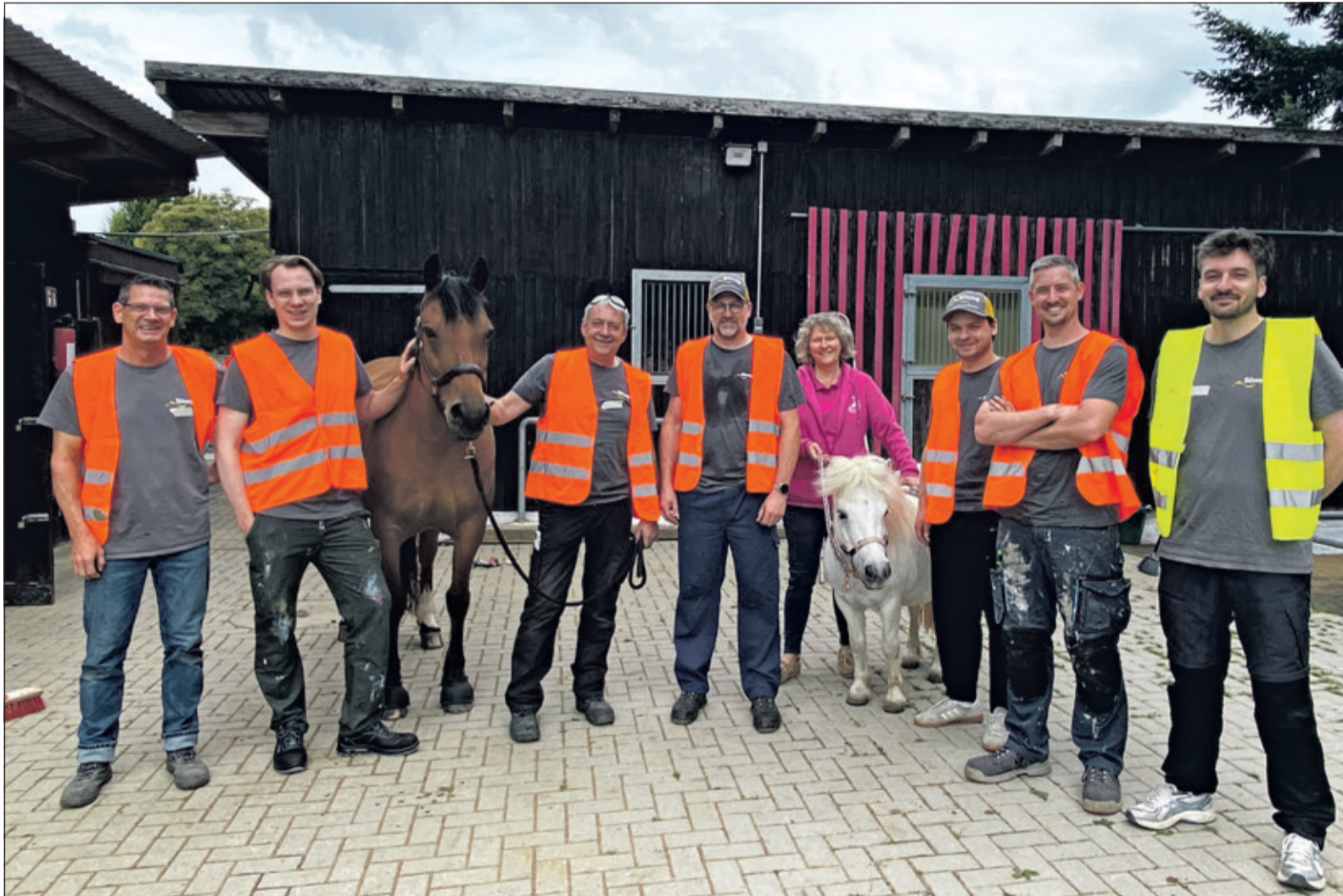
Das Team der Süwag verbrachte seinen Einsatz am „Social Day“ des Energiedienstleisters im Reittherapiezentrum Spatzenscheune in Bad Soden-Altenhain. Hier wurden nicht nur die Stallwände neu gestrichen, sondern auch der Zaun am Eingang erneuert.

Altenhain (bs/Sc) – Arbeitsschuhe, Gartenhandschuhe und Werkzeug – wenn beim regionalen Energiedienstleister Süwag Energie AG dieses Equipment eingepackt wird, dann steht der Social Day vor der Tür. Im Rahmen der jährlichen Aktion engagieren sich Mitarbeiterinnen und Mitarbeiter tatkräftig für soziale, kulturelle, nachhaltige, ökologische und sportliche Einrichtungen im gesamten Süwag-Gebiet. Der Fokus liegt dabei auf Regionalität und so ging es in diesem Jahr auch in den Main-Taunus-Kreis – auch das Reittherapiezentrum „Spatzenscheune“ in Bad Soden-Altenhain konnte sich über tatkräftige Unterstützung beim Zaunbau und bei dringend notwendigen Malerarbeiten freuen.