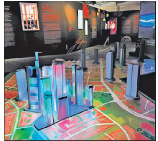
Der „Skyline-Table“: Frankfurt selbst gestalten.

Um das immersive Stadterlebnis als Familienaktivität möglichst erschwinglich zu machen, senkt „Frankfurt: City of WOW!“ alle Ticketpreise speziell für den Zeitraum der hessischen Sommerferien. Mit diesem stärker-