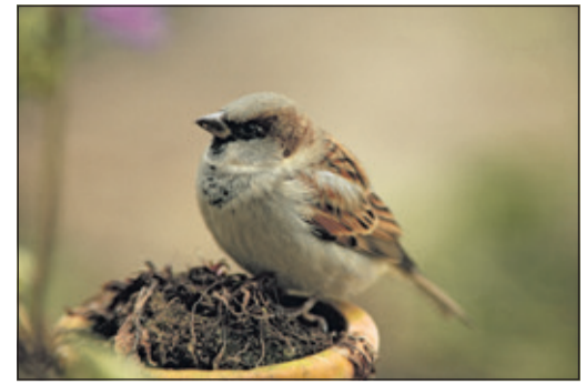
Der Haussperling wird immer seltener in den Gärten.