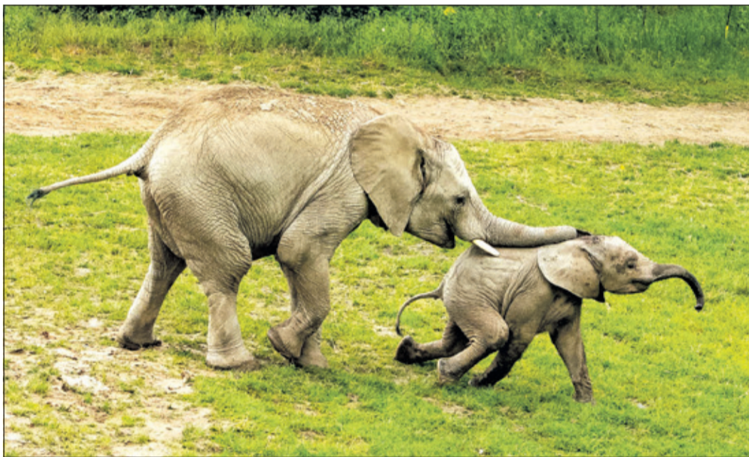
Jung-Elefanten im Opel-Zoo: Im Rahmen des Opel-Zoo-Programms in den Sommerferien gibt es am Dienstag, 30. Juni, um 11 Uhr eine Ferienführung zum Thema „Elefanten – die grauen Riesen“.