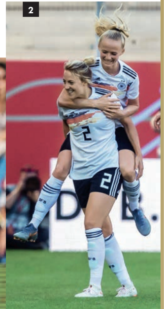
1-2_ Großer Einsatz, gute Laune: Carolin Simon im Nationaltrikot: im WM-Spiel gegen Südafrika und beim gemeinsamen Jubel mit Lea Schüller.

danach abschalten, das tat richtig gut. Und ich glaube, dass uns die WM und die Lehren, die wir aus ihr ziehen, auf lange Sicht wieder einen Schritt nach vorne bringen werden.“