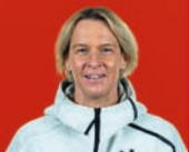
Trainerin Martina Voss- Tecklenburg

* Aus datenschutzrechtlichen Gründen dürfen wir das Geburtsdatum nicht abdrucken.