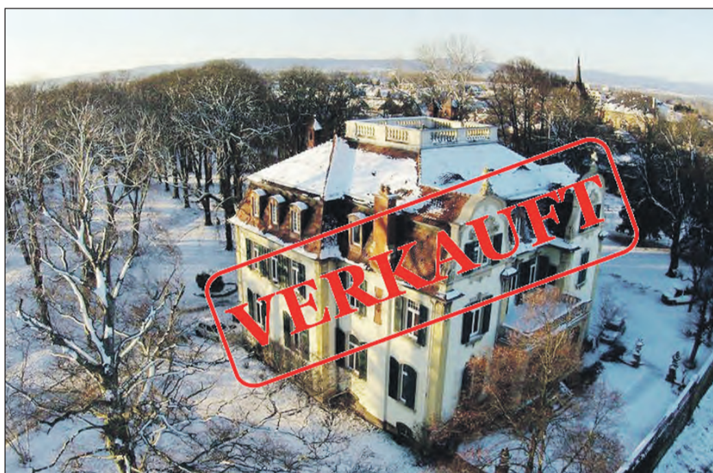
Die Villa Meister wurde im Sommer 2019 mitsamt dem umliegenden Park verkauft. Eine Immobilienfirma will dort Wohnungen bauen.