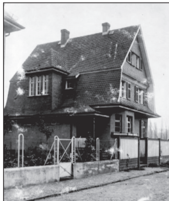
Eins der Häuser der ehemaligen Villenkolonie.