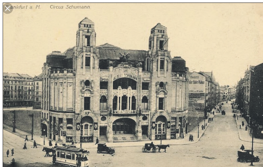
Das Albert-Schumann-Theater lag früher schräg gegenüber dem Hauptbahnhof. Es wurde im Zweiten Weltkrieg beschädigt und später abgerissen.

Weiter beschrieb Björn Wissenbach mit historischen Fotografien die Zeil, die mit Bäumen bepflanzt und vor der Fertigstellung des „Centralbahnhofs“ Dreh- und Angelpunkt vieler Reisender war. An der Hauptpost kamen sie an und fuhren in die Ferne. Deshalb waren hier auf der Zeil die schönsten Hotels zu finden. Dies änderte sich mit der Inbetriebnahme des neuen Hauptbahnhofs. Die Hotels zogen in dessen Nähe und auf der Zeil baute man Kaufhäuser. Die Besucher nutzten die Gelegenheit, eigene Erinnerungen beizusteuern und Fragen zu stellen. So endete der gelungene Abend beim Plausch bei Brezeln und Apfelwein. hjs