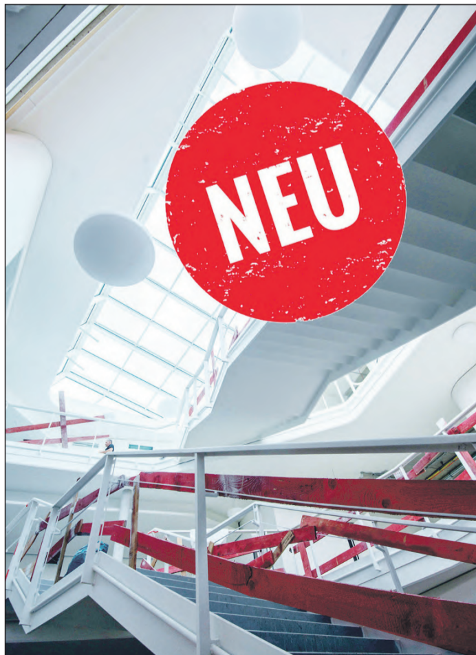
Die letzten Gerüste sind weg: Der Neubau der Ludwig-Weber-Schule ist fertig und wird nun bezogen.