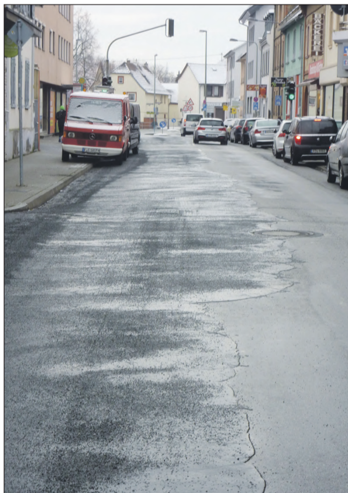
Gut geschüttelt werden Radler und Autofahrer auf der Sindlinger Bahnstraße.