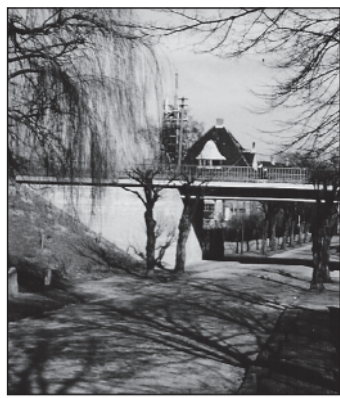
Jenseits des Pfingstborngrabens lag die Villenkolonie.