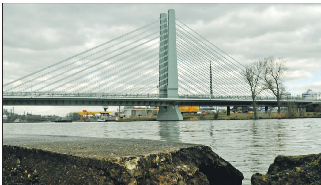
Die Betonsokkel sollen verschwinden und das Sindlinger Mainufer naturnah gestaltet werden - wann auch immer.

im Stadtteil, über Aktivitäten in den Vereinen und Institutionen und über das, was die Sindlinger im Laufe eines Jahres bewegt. Auch die Lokalpolitik ist Teil dieser Berichterstattung. Einen kurzen Rückblick hat Ortsbeirat Albrecht Fribolin zusammengestellt.