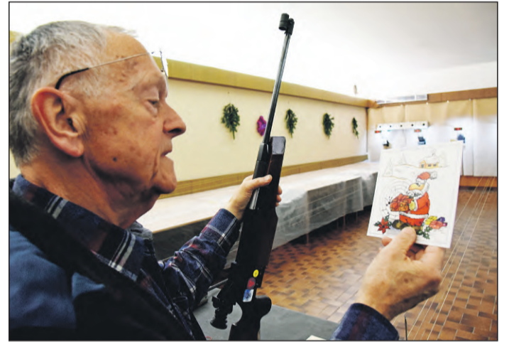
So sieht die Zielkarte fürs Nikolausschießen aus.