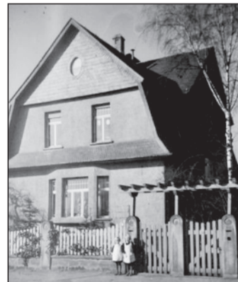
Haus der Familie Sieglitz in der Farbenstraße 16.