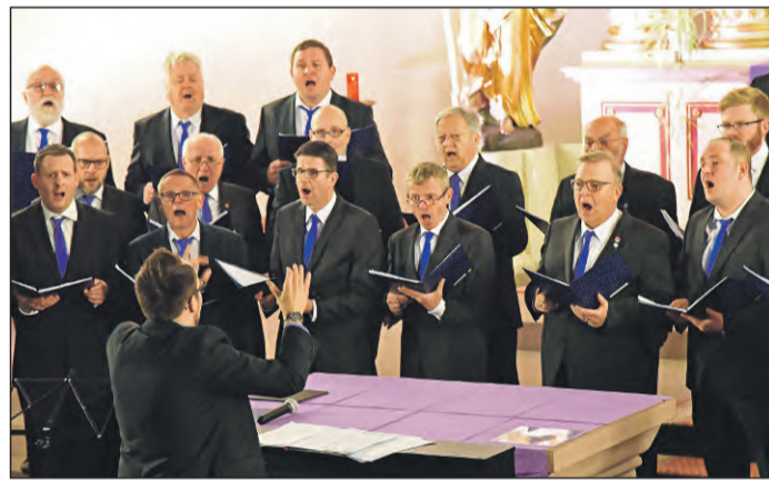
Der Männerchor Germania bestritt den ersten Teil des Konzerts.