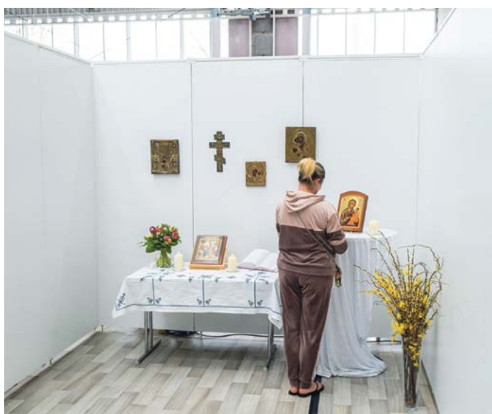
Provisorische Kapelle in der Flüchtlingsunterkunft Kalbach.