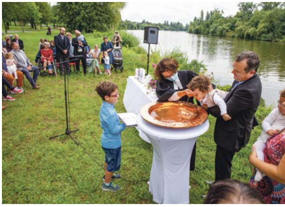
Taufen am Main sind sehr beliebt. Am 9. Juli findet ein großes Tauffest in Offenbach-Bürgel statt.