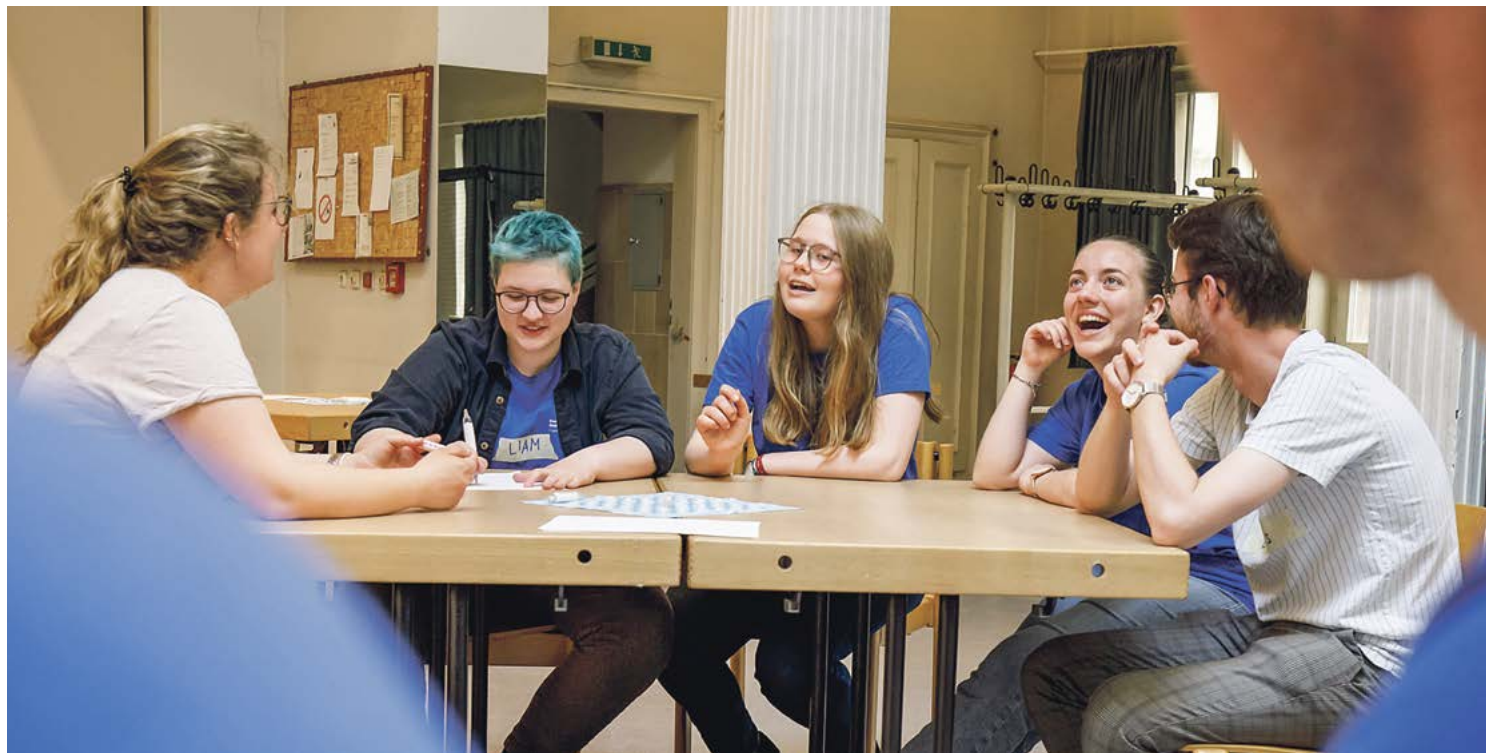
Jugendliche organisieren ihre eigenen Events: Hier beim „Eden-Abend“ mit Games und Quiz im Mai in der Gethsemanekirche.

Noch mehr als andere Institutionen muss sich die Kirche deshalb anstrengen, damit Jugendliche sich hier einbringen können.