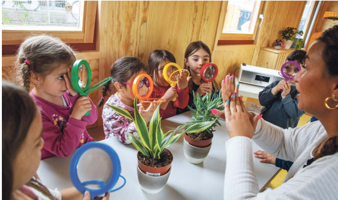
Spielerisch Eintauchen in die Welt der Wissenschaft: Der neue Kita-Bauwagen regt die Neugier an.

„Der Bauwagen ist kein steriles naturwissenschaftliches Labor, sondern ein Ort, an dem die Kinder unterschiedliche Welten kennenlernen“, sagt Kita-Leiterin