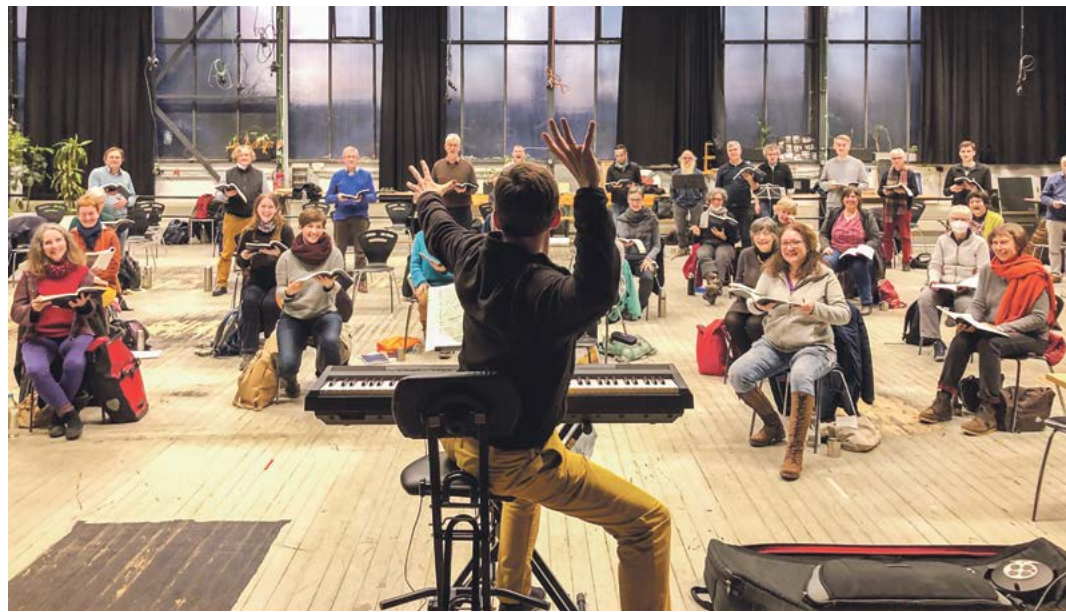
Der Projektchor Junge Kantorei bei den Proben für das aktuelle Pfingstkonzert.