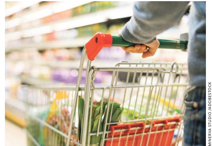
Vor allem Lebensmittel und andere Dinge des täglichen Bedarfs sind wegen Krieg und Embargo teurer geworden.

Expert:innen rechnen mit einer Teuerungsrate von mehr als fünf Prozent allein in diesem Jahr. Benzin, Strom, Heizkosten, aber auch Lebensmittel und viele andere Güter werden immer teurer. Das gilt besonders bei den Grundnahrungsmitteln, bei Brot, Mehl, Nudeln, Obst und Gemüse. Also ausgerechnet bei den Dingen, die gerade Familien mit Kindern