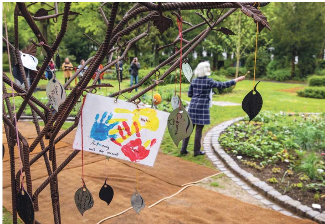
Auf dem Frankfurter Hauptfriedhof wurde ein zweites Grabfeld für „Sternenkinder“ eingeweiht.

Die Sonnenstrahlen erstrecken sich über das Mainufer und geben mir dieses herrlich prickelnde Gefühl auf der Haut. Eine ganze Menge Menschen tummeln sich hier und genießen das gute Wetter. So viele, wie ich während meines ersten Semesters eigentlich nie an einem Ort gesehen habe. Corona geschuldet. An Corona erinnert in diesem Frühling nichts mehr. Ich habe den Eindruck, dass die Menschen sich näher kommen als in den letzten zwei Jahren. Nicht nur physisch. Vor allem auf zwischenmenschlicher Ebene scheinen die Zeichen auf Zuneigung zu stehen. So kommt es, dass ich Zeugin einer besonderen Szene werde: Während ich so vor mich hin schlendere, sehe ich, wie einer Frau ein Geldschein aus der Tasche fällt. Ich zögere ganz kurz, überlege, ob ich ihr laut hinterherrufen soll. In diesem Moment meiner menschlichen Schwäche zeigt mir ein kleines, etwa fünf Jahre altes Mädchen, wie ich ohne zu zögern hätte handeln sollen: Sie läuft zu dem Geldschein, hebt ihn auf, läuft der Frau hinterher und hält ihr den Schein hin: „Du hast was verloren.“ Obwohl ihre Eltern sie zurückrufen. Obwohl sie die Frau nicht kennt. Das Mädchen hat das Richtige getan! Die Frau dankt es ihr mit einem ehrlichen Lächeln.