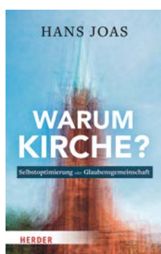
Hans Joas: Warum Kirche? Herder, 240 Seiten, 22 Euro

4 Du musst nicht dominieren. Es ist schön, sich einzubringen unter den vielen anderen, die in der Welt für Frieden und Verständigung tätig sind. Such dir bei ihnen Freunde und Freundinnen!