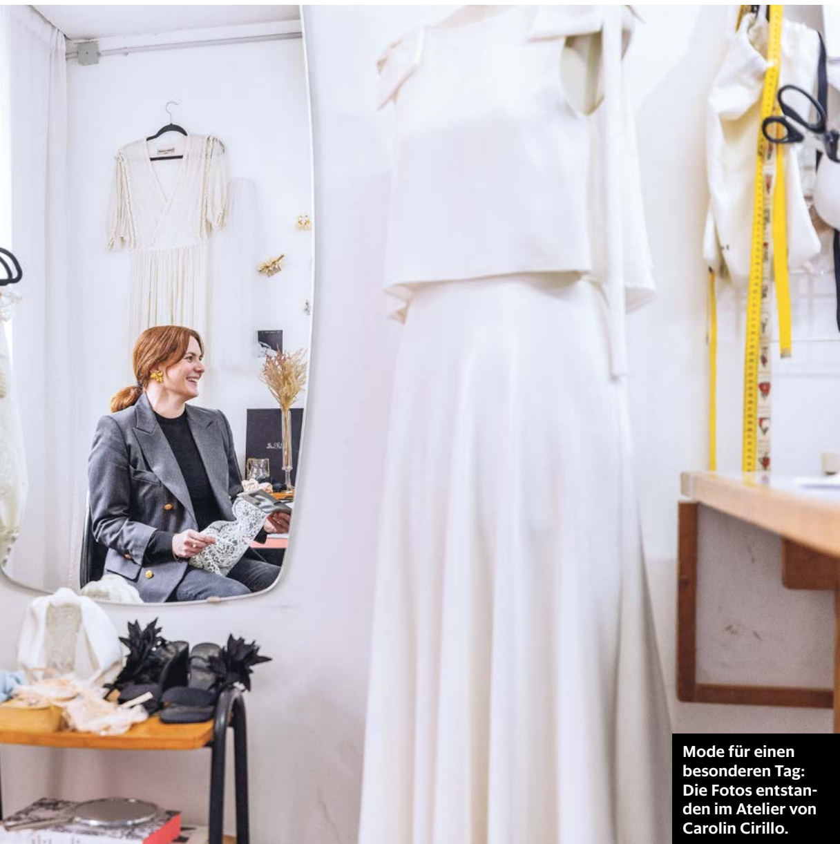
Mode für einen besonderen Tag: Die Fotos entstanden im Atelier von Carolin Cirillo.

Anzahl der Ehen, die 2021 in Deutschland geschlossen wurden.