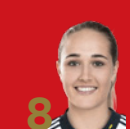
Sydney Lohmann Geb.: 19.06.2000 Bayern München Länderspiele: 11 Tore: 1