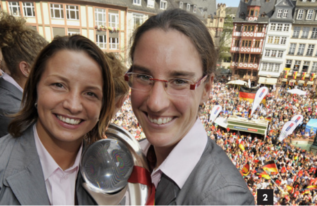
1_Der Schweizer Meister- und der Pokaltitel sind die ersten beiden Trophäen, die Inka Grings als Trainerin im Profifußball gewonnen hat. 2_Grings mit Birgit Prinz beim Empfang der Europameisterinnen 2009 auf dem Frankfurter Römer.