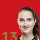
Sara Däbritz Geb.: 15.02.1995 Paris Saint-Germain Länderspiele: 85 Tore: 17