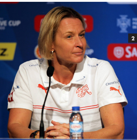
2_ Zwischen 2012 und 2018 war Voss-Tecklenburg Trainerin der Schweizer Nationalmannschaft.

Ich bereite mich schon darauf vor, denn das läuft bei jeder Spielerin individuell. Ich war selbst Spielerin, ich weiß, dass das eine Entscheidung von Tragweite ist. Jemandem sagen zu müssen, dass er nicht dabei ist, fällt mir immer noch nicht leicht, das nimmt mich auch immer mit, das wird mitunter auch emotional. Man muss sich das bewusst machen: Es sind Spielerinnen, die genauso hart, leidenschaftlich und intensiv wie alle anderen, die mit zur EM fahren werden, dafür gearbeitet und sich Hoffnungen gemacht haben, dabei zu sein, zum Teil über Jahre. Umso wichtiger ist, dass ich ehrlich bin und meine Entscheidung nachvollziehbar begründe.