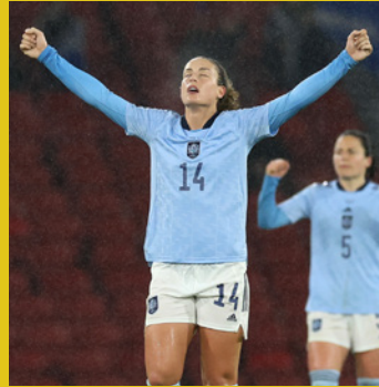
Alexia Putellas ist das Aushängeschild der starken spanischen Nationalmannschaft.

Der Kern der spanischen Nationalmannschaft besteht vor allem aus Spielerinnen des FC Barcelona und von Real Madrid. Eine sticht dabei aber besonders heraus: Alexia Putellas.