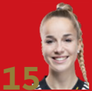
Giulia Gwinn Geb.: 02.07.1999 Bayern München Länderspiele: 26 Tore: 3