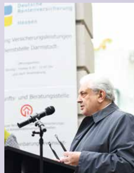
Sergej J. Netschajew, Botschafter der Russischen Föderation in Deutschland