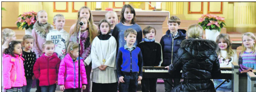
Der Kinderchor der katholischen Kindertagesstätten sang beim Abschiedsgottesdienst in St. Dionysius.