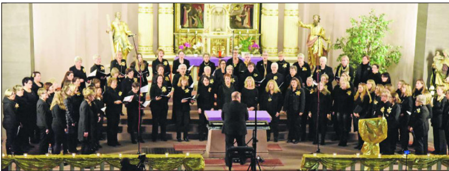
...der Frauenchor größer.

Als Meister des Spannungsbogens ließ Kuhn darauf das schöne, ergreifende und optimistische „Der Stern“ und das gefällige, harmonische „White Christmas“ folgen, um danach Chor und Publikum in Bewegung zu versetzen. Sein Arrangement von „Santa Claus is coming to town“ war purer Rhythmus, der niemanden unberührt ließ. Mit der „Cantique de Noel“ reiste der Chor zurück ins 19. Jahrhundert und beendete seinen Auftritt mit einem wunderschönen Weihnachtslied, in dem die Freude über die Ankunft des Heilands mitschwang. Danach hieß es zusammenrücken. Die knapp 50 Männer gesellten sich zu den gut 70 Sängern und luden das Publikum ein, „Oh du fröhliche“ mitzusingen. Stehender Applaus und viele anerkennende Worte beim abschließenden Glühwein oder anderen heißen Getränken vor der Kirche waren der Dank für ein Konzert, das Lust macht auf mehr. hn