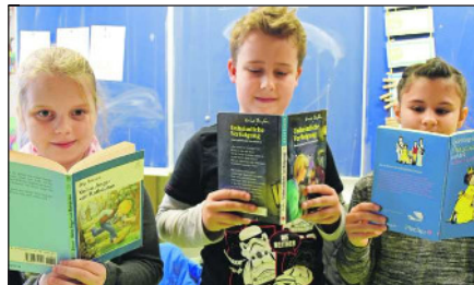
Zweit- und Drittklässler mit „Lesefutter“.

el einwählen“, erläutert Konrektor Martin Stojan die Organisation. Zu den Leszeiten 9.55 bis 10.40 und 10.40 bis 11.25 Uhr konnten sie zu den neun Angeboten je drei Wünsche äußern, so dass sie in einem ihrer Wünsche auf jeden Fall landeten. „Die Auswertung der Wunschzettel war zwar aufwendig, doch sicherte dies eine sinnvolle Einteilung sowie einen reibungslosen Ablauf am Lesetag selbst. Und es gab keine Enttäuschungen, da ja die Kinder sich selbst eingewählt haben“, sagt Stojan. Plakate an den Wänden wiesen auf den Lesetag hin, an den Türen der einzelnen Klassenräume, in denen gelesen wurde, waren die Namen der Zuhörer sowie ein Bild der Geschichte, so dass alle ihren Ort des Zuhörens fanden – unabhängig davon, wie gut sie selbst lesen können. Auch die Kinder der Eingangsstufen bekamen Geschichten zu hören. Sie wurden in Kleingruppen aufgeteilt, so dass ihnen das Zuhören leichter fiel. In der EI gab es Kamishibai (Erzähltheater) zu Aschen-