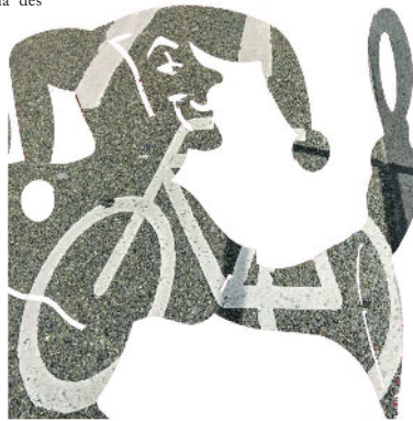
Ein Schelm, wer Schlimmes dabei denkt? Mitnichten.