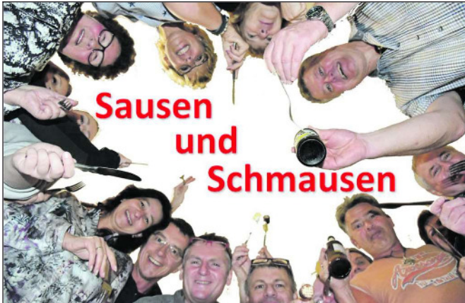
Prost Mahlzeit! Sindlinger hatten Spaß am Schlemmen und Rennen.

IN SAUS UND SCHMAUS Nach jedem Gang heißt es weiterziehen