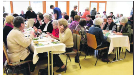
Mit Kaffee und Kuchen begann die Weihnachtsfeier für die TVS-Senioren im Mehrzweckraum der Sporthalle.