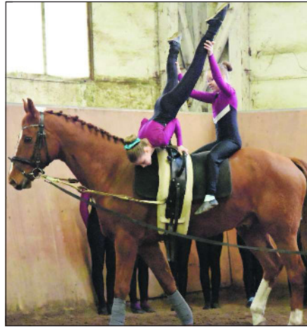
Voltigierkinder turnten auf Pferd Chris.

Am Ende der Darbietungen wurden Geschenke an die Kinder im Publikum überreicht und die jungen Gäste hatten die Möglichkeit, selbst Pony zu reiten. Beim geführten Ponysitzen kamen die Vierbeiner Julchen, Floppy, Wendu und Daisy zum Einsatz. „Ein rundum gelungenes Fest“, lobte eine Besucherin aus dem Frankfurter Nordend, die regelmäßig mit ihren Kindern zur jeden zweiten Sonntag stattfindenden Ponystunden in den Sindlinger Reitverein kommt.