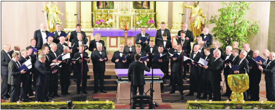
Der Männerchor Germania ist groß...