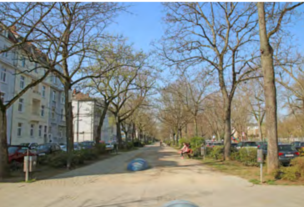
Einige Impressionen aus dem Gallus: rund um den baumbestandenen Grünzug inmitten der Frankenallee und von der Mainzer Landstraße (s. S. 9 unten)