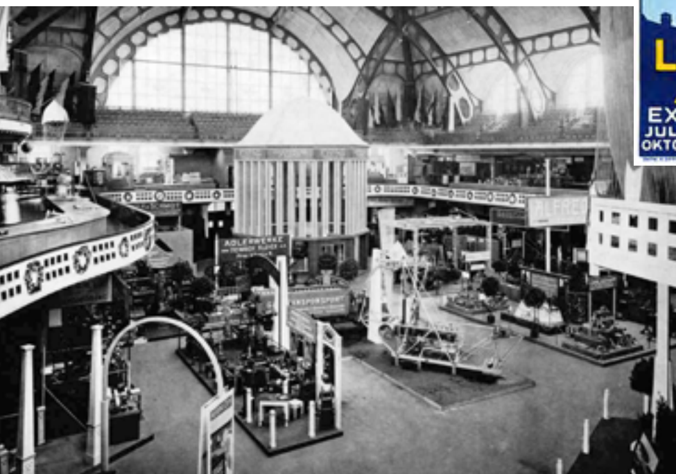
Das Deutsche Turnfest und die Internationale Luftfahrtausstellung 1909 waren die ersten Veranstaltungen in der neu eröffneten Festhalle.