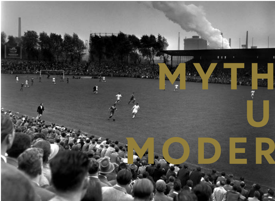
Heimspiel des FC Schalke 04 in der Glückauf-Kampfbahn, Gelsenkirchen, 1955.