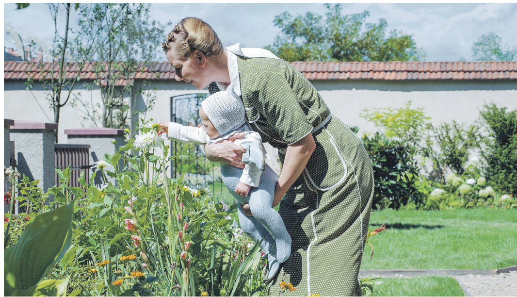
Sandra Hüller spielt Hedwig Höß, die Ehefrau des Auschwitz-Kommandanten Rudolf Höß.