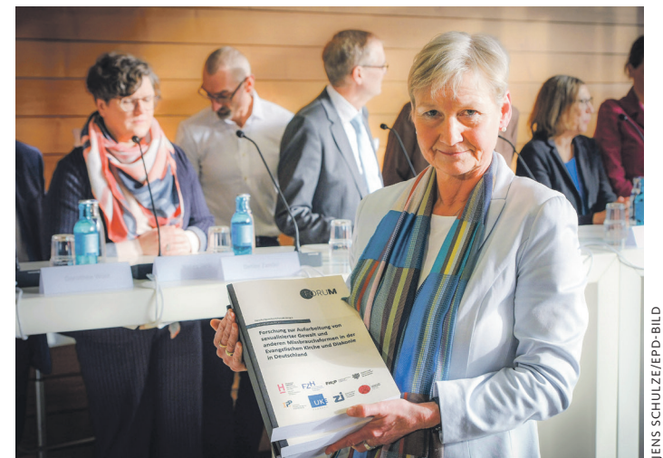
Kirsten Fehrs nahm als Ratsvorsitzende der Evangelischen Kirche in Deutschland die 800 Seiten dicke Studie entgegen.

Diese prägenden Erfahrungen aus der Jugendarbeit sind häufig die Gründe, weswegen die Kinder und Jugendlichen von einst später als Erwachsene auch ihre eigenen Kinder taufen lassen und sie dann ein paar Jahre später voller Vertrauen die Jugend- und Freizeitangebote in ihren Kirchengemeinden nutzen lassen. Und zwar völlig unabhängig davon, ob sie selbst sonntags in den Gottesdienst kommen oder nicht.