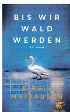
Birgit Mattausch: Bis wir Wald werden. Klett-Kotta 2023, 176 Seiten, 20 Euro.

6 Ein einziges Vorbild reicht nicht, weil niemand perfekt ist. Und so habe ich mehrere, die mich wie eine Schar guter Feen ermuntern, die richtige Richtung einzuschlagen.