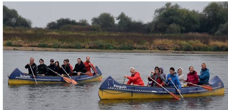
Teilnehmer der natursportlichen Kanu-Exkursion beim Deutschen Naturschutztag 2016.

(dosb umwelt) Mehr Kooperation zwischen Naturschutz und Sport in neuen Themenfeldern erweitern die Handlungsmöglichkeiten von Sportorganisationen und tragen zur notwendigen Verankerung des Naturschutzgedankens in der Gesellschaft bei. Dies ist nicht nur das Fazit des Deutschen Olympischen Sportbundes (DOSB) beim 33. Deutschen Naturschutztag, der im September 2016 in Magdeburg stattfand. Auch in Gesprächen am DOSB-Informationsstand und in den Arbeitskreisen war so häufig wie nie zuvor von einem stärkeren Miteinander die Rede und davon, dass der Naturschutz sein Kooperationspektrum ausweiten will. Entsprechend wurde der Sport als Kooperationspartner explizit in der Abschlusserklärung gewürdigt.