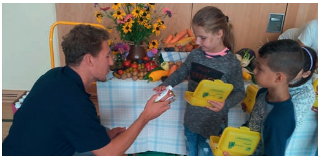
Biobrotboxen für eine gute Ernährung und Bewegung.

vergangenen 11 Jahren rund 80.000 Boxen gepackt und verteilt.