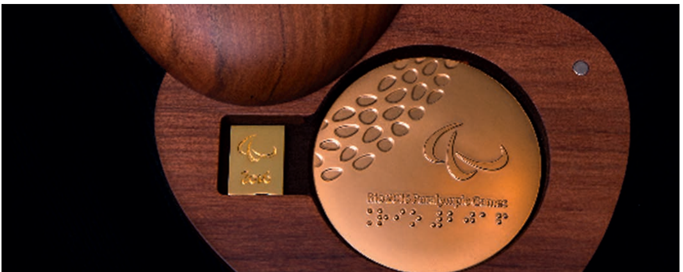
Schatulle der olympischen Medaille aus FSC®-zertifiziertem Holz.

(dosb umwelt) Mit dem Ziel, jedem Erstklässler in Frankfurt einen gesunden Start ins neue Schuljahr zu vermitteln, startete das Umweltforum Rhein-Main unter der Schirmherrschaft der Frankfurter Umweltdezernentin Rosemarie Heilig im September 2016 seine elfte Bio-Brotbox-Aktion. Der Deutsche Olympische Sportbund unterstützte die Aktion und war bei der Verteilung der Boxen für die rund 7500 Erstklässler an Frankfurter Grund- und Förderschulen mit dabei. Zuvor hatten rund 50 ehrenamtliche Helfer und Helferinnen aus Frankfurt und dem Kreis des Umweltforums die Bio-Brotboxen mit gesunden Nahrungsmitteln bestückt. Die Erstklässler hatten bereits mit der Post ein Plakat erhalten, das für eine gute Ernährung und Müllvermeidung warb. Insgesamt wurden in den