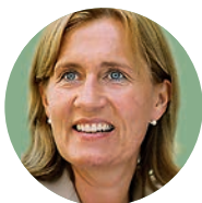
Gabriele Hermani Redaktion SPORT SCHÜTZT UMWELT

(dosb umwelt) Dass der Sport bei der „Woche der Umwelt“ dabei ist, hat mittlerweile schon Tradition. Der Deutsche Olympische Sportbund präsentiert dort gemeinsam mit anderen Ausstellern am 7. und 8. Juni 2016 im Park des Schlosses Bellevue innovative Ideen und Projekte zur Nachhaltigkeit – wie beispielsweise das Projekt „Sport bewegt – Biologische Vielfalt erleben“. Ein Besuch lohnt sich: Auf fast 4.000 Quadratmetern stellen rund 200 Aussteller aus Deutschland und der Schweiz neueste Entwicklungen im Klimaschutz sowie in den Bereichen Energie, Ressourcen, Boden und Biodiversität, Mobilität und Verkehr, Bauen und Wohnen vor. Außerdem wird es spannende Vorträge und Diskussionsangebote mit Politikern, Wirtschaftsvertretern und Wissenschaftlern geben.