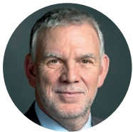
Jochen Flasbarth Staatssekretär im Bundesministerium für Umwelt, Naturschutz, Bau und Reaktorsicherheit

dosb umwelt: Deutschland will die Dekarbonisierung vorantreiben. Bis zum Jahr 2050 soll dieses Ziel erreicht sein, um eine weitere Erderwärmung zu verhindern. Die Erarbeitung des nationalen Klimaschutzplans 2050 baut auf einen breiten Dialog- und Beteiligungsprozess auf und soll der große Entwurf sein, mit dem die Zivilgesellschaft in diesen Prozess der Dekarbonisierung als handelnder und mitbestimmender Akteur einbezogen wird. Welche Rolle kann der Sport hier mit seinen 90.000 Sportvereinen und 27 Millionen Mitgliedern spielen?