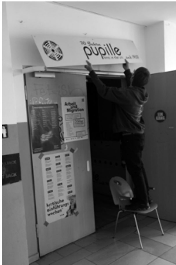
Camera Kino 1989; Pupille Nr 1; Pupille Schild