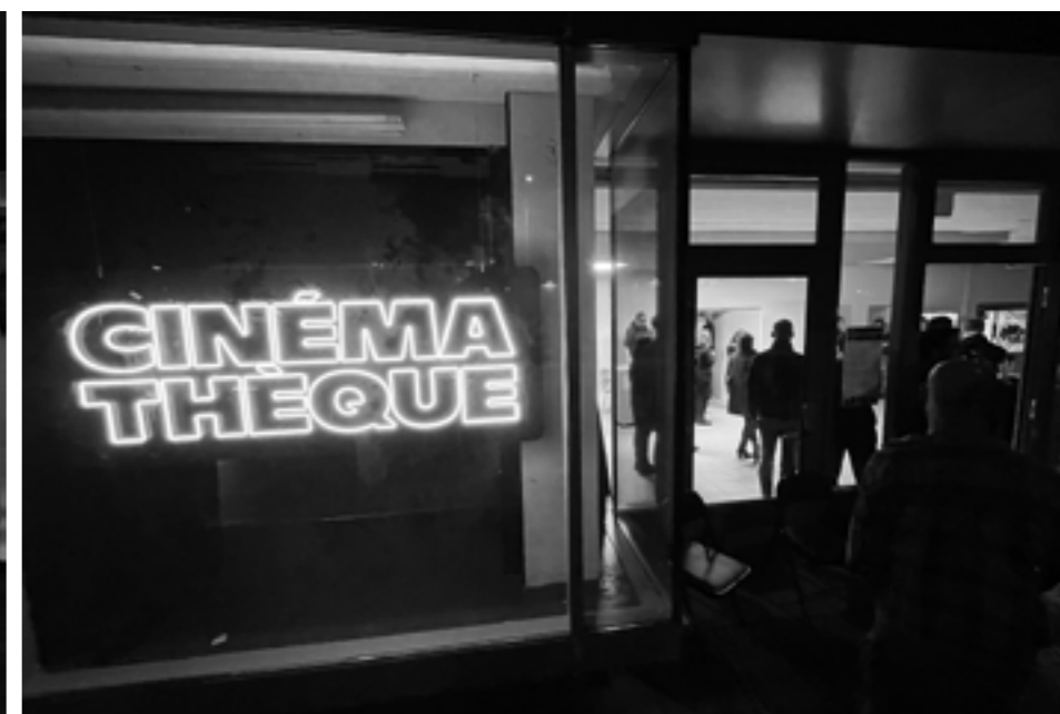
Eröffnung der Cinéma Théque Leipzig (s. KK 3/23)