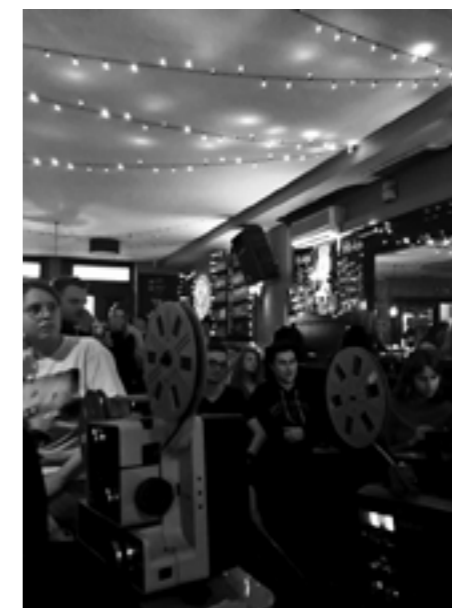
© Black Sheep Kneipe, Einzelveranstaltung 2022

Während sich andere Festivals vor allem mit der Konstruktion einer Community über inhaltlich progressive und fair produzierte Post-Pornografie auseinandersetzen, möchte PaderPorn den Blick schärfen für eine Vielfalt pornografischer Formen und damit eine Grundlage für Diskussionen und kreative Programmgestaltung liefern. So etablierte sich schon in der ersten Ausgabe 2022 ein Interesse an der engen Verbindung zwischen Pornografie und Experimentalfilm, die seither von verschiedenen Seiten aus weiterverfolgt wird: Kurzfilmprogramme von 16mm, ein von Karola Gramann kuratiertes Gastprogramm zwischen Lust und feministischer Pornokritik, die queeren Avant-Garde-Pornos von Fred Halsted, Wakefield Poole und Curt McDowell sind nur einige Beispiele. Gleichzeitig