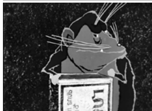
War: Happy End; Congregation Of Mice