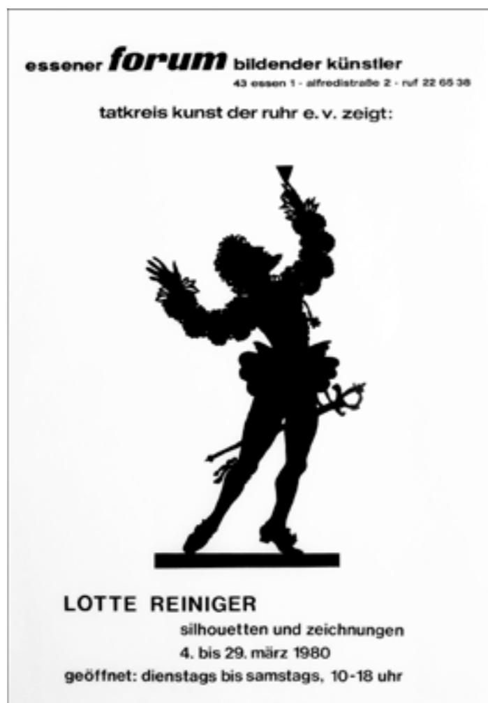
Plakatentwurf: © Werner Biedermann unter Verwendung eines Lotte-Reiniger-Scherenschnitts, 1980

So habe ich erfahren, dass sie als 16jähriges Mädchen anlässlich eines Vortrags des Theater- und Filmschauspielers, Filmregisseurs und Produzenten Paul Wegener im Jahr 1915 erstmals Kontakt zur Filmwelt bekam: Dieser erwähnte in einem Vortrag, den sie besucht hatte, Trickfilme und Filmtricks und die junge Lotte versuchte daraufhin alles, um Paul Wege-