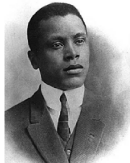
Oscar Micheaux ca. 1913

Film auf Film folgte, sie gehörte schnell zur Avantgarde des deutschen Stummfilms und ihr ungewöhnlicher Silhouetten-Filmstil wurde schnell über die deutschen Grenzen hinaus bekannt. 1926 lernte sie, anlässlich der Pariser