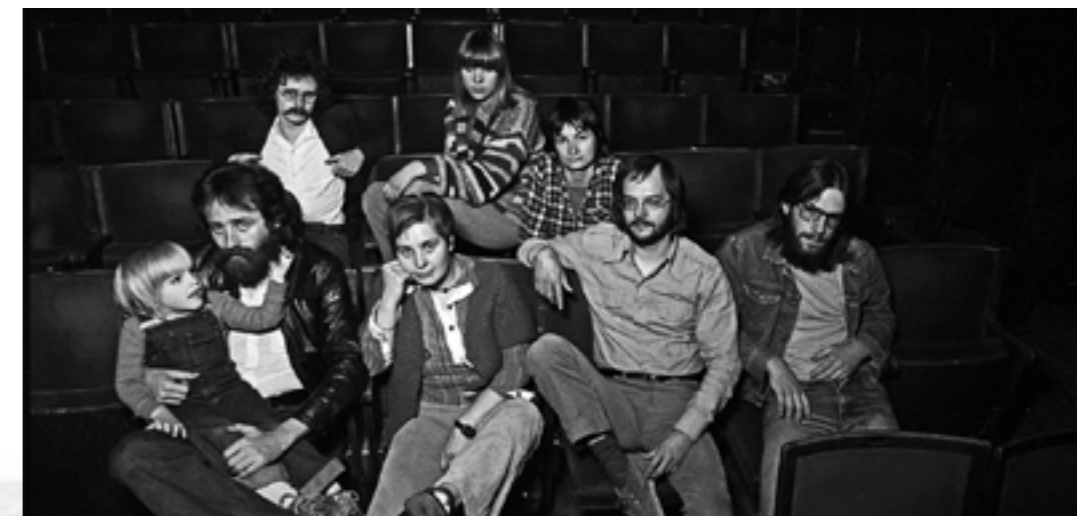
Das CQ-Team 1977

Diese Allegorie entstammt den Archivkammern des Cinema Quadrat in Mannheim. Sie entstand im Jahr 1971, also in der Frühphase der Gründung kommunaler Kinos. Das CQ wurde, wie das Kommunale Kino Frankfurt, selbst 1971 gegründet. Autor*innen und Anlass der Glosse lassen sich nicht mehr rekonstruieren, aber es steht die Frage im Raum, ob der Text, 52 Jahre später, vielleicht immer noch aktuell ist und vor allem, was das bedeuten würde?! Peter Bär hat die Geschichte der fünf Kinder im CQ-Archiv entdeckt und um Erläuterungen zu deren Mythologie ergänzt.