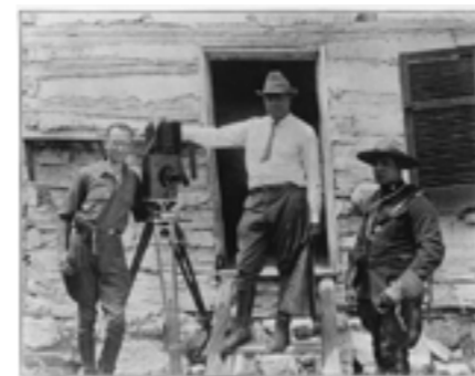
Oscar Micheaux (Mitte) mit einem Schauspieler und wahrscheinlich einem Crew Mitglied