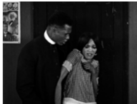
Body and Soul

Dabei ging er auch heikle Themen an, wie in THE EXILE , seinem ersten Tonfilm von 1931, bei dem es unter der Oberfläche eines auf die Faszination der Musik setzenden Revuefilms um gemischtrassige Liebesbeziehungen geht. Der Film spielt in Harlem, wo sich in den 1920er Jahren mit der Harlem Renaissance ein neues kulturelles Selbstbewusstsein in Theater,