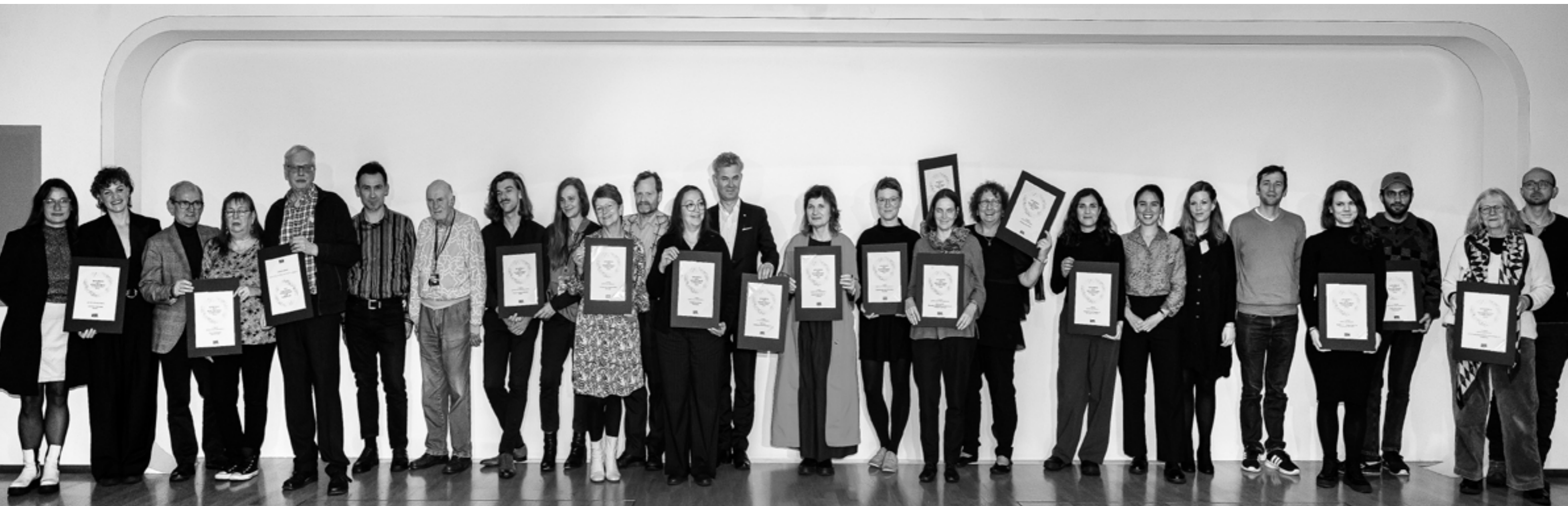
Alle Preisträger*innen

Kinopreis des Kinematheksverbund 2023 vergeben