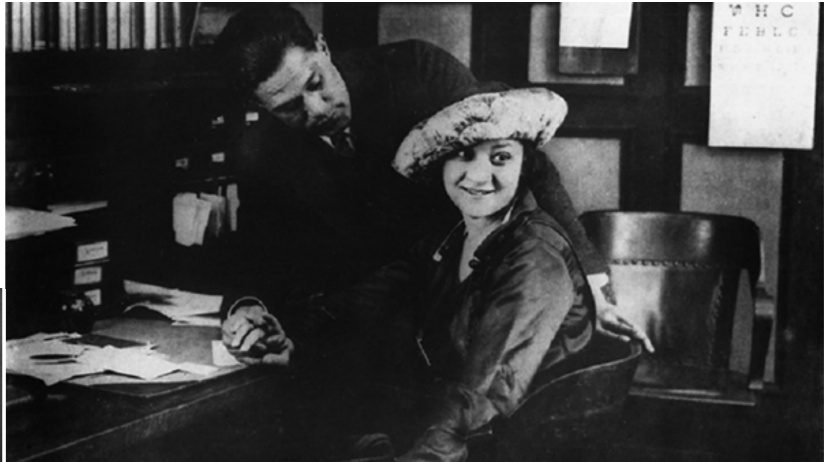
WITHIN OUR GATES

Literatur und Musik herausbildete. Das Ziel dieser künstlerischen Bewegung war ein selbstbewusster „New Negro“. Micheaux ließ sich zwar in diesem kulturellen Hotspot nieder, blieb aber als Macher populärer Filme, als hemdsärmeliger Self-Made-Man immer ein Außenseiter innerhalb einer sich als Avantgarde verstehenden schwarzen Künstler-Bohème. Obwohl er den Übergang zum Tonfilm geschafft hatte und bis in die 1940er-Jahre noch zwanzig Filme herstellen konnte, waren race movies immer weniger nachgefragt. Schon 1929 hatte King Vidor mit HALLELUJAH , einem Film mit komplett schwarzer Besetzung, enormen Erfolg gehabt, worauf Hollywood in der Folgezeit begann, Filme mit dem typischen „black type casting“ zu produzieren. Der Filmkomiker Stepin Fetchit wurde so mit seiner Paraderolle des faulen Schwarzen zum populärsten afroamerikanischen Filmstar der 1930er-Jahre.