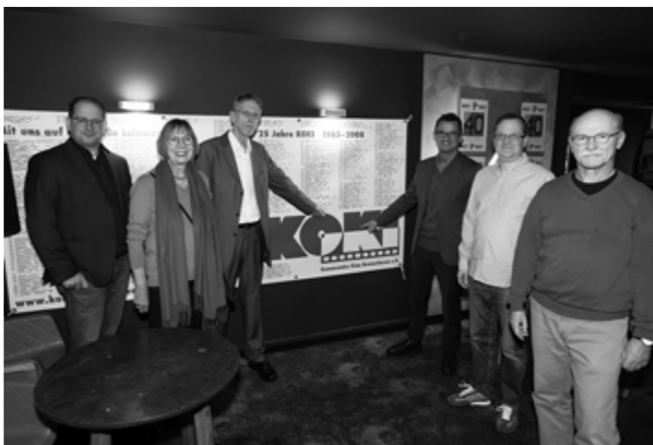
40. Geburtstag des KoKi Bremerhaven