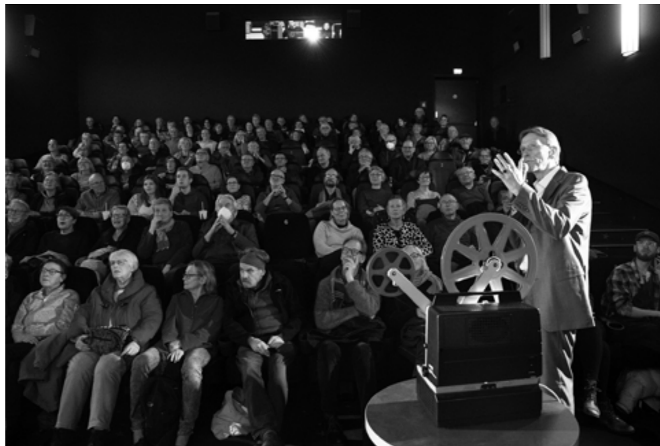
Impressionen von der Festveranstaltung zum 40. Geburtstag