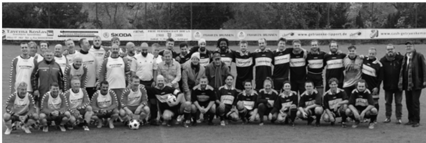
Das traditionelle Fußballspiel des FC Hofer Filmtage gegen die Hofer Filmwelt

Nach einer vor allem in der zweiten Halbzeit packenden Partie dreht der FC Hofer Filmtage das Spiel gegen den FC Filmwelt Hof und gewinnt das ewige Duell etwas glücklich, aber keineswegs unverdient mit 2:1. Der FCHF präsentierte sich trotz knapper Vorbereitungszeit und erheblicher Doppelbelastung offensiv spielfreudig und mit kompakter Defensive.