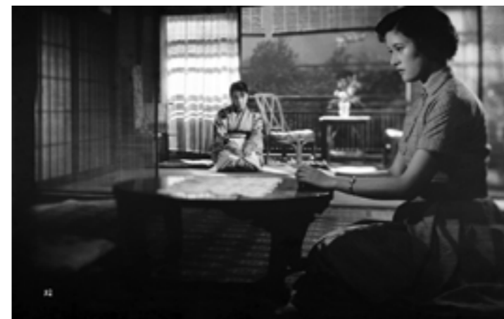
THE MOON HAS RISEN (1955)

Gründete ihre Popularität in den 1920er und 1930er Jahren auf komödiantischen und melodramatischen Sujets, so prägte ab den späten 1940er