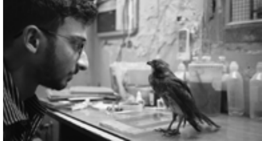
ALL THAT BREATHES