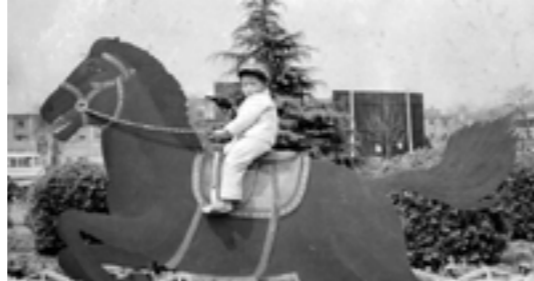
2/4 - FOUR JOURNEYS