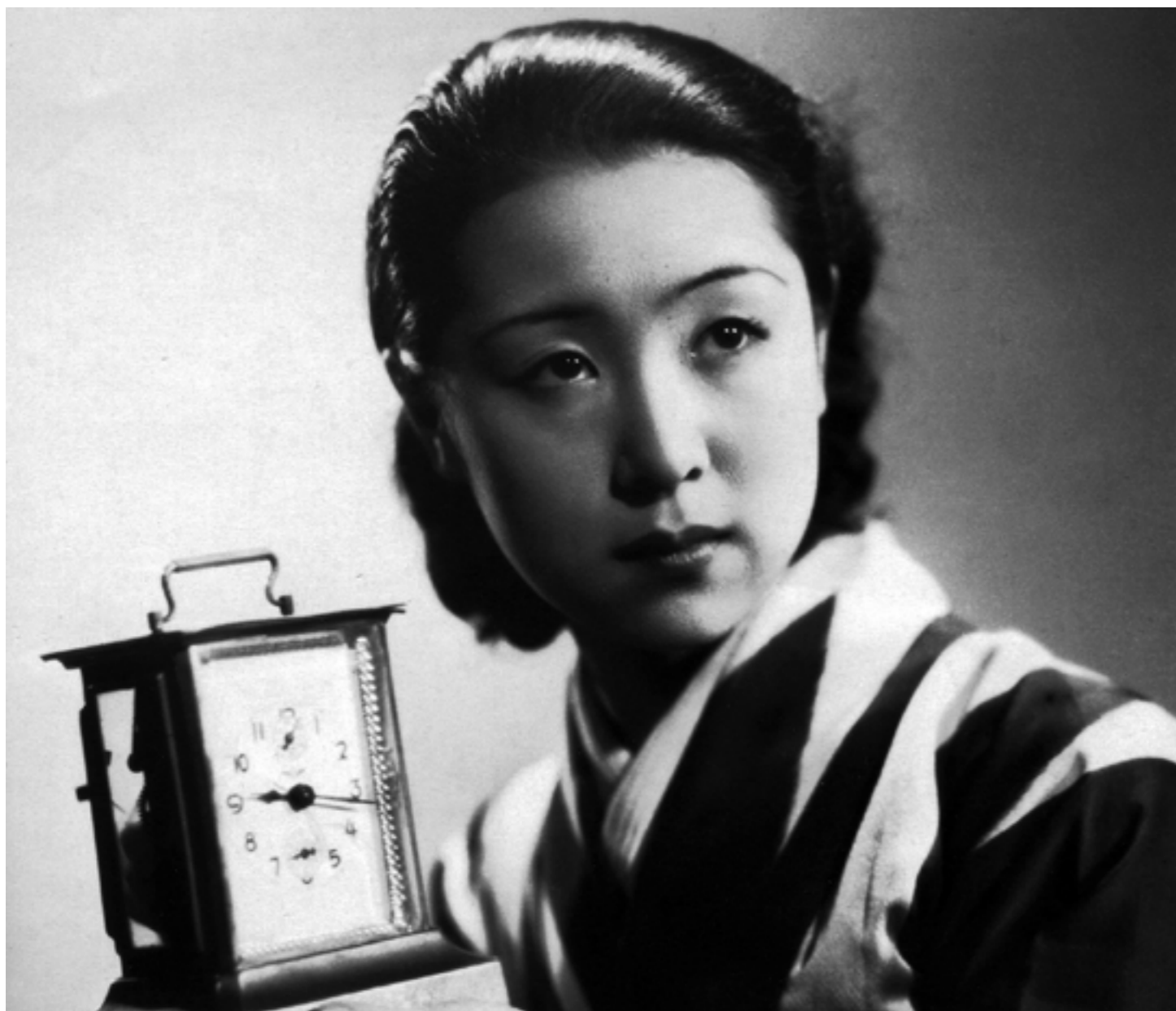
Kinuyo Tanaka in BURDEN OF LIFE (1935)