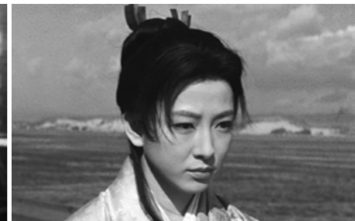
LOVE UNDER THE CRUCIFIX (1962)

Jahren vor allem der Regisseur Kenji Mizoguchi ihr Rollenbild als gedemütigte und zutiefst verletzte, leidende Frau. In Klassikern wie DAS LEBEN DER FRAU OHARU (1952) oder ERZÄHLUNGEN UNTER DEM REGENMOND (UGETSU MONOGATARI, 1953). Schon 1949, vier Jahre nach Kriegsende und andauernder amerikanischer Besatzung, hatte die japanische Regierung Tanakas Popularität genutzt und sie auf eine mehrwöchige Good-Will-Reise in die USA geschickt. Dort hatte sie vor allem in Hollywood vielbeachtete öffentliche Auftritte als Vertreterin des damals dort gänzlich unbekanntem japanischen Kinos. Auf Bildern sieht man sie gemeinsam mit Bette Davis, Joan Crawford und John Wayne, im edlen Kimono und mit hoch gesteckter Geisha-Perücke.