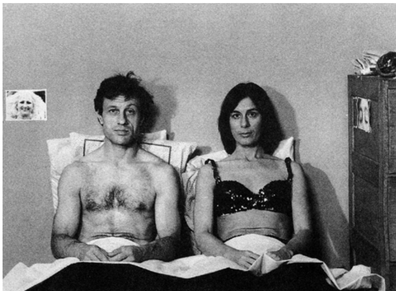
KRISTINA TALKING PICTURES (1976)