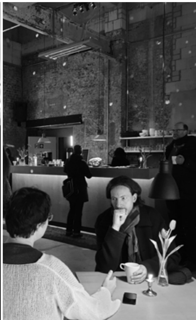
Pause während der Mitgliederversammlung im SINEMA TRANSTOPIA