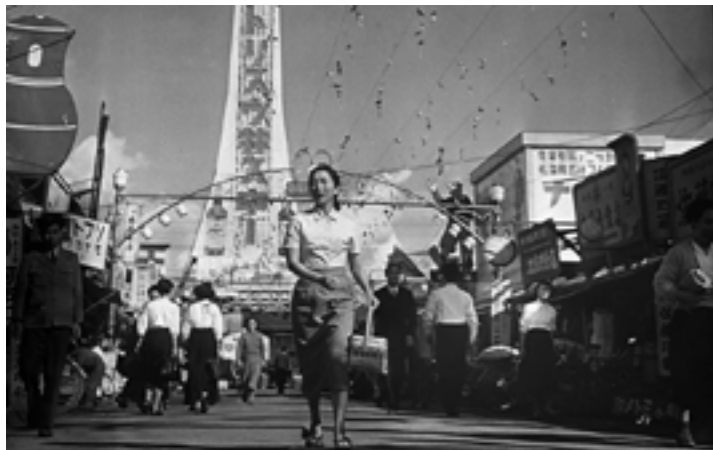
THE ETERNAL BREASTS (1955)