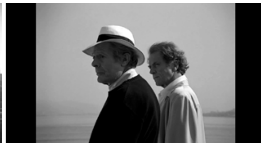
THE STRANGE CASE OF ANGELICA, 2010 DOURO, FAINA FLUVIAL, 1931 VIAGEM AO PRINCÍPIO DO MUNDO, 1997