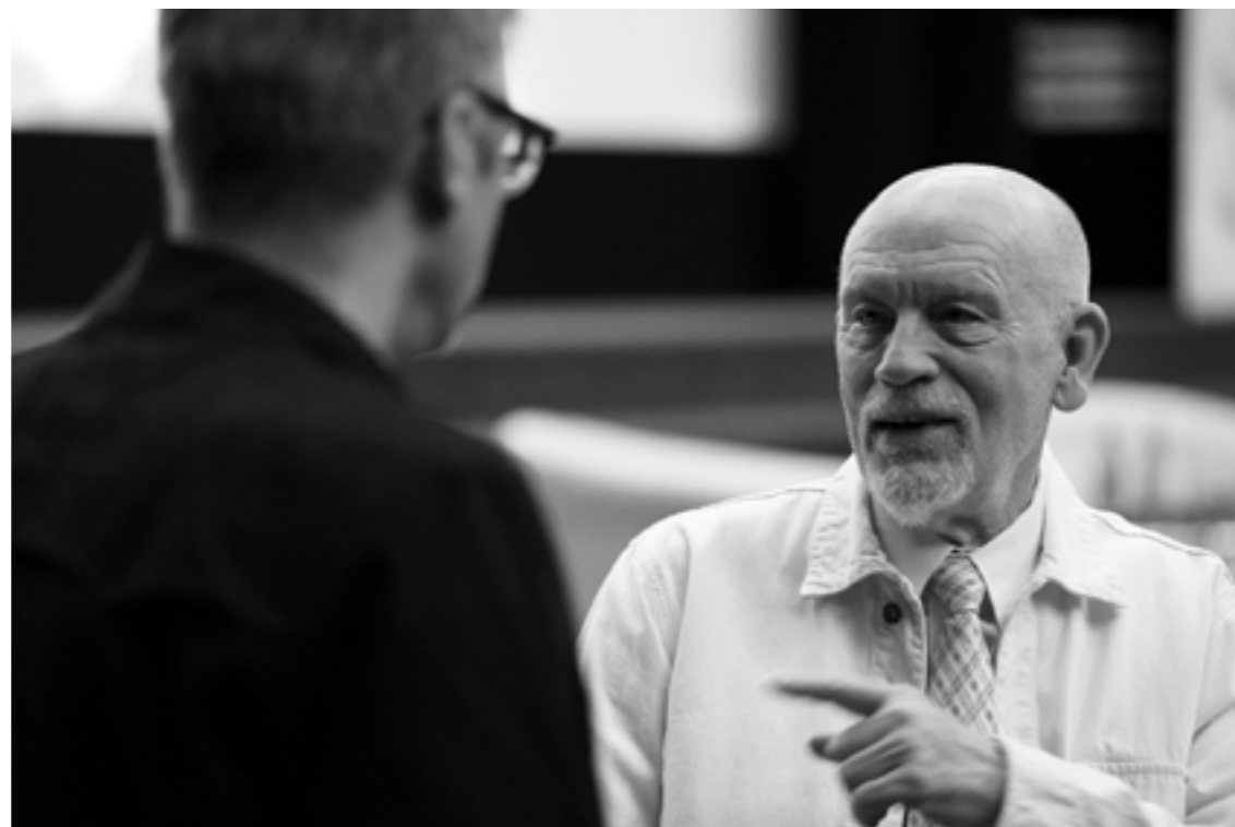
Prominenter Besuch: John Malkovich präsentiert MONSIEUR BLAKE persönlich im Caligari in Wiesbaden.

Die Redaktion redaktion@kinema-kommunal.de