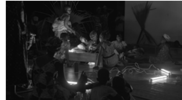
Stills from RESONANCE SPIRAL , cinematography Jenny Lou Ziegelel, 2024

In diesem Sinne werden künftige Ausgaben anders aussehen als vorangegangene und dabei vieles fortführen: Das Arsenal begreift seinen Kulturauftrag als kollektiven Lernauftrag. Nach über 60 Jahren seit der Vereinsgründung wird rückblickend deutlich, dass der Prozess der eigenen Institutionalisierung nie als abgeschlossen gelten darf, will man lebendig und resilient bleiben. Das Arsenal kann sich dabei auf ein über 10.000 Filme umfassendes Archiv stützen, das widerständige und zukunftsweisende Filme aus aller Welt vereint und somit das Wissen aus unterschiedlichen gesellschaftlichen Transformationsprozessen, sozialen, ökologischen und politischen Krisen, Umbrüchen, Befreiungskämpfen, Revolutionen und Kriegen zusammenführt. Wirkliche Bedeutung erlangt es aber erst im Austausch mit anderen Filmen und Archiven sowie in der Begegnung mit der Öffentlichkeit.