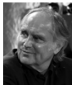
Michael Verhoeven beim Fernsehfilm-Festival Baden-Baden 2009

Nach seinem Tod widmete das Filmmuseum Percy Adlon am 21. März 2024 seine „Open Scene“-Veranstaltung und zeigte OUT OF ROSENHEIM (selbstverständlich in der bayrisch-englischen Originalfassung mit deutschen Untertiteln) sowie vorangestellt seinen Dokumentarfilm TRIP TO BAGDAD (2018), in dem er mit seiner Familie an den Drehort des Films zurückkehrt und sich an die Dreharbeiten erinnert. Im voll besetzten Saal waren zufällig auch etwa 40 Schüler*innen auf Klassenfahrt, die das Filmmuseum besuchen wollten. Als ich später die Lehrerin anschrieb, um sie nach der Meinung der Schüler*innen zu der Veranstaltung zu fragen, gab sie eine sehr aufschlussreiche Auskunft: Dieser Abend sei für die Klasse wie ein Besuch auf einem anderen Stern gewesen, eine völlig neue Kinoerfahrung. Vor allem beeindruckte die Schüler*innen, dass es eine starke Beziehung zwischen dem Filmemacher, dem Film und dem Kino gegeben hätte. Das sei für alle sehr neu gewesen. Percy Adlon hätte sehr gefallen, dass sein ‚alter‘ Film von einer neuen Generation gesehen wurde. Auch wenn die jungen Leute nicht an den gleichen Stellen gelacht hatten wie die Älteren. Als Kinomacherin war dieses Feedback eine äußerst positive Erfahrung und eine schöne Bestätigung für das eigene Tun, denn so ein Abend wäre nicht in irgendeinem beliebigen Kino möglich gewesen. Es war wie ein letztes Geschenk von und für Percy Adlon. Bestattet wurde er in Berlin, im Familiengrab der Adlons. Seine Familie und seine Filmfamilie waren da.