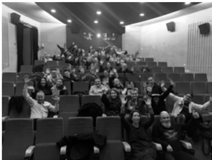
Autobahnkino: das Team im Saa1, 2023