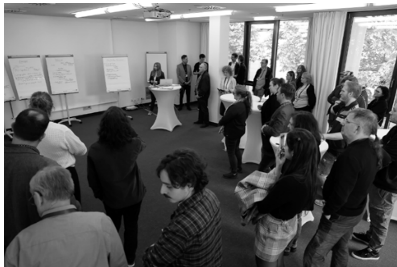
Workshop „Grünes Kino“ der drei Verbände auf der KINO in Baden-Baden