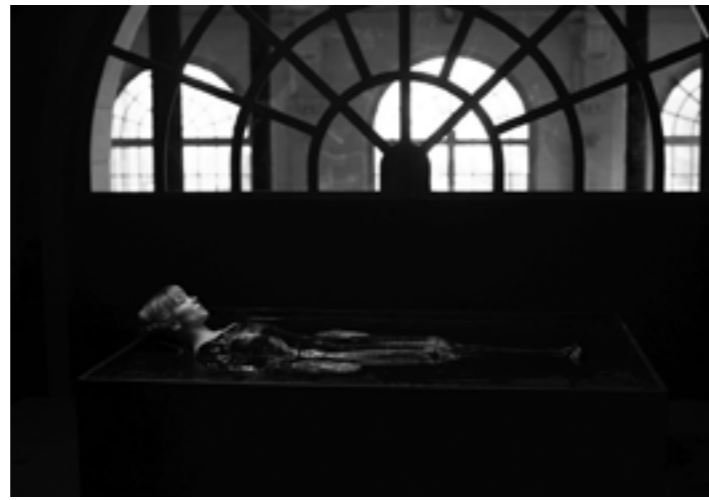
LA BÊTE