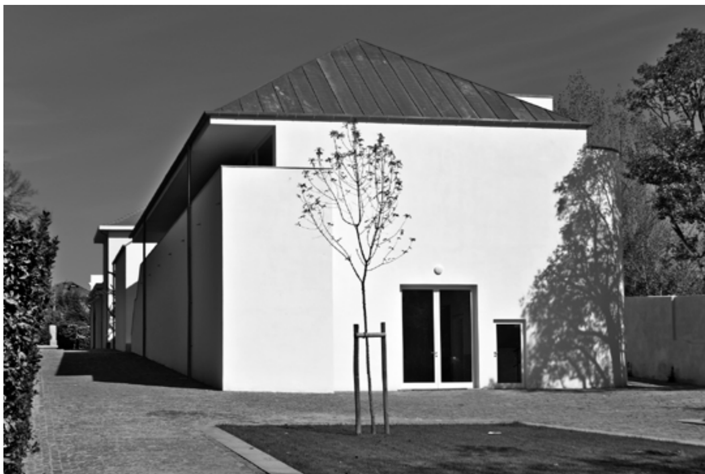
Casa do Cinema de Manoel de Oliveira

In NON ODER DER VERGÄGLICHE RUHM DER HERRSCHAFT ( NON', OU A VÁ GLÓRIA DE MANDAR ) von 1990 verliert sich im Urwald von Angola ein Trupp portugiesischer Soldaten, die nach dem Sinn ihres Einsatzes fragen. Der kommandierende Leutnant, der als Erzähler auftritt, berichtet von den großen Niederlagen der portugiesischen Geschichte, die der Film in historischen Tableaus, meist Schlachtenszenen, inszeniert. Der Regisseur Manuel de Oliveira wechselt dabei immer zwischen der Gegenwart der Soldaten in Angola und verschiedenen Ebenen der Vergangenheit, die alle um den Mythos des Scheiterns kreisen. Am Ende stirbt der Leutnant: Es ist der 25. April 1974, der Tag der Nelkenrevolution in Portugal, die das Ende der Jahrzehnte dauernden Diktatur und des Kriegs in den afrikanischen Kolonien bedeutete. Das am Filmende markant platzierte Datum, dessen fünfzigjähriges Jubiläum jüngst gewürdigt und gefeiert wurde, sollte auch im Leben des Regisseurs von einschneidender Bedeutung sein.