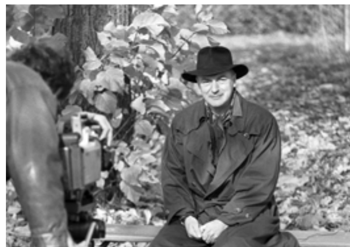
Hof 1987: Regisseur Percy Adlon bei den 21. Internationalen Hofer Filmtagen