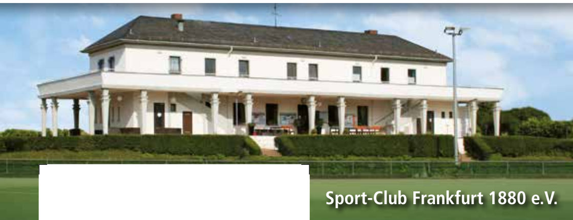
Sport-Club Frankfurt 1880 e.V.