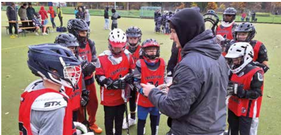
U12/ U16 Spieltag

Insgesamt war der Rückrundenaufakt ein voller Erfolg für unsere Jugendteams. Sie haben gezeigt, dass sie hart arbeiten und ihr Bestes geben, um unsere Farben stolz zu vertreten. Wir sind gespannt darauf, wie sich die Saison weiterentwickelt und sind zuversichtlich, dass unsere Jugendlichen weiterhin beeindruckende Leistungen zeigen werden.