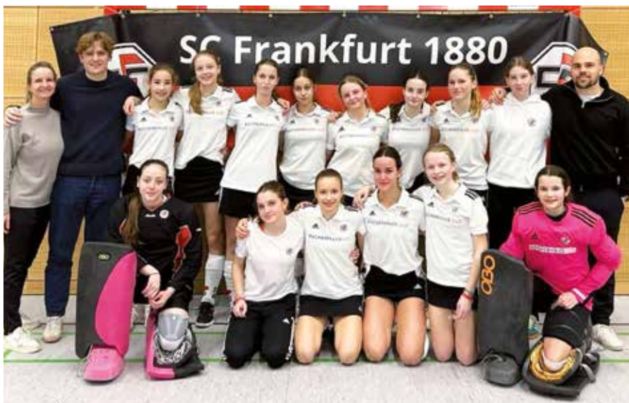
Das Team nach dem Endspiel

Das dritte und letzte Spiel des Tages, gegen die Alsteraner, verlief leider ebenfalls nicht sehr erfolgreich, und wir verloren die Partie klar mit 0:8. Aufgrund des schlechteren Torverhältnisses gegenüber