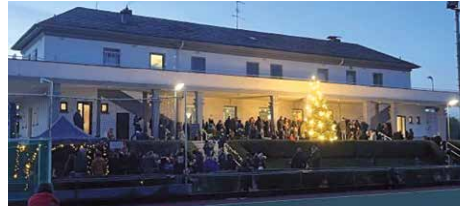
Weihnachtliche Stimmung vor und im Clubhaus

Nach dreijähriger Corona-Pause fand am 1. Advent endlich wieder der traditionelle SC80 Weihnachtsbasar rund ums Clubhaus statt, zum ersten Mal organisiert vom Förderverein Hockeyjugend. Alle Abteilungen (Hockey, Lacrosse, Rugby und Tennis) waren mit Weihnachtsständen vertreten