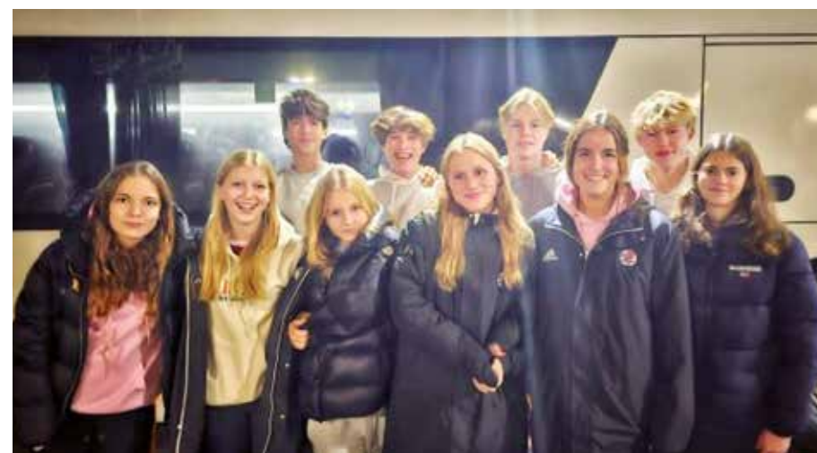
Unsere U15 Spielerinnen und Spieler in Berlin

Im Pokalturnier der Mädchen, dem Berlin Pokal, stand die wU15 aus Hessen am Samstagmorgen direkt den Titelanwärtern gegenüber. Die Berliner starteten wie erwartet sehr stark und erarbeiteten sich einige große Torchancen. Doch mit effektiver Defensivarbeit und auch mit etwas Glück dank des Torpfostens ließen die Hessen bis zur Halbzeit keinen Gegentreffer zu. Stattdessen gingen sie selbst kurz vor Halbpfeiff mit 1:0 überraschend in Führung. Auch in der zweiten Halbzeit hielt der Hessenkader gut gegen den Druck der Gegner mit, konnte aber den Ausgleichstreffer kurz vor Ende nicht verhindern: 1:1 – trotzdem eine Mega-Leistung gegen die späteren Sieger des Berlin Pokals! Auch gegen Baden-