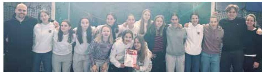
Unsere wU14 nach der Siegerehrung

Die ersten zwei Minuten im nächsten Spiel gegen den Gastgeber Klipper THC, einen der Favoriten, sollten am Ende über das Schicksal und Weiterkommen unserer Mannschaft entscheiden: die Mädels wurden durch einen direkten Ansturm der Hamburgerinnen völlig überrumpelt, es passte nichts mehr zusammen, individuelle Fehler kamen hinzu, schnelle Angriffe folgten und es stand plötzlich 0:3. Es dauerte noch fünf Minuten, bis sich unsere Mädels ein bisschen fingen und etwas Ruhe ins Spiel brachten. Ein Anschlusstreffer ließ nur ganz kurz hoffen, wurde er doch gleich mit zwei schnellen weiteren