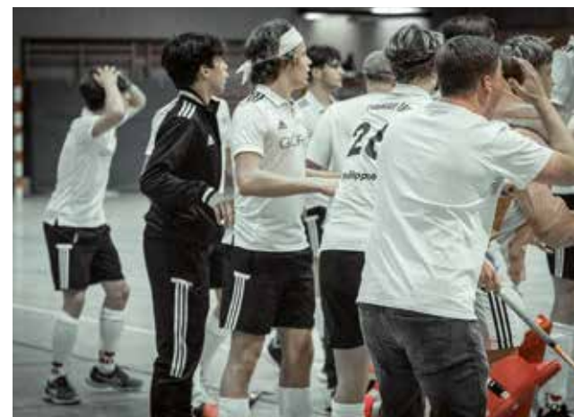
Trainer und Spieler können die Entscheidung der Schiedsrichter nach dem Schlusspfeiff nicht fassen

Nach der ersten Halbzeit führte München mit 2:0, doch unsere Jungs zeigten in der zweiten Halbzeit eine tolle kämpferische Leistung, gaben nicht auf und kam auch kurz vor Schluss durch einen verwandelten Siebenmeter noch einmal ran. Sekunden