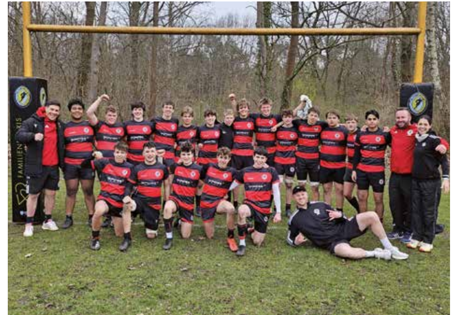
U18 nach Sieg in Berlin

schaft zwischenzeitlich deutlich zurücklag, konnte sie das Spiel kurz vor Schluss noch mit einem erfolgreichen Strafkick für sich entscheiden. Zwei Wochen drauf gab es eine erneut sehr harte Partie auswärts bei der SG Berlin United, die unsere wilden Kerle aber erneut mit 28:7 für sich entscheiden konnten! Da es in der U18 kein Finalturnier geben wird, zählt nur der Tabellenstand Mitte Mai – und damit ist jedes Spiel ein Endspiel, wenn man Meister werden will.