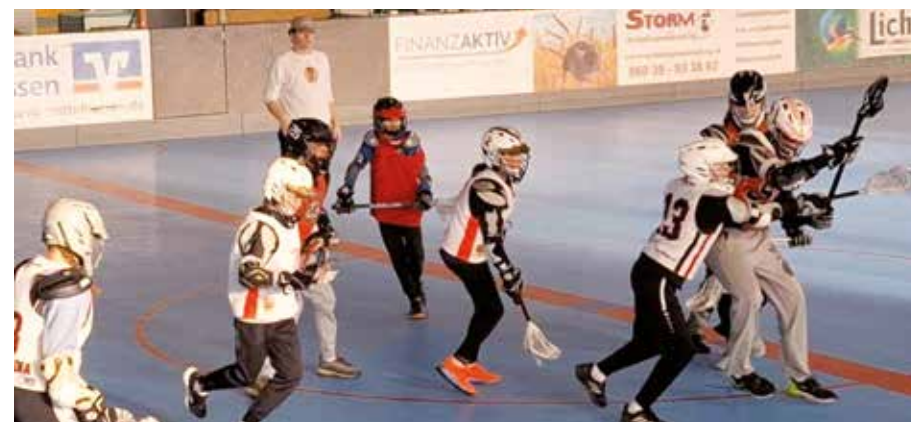
Boxlacrosse-Training in Assenheim

Das Boxlacrosse-Training der Frankfurter Jugend in Kooperation mit den Rhein Main Patriots in Assenheim hat in diesem Jahr einige spannende Entwicklungen zu bieten.