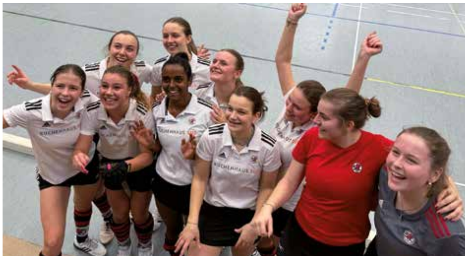
Gute Laune bei der SDM trotz verpasstem Halbfinale