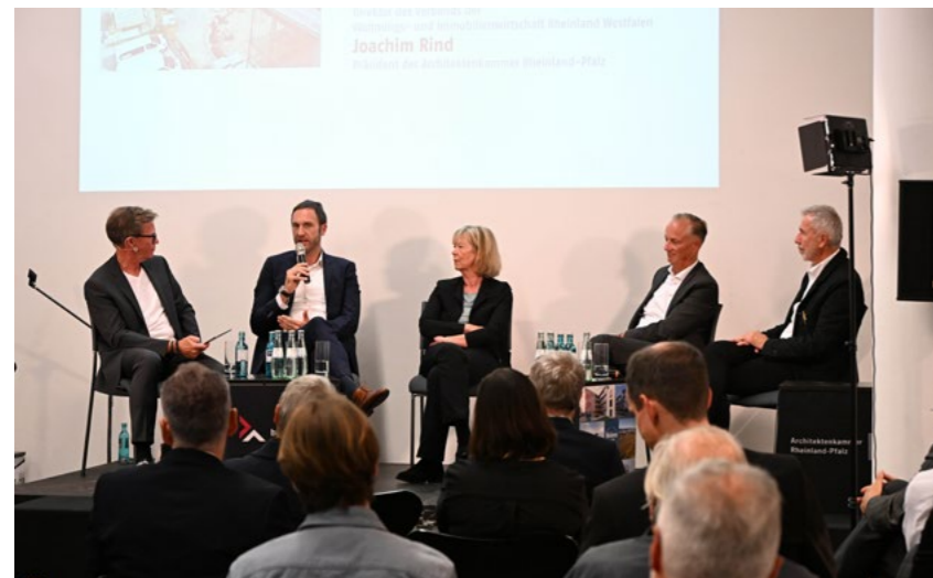
Im Zentrum Baukultur entwickelte sich ein lebhafter Austausch über die Wohnungspolitik in Rheinland-Pfalz.