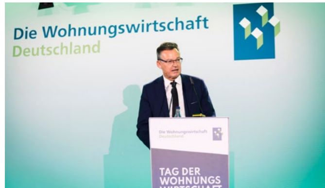
GdW-Präsident Axel Gedaschko

Beim Wohnen als der wesentlichen sozialen Frage unserer Zeit besteht immer dringender Handlungsbedarf: Die Baugenehmigungen stürzen immer tiefer ins Bodenlose, die Wohnungsbaubedingungen bleiben schlecht und beim Ansteuern der Klimaziele stehen die sozial orientierten Wohnungsunternehmen und ihre Mieter vor nicht leistbaren Kosten. Eine Besserung mit Blick auf die Finanzierbarkeit der riesigen Aufgaben ist bislang nicht in Sicht. Beim Tag der Wohnungswirtschaft in Berlin legte der GdW am 19. November seine Lösungen in Form von Positionen zur Bundestagswahl 2025 vor und diskutiert diese mit Bundesbauministerin Klara Geywitz, Professor Dr. Moritz Schularick, Präsident des Kieler Instituts für Weltwirtschaft, und weiteren hochkarätigen Gästen.