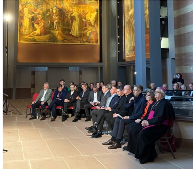
Stilvolles Ambiente: Die Jubiläumsgäste im Kaisersaal des Doms.

Vom VdW südwest erhielt die GSW die Jubiläumsurkunde der Wohnungswirtschaft, verbunden mit großem Dank für die verdienstvollen Leistungen der Gesellschaft für das bezahlbare Wohnen. Auch auf diesem Weg noch einmal unsere herzlichen Glückwünsche und die besten Wünsche für die Zukunft!