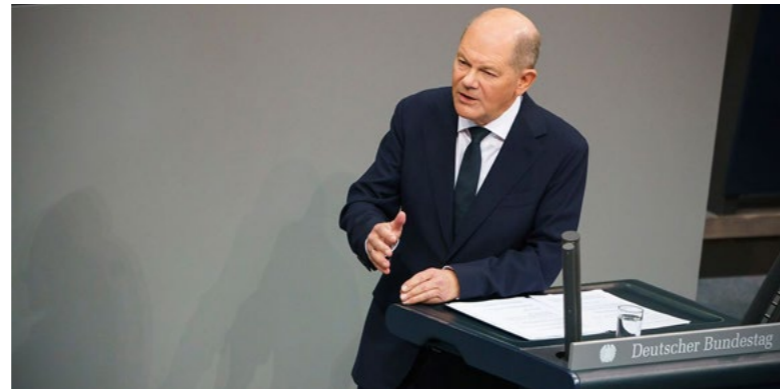
Die Ampelregierung mit Kanzler Olaf Scholz findet nach dem Koalitionsaus nicht mehr für alle Gesetzesvorhaben eine Mehrheit.

Ein weiteres Schwerpunktthema waren die Auswirkungen des zum 1. Januar 2025 in Kraft tretenden Bürokratieentlastungsgesetzes auf den genossenschaftlichen Bereich. An verschiedenen Stellen wurde im Genossenschaftsgesetz (Mitgliedschaftskündigung, Beitritt oder Übertragung von Geschäftsguthaben) die bisher zwingend geltende strenge Schriftform durch die weniger strengere Textform ersetzt, und zwar in Form der optionalen Einführungsmöglichkeit durch Satzungsregelungen. In einer angeregten Diskussion stellte sich heraus, dass die Wohnungsgenossenschaften hier weniger in Richtung einer Umstellung auf E-Mail-Erklärungen gehen möchten, sondern diese Formerleichterung eher bezüglich einer Implementierung von Mitglieder-Apps oder Portallösungen von Interesse ist, um Beitritte und Übertragungen digitaler gestalten zu können – weniger hingegen die Kündigungen. Digitale Lösungsangebote von Dienstleistern werden derzeit abgeglichen.