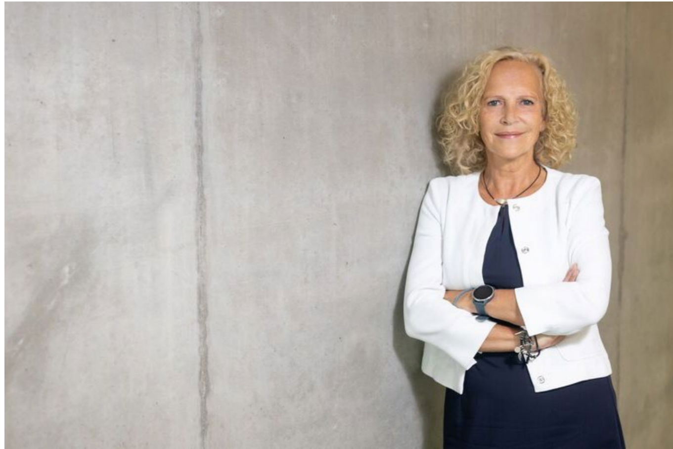
Ines Fröhlich bringt Erfahrung aus ihrer Staatssekretärinnen-Tätigkeit in Sachsen mit.