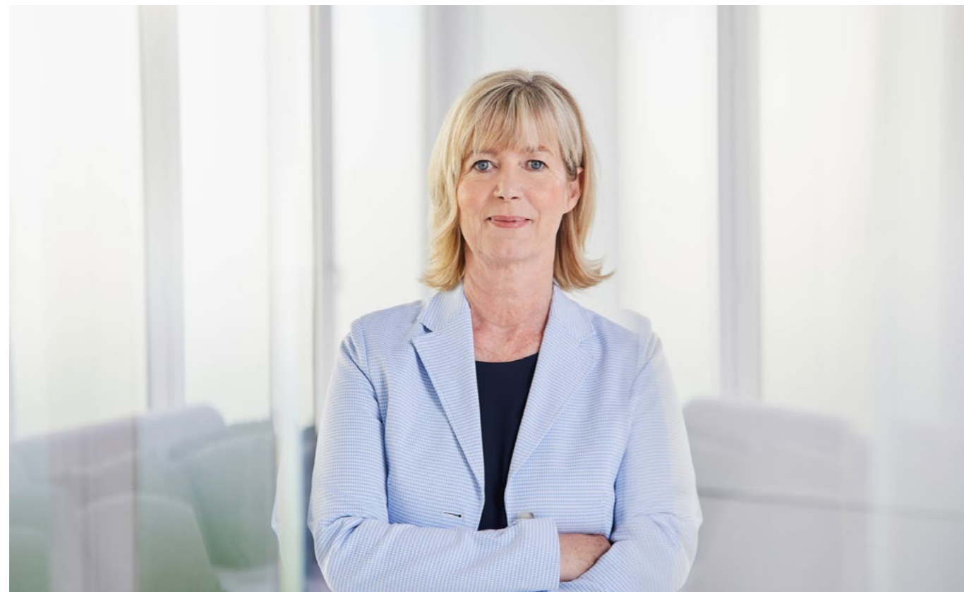
In zahlreichen Gesprächen mit Finanzministerin Doris Ahnen hat der VdW südwest die Interessen der sozial orientierten Wohnungswirtschaft vertreten.

Es liegt in der Natur der Sache, dass in schwierigen Verhandlungen nicht die Maximalpositionen durchgesetzt werden können. In intensiven und langen Gesprächen mit dem Finanzministerium, gipfelnd in mehreren Gesprächen