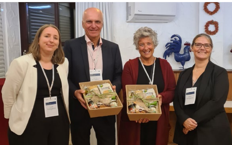
Auch in diesem Jahr erfreute sich das Azubi-Camp einem großen Zuspruch. Alle Teilnehmenden, Coaches und Experten verbrachten zweieinhalb inspirierende Tage miteinander.