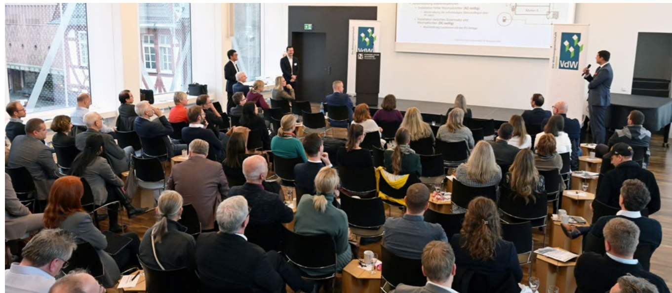
Über 70 Teilnehmer kamen zum Fachforum in die Evangelische Akademie nach Frankfurt.