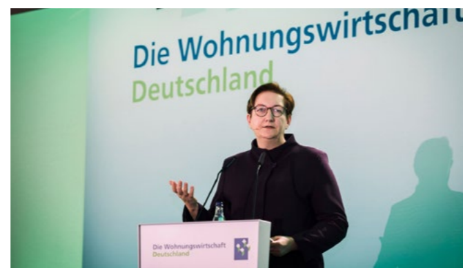
Bundesbauministerin Klara Geywitz