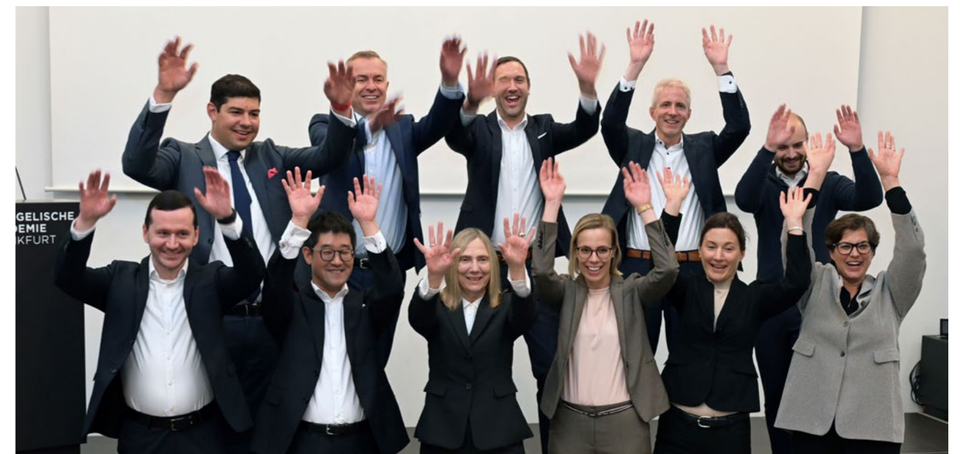
Geschafft! Das Team des VdW südwest freut sich über eine gelungene Veranstaltung.