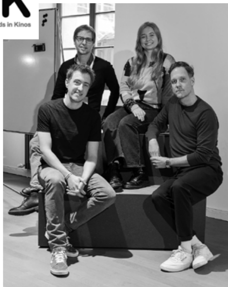
Die ÖMiK-Crew

ÖMiK Ökologische Mindeststandards in Kinos