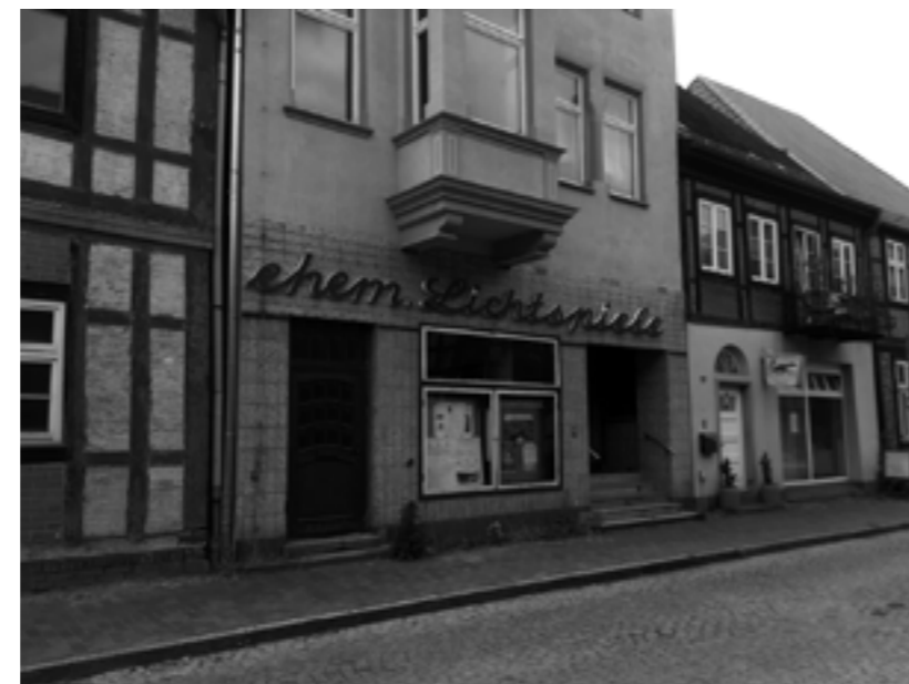
Ein ehemaliges Kino in Droemitz, MV