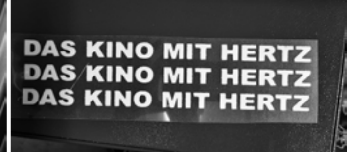
Ausrichterkinos des 19. Bundeskongresses © Johannes Litschel