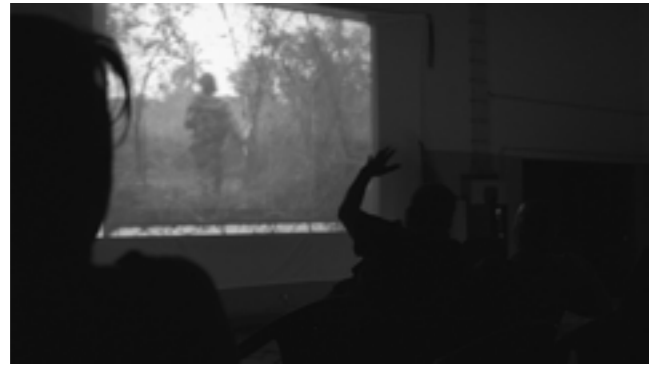
SPELL REEL (2017) von Filipa César © Filipa César

Kollektiv auf der Suche nach dem Kino der Zukunft: Arsenal on Location ist eine Serie von Kinoereignissen an verschiedenen Orten in und außerhalb von Berlin. Nach seinem Wegzug vom Potsdamer Platz, beginnt 2025 eine einjährige Pause ohne eigenen Kinosaal, bevor das Arsenal im silent green , einem nachbarschaftlich gelegenen Kulturzentrum im Berliner Wedding, wieder eröffnet.