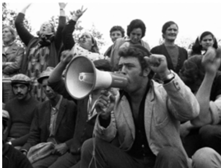
TORRE BELA