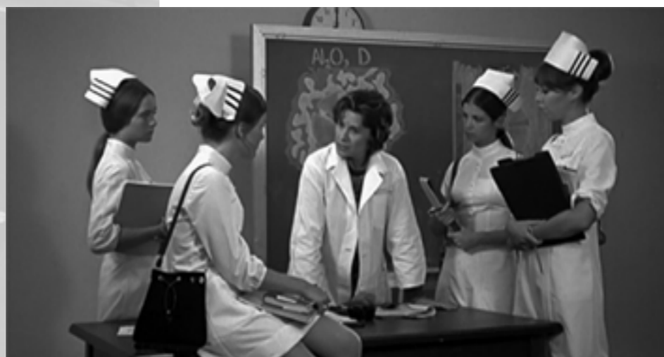
THE STUDENT NURSES

kleine Gruppe Widerständiger, die ein anderes Modell verwirklichen. In diesem spiegelt sich der make love not war spirit der 1960er Jahre wider und die Hoffnung auf Liebes- und Sexualbeziehungen, in denen Gleichheit herrscht statt Besitzdenken.