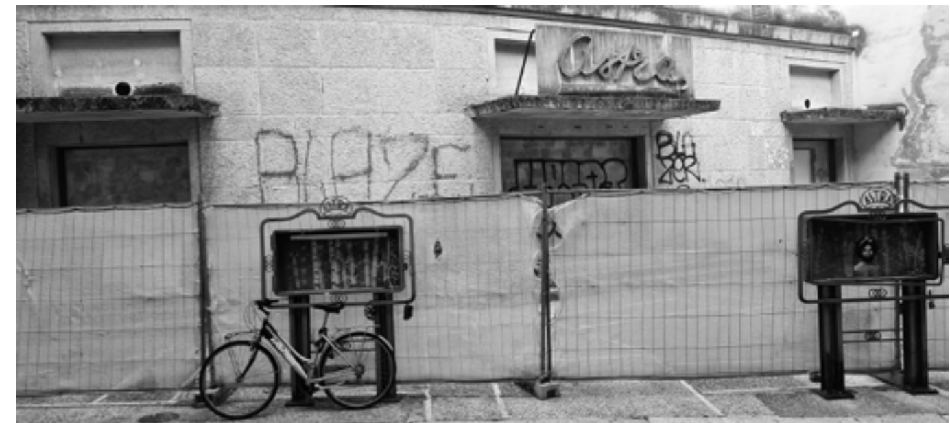
Ein ehemaliges Kino in Verona, IT