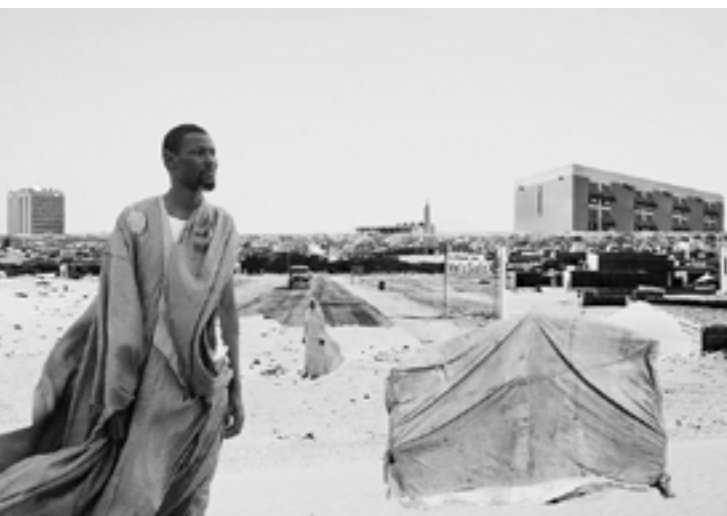
DOK Leipzig 2024: CRUSHED (R Camille Vigny); MINITOURISM (R Jan Grabowski); TALES OF A NOMADIC CITY (R Med Lemine Rajel, Christian Vium)

Auch die Filme des kürzlich verstorbenen Thomas Heise, dem das Festival einer von drei Hommagen widmet, sind ein Gegenprogramm gegen Schubladendenken. Seine Filme sind eine Übung im Hinsehen, im Sich-Einlassen auf offene Erzählungen. Heise zwingt dem Material des Lebens nie Bedeutungen auf. Er spricht nicht für andere, und er erzählt auch nicht zu Ende. „Immer bleibt was übrig, ein Rest, der nicht aufgeht“, heißt es mehrfach in EISENZEIT (1991), einem der Filme, den DOK Leipzig von Heise wiederaufführen wird.