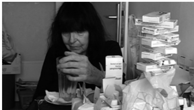
Friederike Mayröcker

„Ich habe gedacht, es soll ein Film über das Schreiben werden. Das Schreiben und das Schreiben. Aber wie macht man das denn? Vielleicht ist es bei anderen Autoren so, dass sie beim Sprechen andere Sachen hervorholen aus ihrem Hirn, während ich nichts hervorholen kann. Ich mag nicht sprechen! Und auf dieser Grundlage werden wir unseren Film aufbauen.“