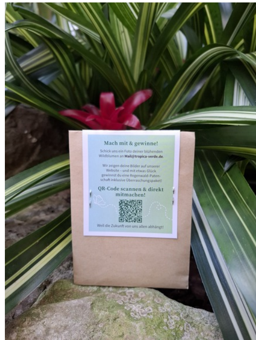
Bild: Saatmischung - Tropica Verde Wildblumen in Kooperation mit Tropica Kriftel

Im Rahmen unserer Umweltbildungsarbeit sind wir derzeit auf verschiedenen öffentlichen Veranstaltungen aktiv - unter anderem an Schulen und Kindergärten. Ein besonderes Highlight ist dabei unser Wildblumen-Gewinnspiel , das bei den Teilnehmenden auf große Begeisterung stößt.