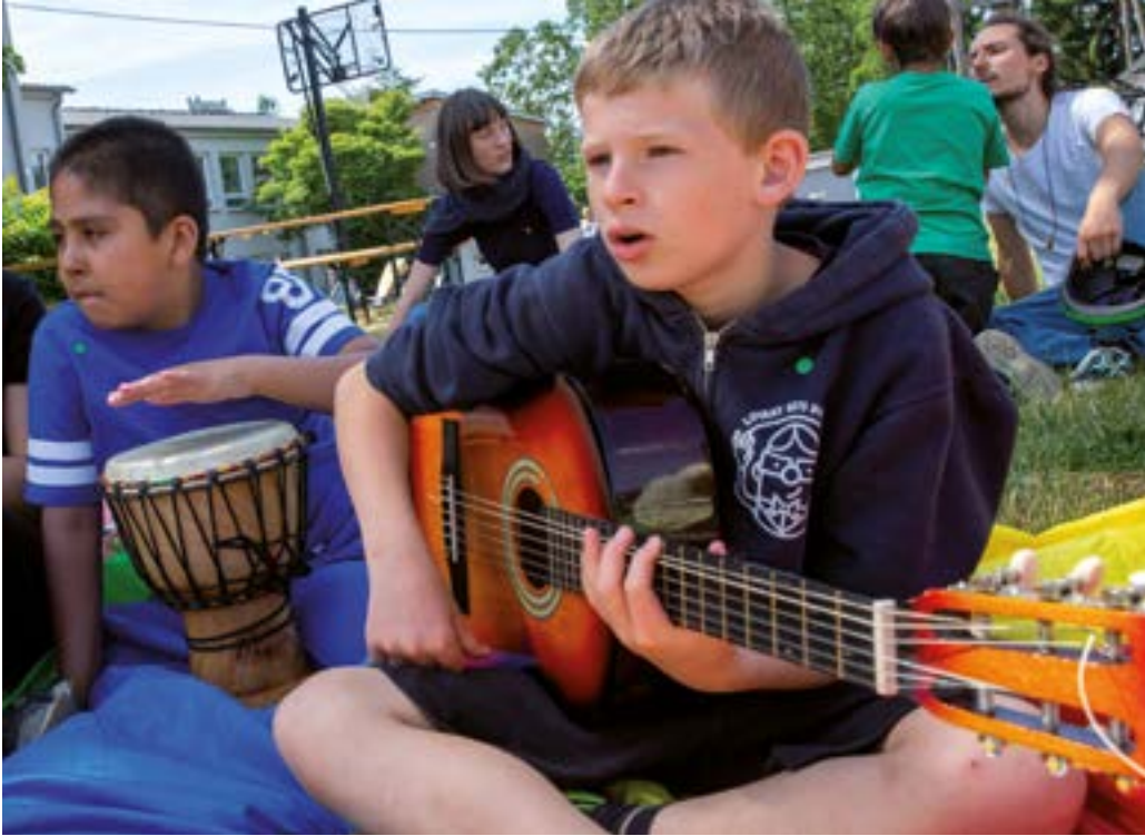
Musik macht Spaß und bringt alle zusammen.