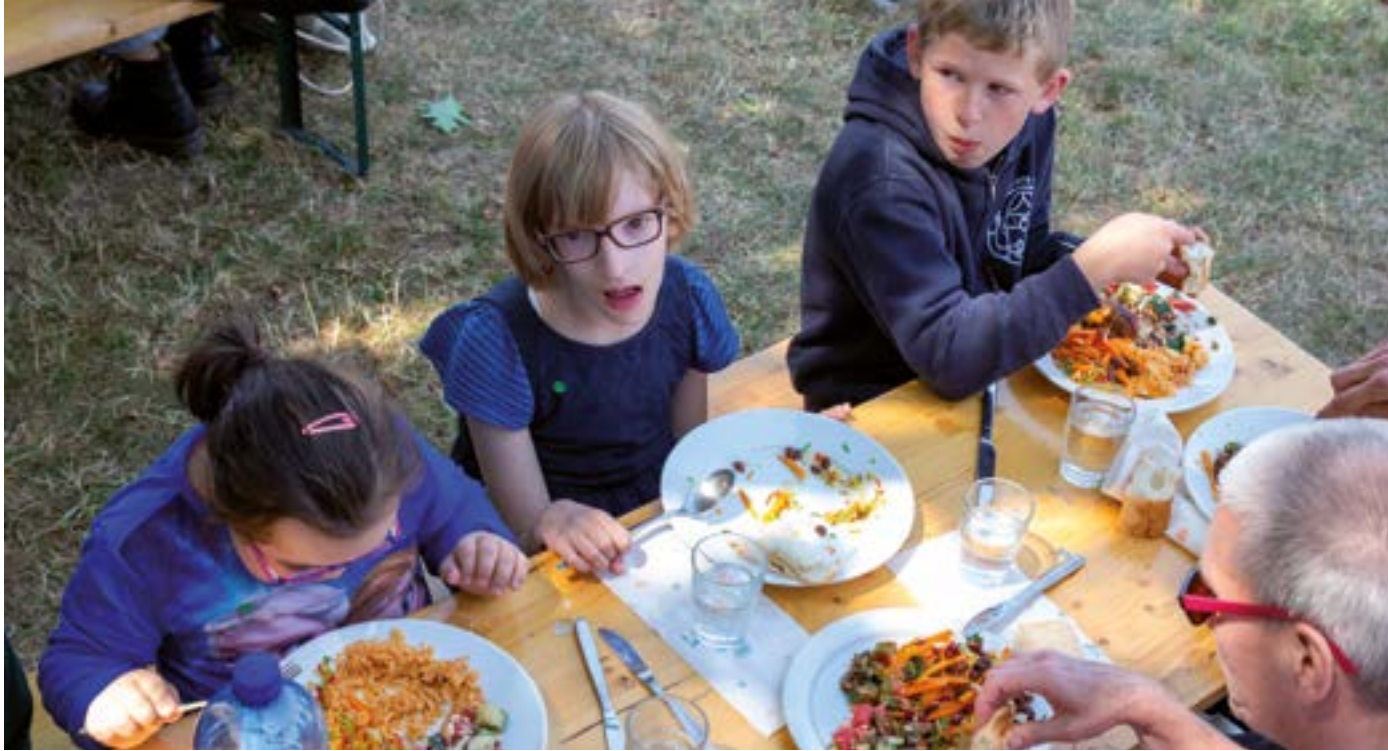
Das gemeinsame Mittagessen im Freien an der großen Tafel.