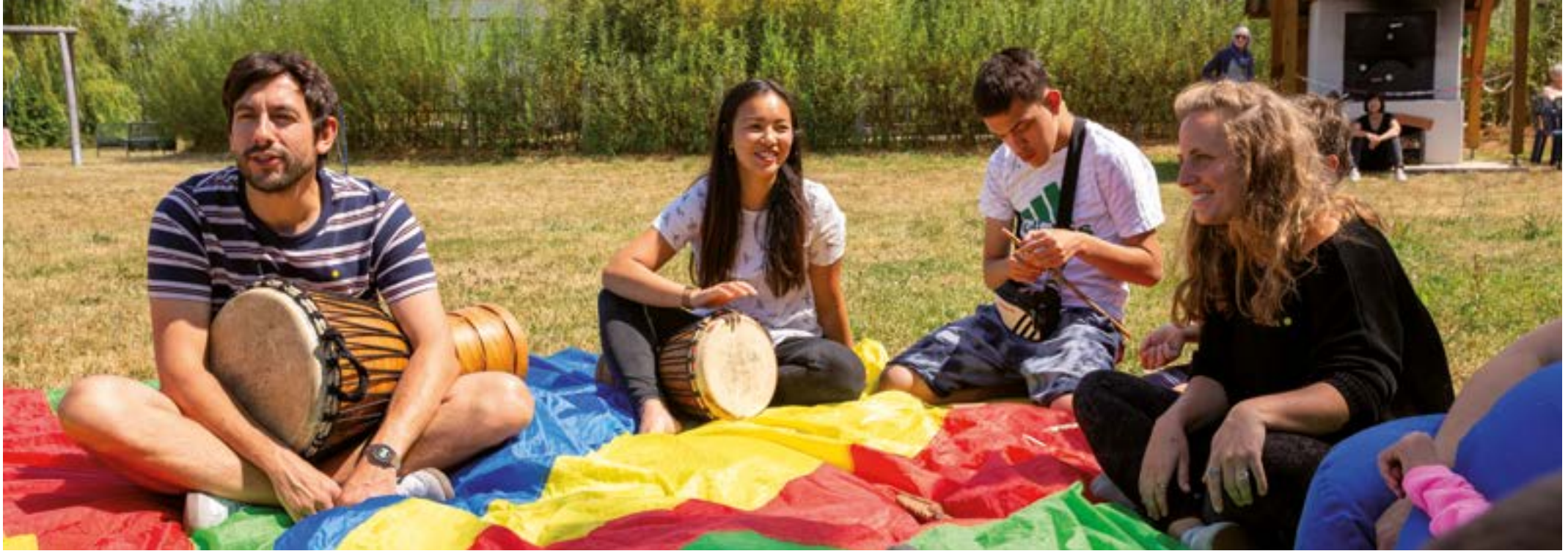
Alle zusammen: Teilnehmer*innen der Ferien-Intensiv-Betreuung und Mitarbeiter*innen machen zusammen Musik.