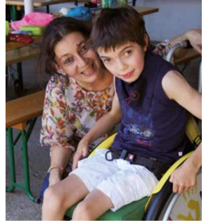
Zeit für Eltern und Kinder auf Gut Hausen.