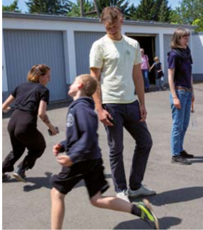
Die Mitarbeiter*innen schaffen auch Zeit zum Toben...