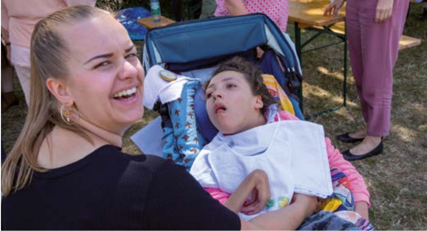
Beim Picknick – gemeinsam genießen wir Zeit in der Eins-zu-Eins-Situation.