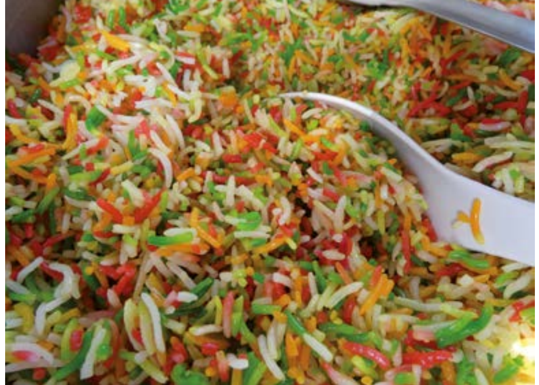
Bunter Reis ist der Favorit auf dem Buffet der Ambulanten Familienhilfe.

Die AFH bedeutet für mich Freizeit und Arbeit zu verbinden, durch viele Ausflüge in Schwimmbäder, Bibliotheken und auf Spielplätze in ganz Frankfurt. Singen und Tanzen inklusive.