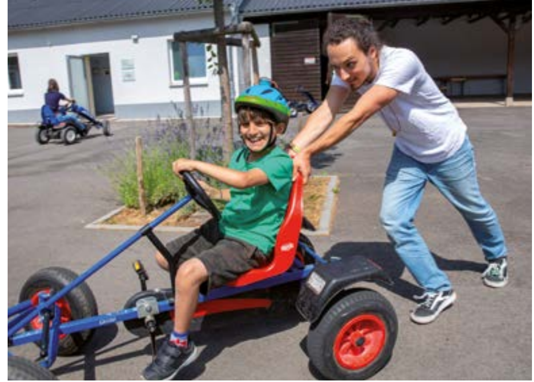
Der Innenhof auf Gut Hausen ist ideal zum Gokart fahren.