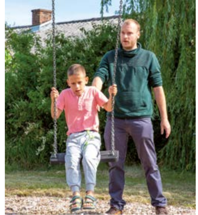
Ein Kind wird von einem Betreuer begleitet.