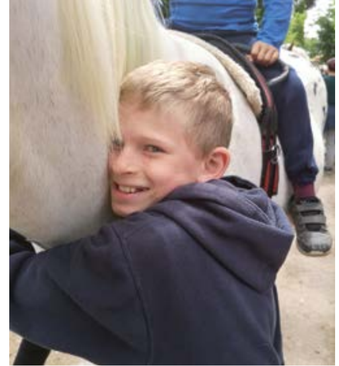
Der Reitausflug bringt große Freude.