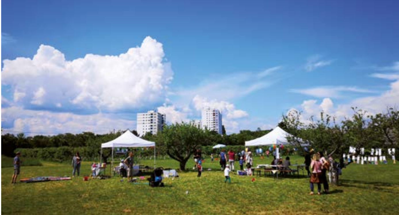
Gut Hausen ist ein Ort der Begegnung.