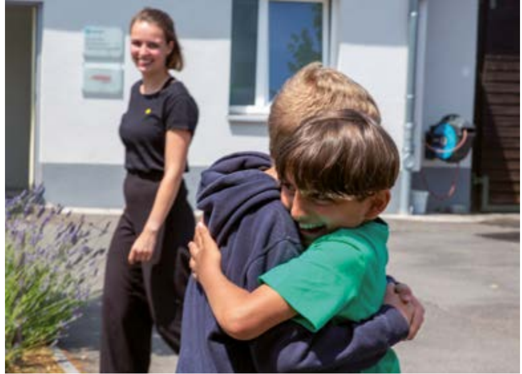
Herzliches Wiedersehen bei der Ferien-Intensiv-Betreuung.