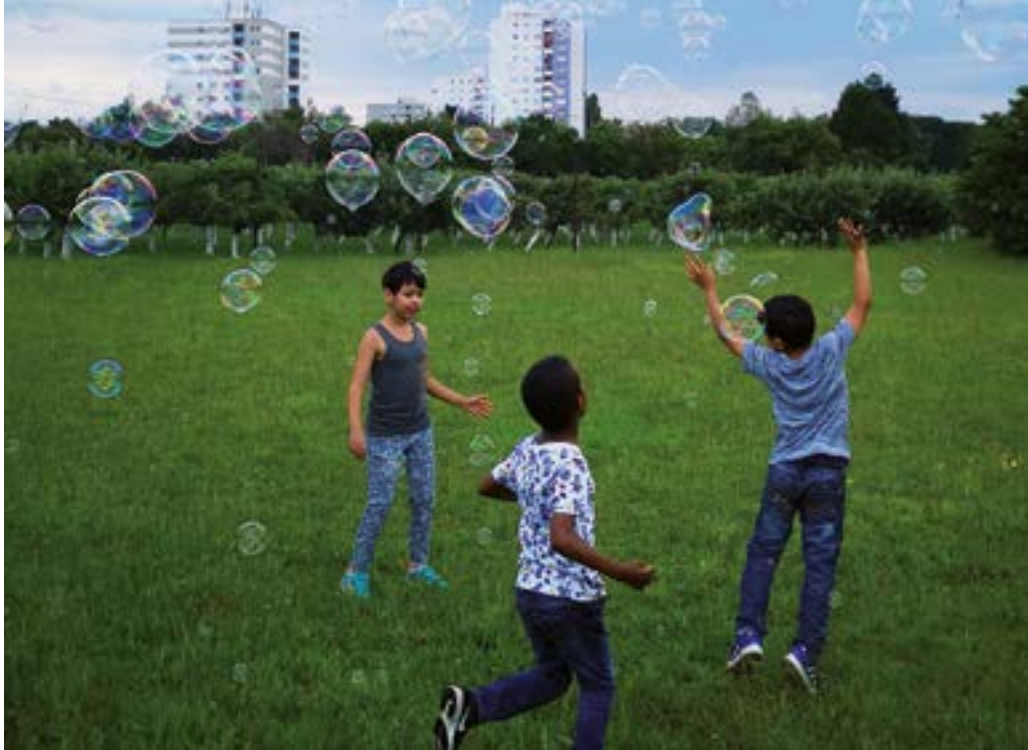
Manche Kinder genießen das freie Spielen und den Platz auf Gut Hausen.

Wer mag, kann seine freie Zeit auch auf Gut Hausen verbringen.