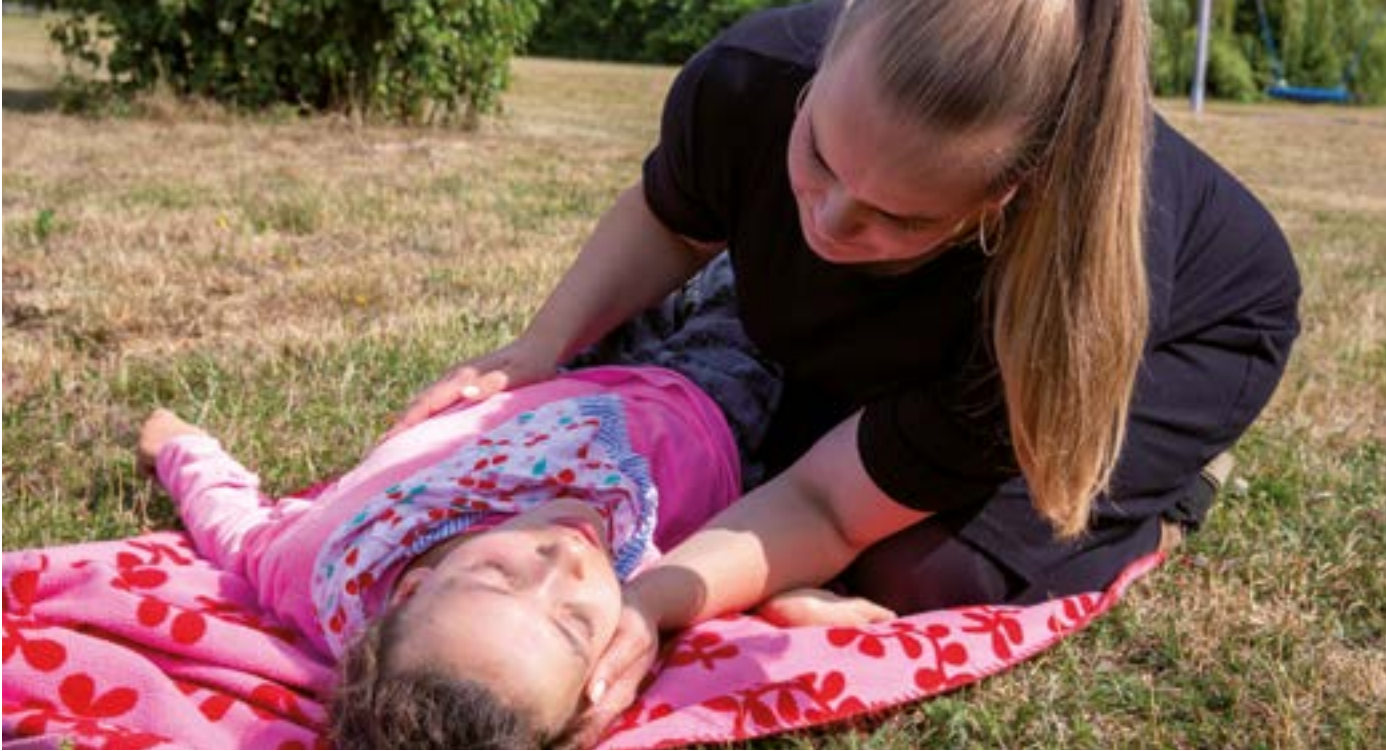
Die Mitarbeiter*innen können umfassend unterstützen – auch wenn viel Hilfe benötigt wird.