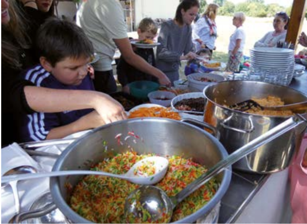
Für jeden das passende dabei: Das Buffet der Ferien-Intensiv-Betreuung.