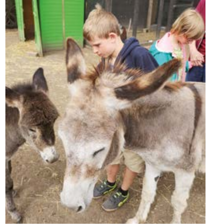
Tiere streicheln ist ein Erlebnis.