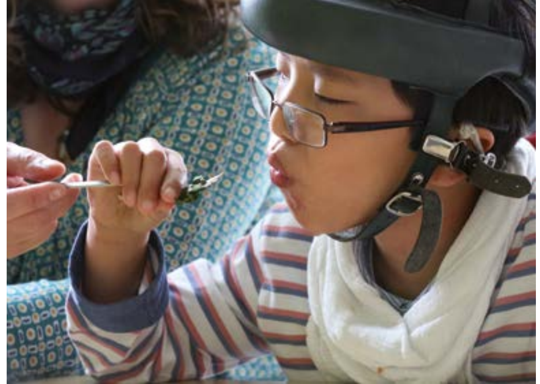
Manche Kinder nutzen die Eins-zu-Eins-Betreuung stärker.

Auf Gut Hausen gibt es viele Freizeit-Angebote. Zum Beispiel: