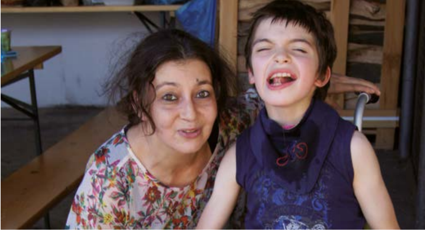
Kinder und Eltern bestimmen, welche Unterstützung sie wollen – und wie oft.