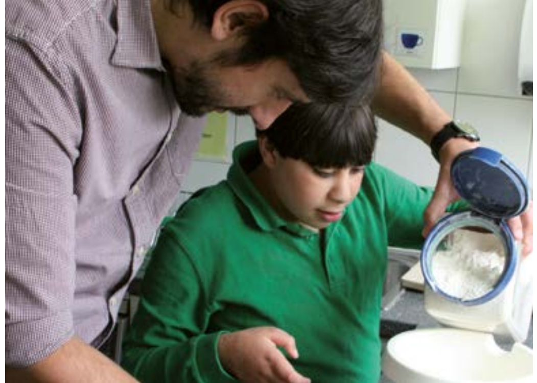
Wir kochen und backen gemeinsam in der Küche der Ambulanten Familienhilfe.

Damit Familien nicht alleine mit allen Aufgaben sind, gibt es die Unterstützung durch die Ambulante Familienhilfe. Viele Menschen, die ihre Angehörigen mit einer Behinderung zu Hause betreuen, wünschen sich zuverlässige Unterstützung.