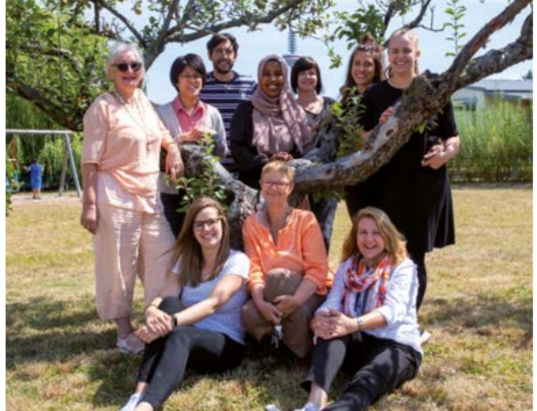
Einige aus dem Team der Ambulanten Familienhilfe.