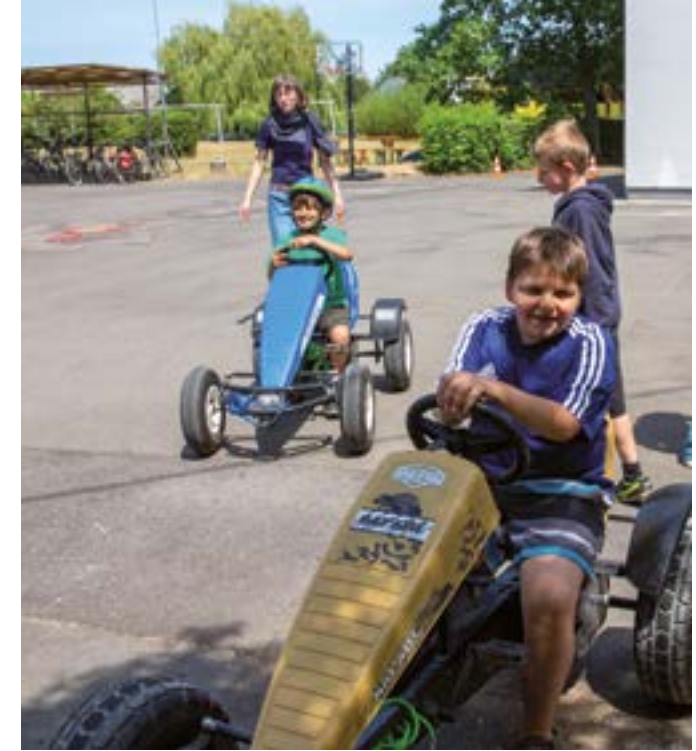
...und zum Gokart fahren.