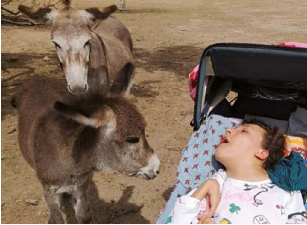
Glückliche Begegnung im Frankfurter Glückspark.