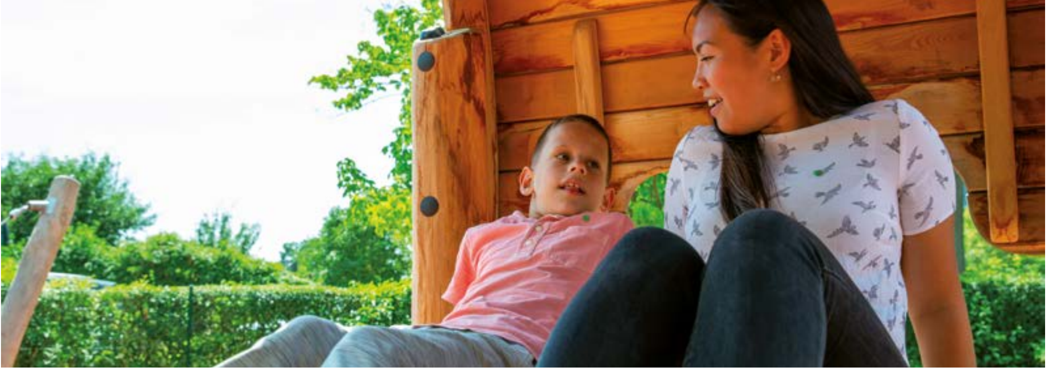
Bewegen und Entspannen: Zeit für Gespräche nach dem Toben auf dem inklusiven Spielplatz auf Gut Hausen.