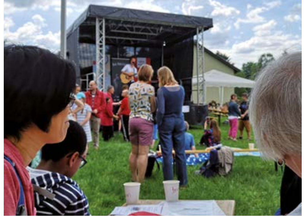
Projekt WIR lädt zum Konzerterlebnis ein.