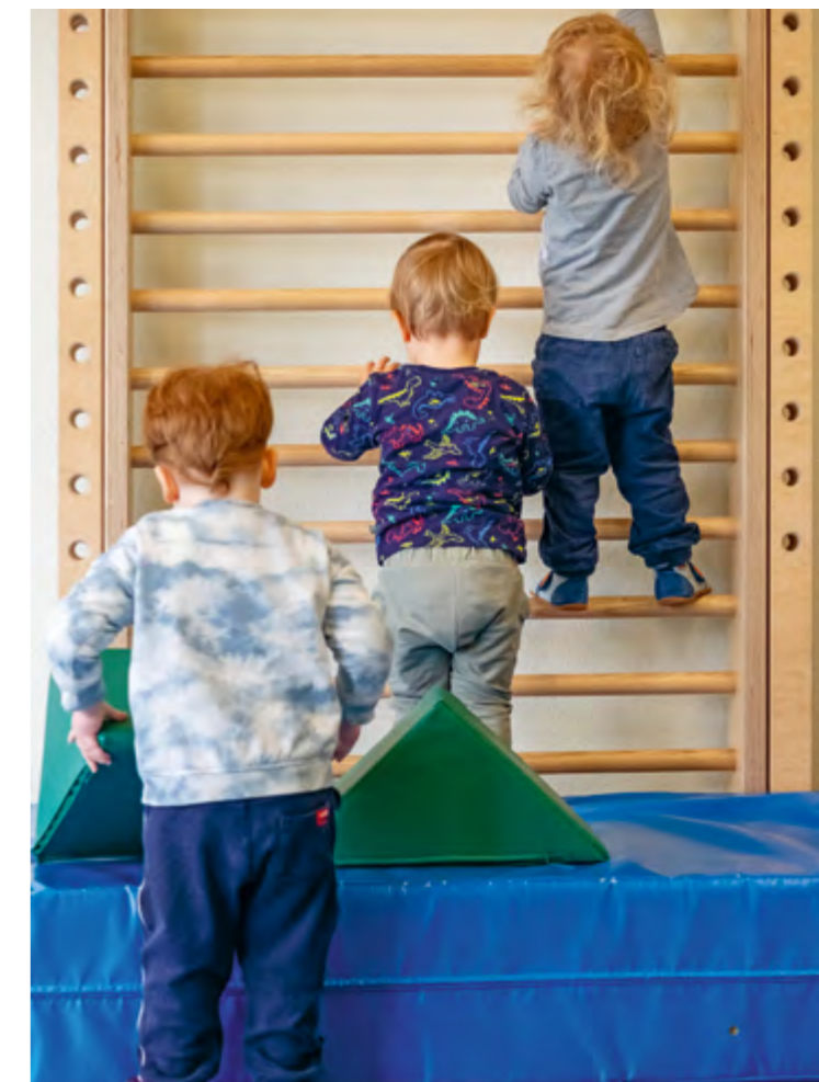
Abbildung 8: Das Klettern erfordert viel Mut.

Wir sind im regelmäßigen Austausch mit Therapeut*innen der Kinder. Für Kinder mit Beeinträchtigung findet zweimal im Jahr ein runder Tisch statt. Hier tauschen sich die Erziehungsberechtigten, alle Therapeut*innen sowie unsere Fachkräfte miteinander aus.