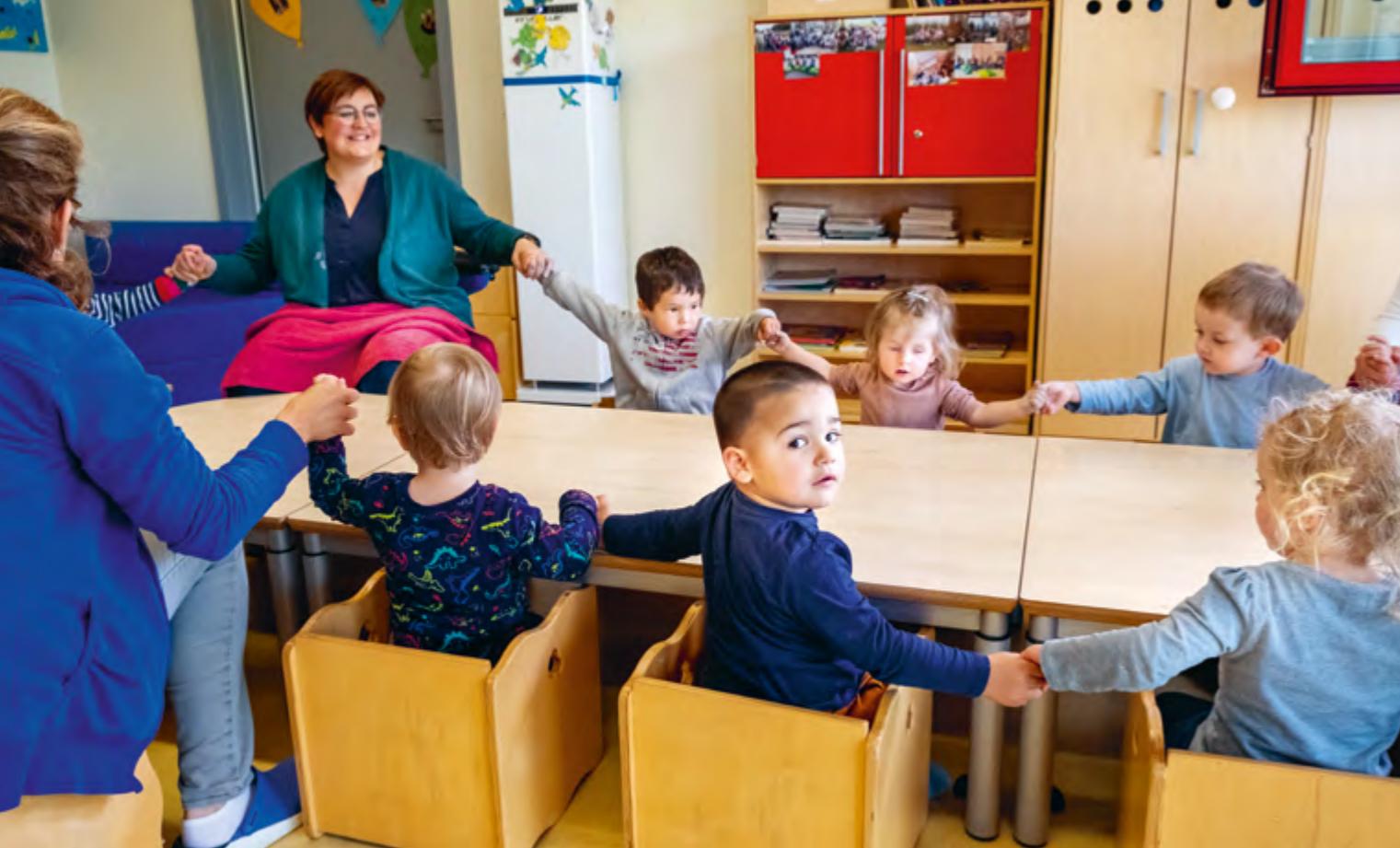
Abbildung 41: „Rolle, rolle, der Wagen ist volle, der Bauch ist so leer, brummt wie ein Bär, brummt wie ein Brummer, darum guten Hunger...“