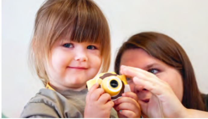
Abbildung 22+23: Kinder können eigenständig entscheiden.