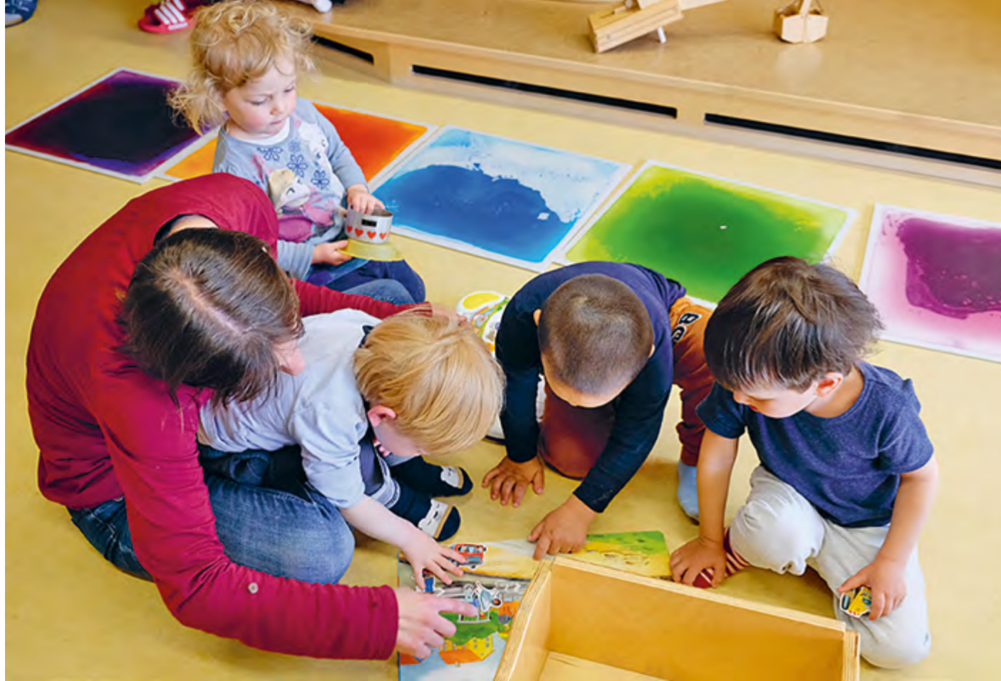
Abbildung 16: Beim gemeinsamen Lesen üben Kinder soziale Prozesse.