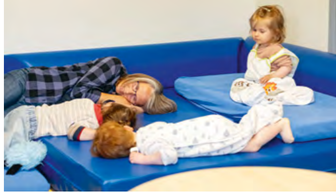
Abbildung 18+19: Durch Begleitung fühlen sich die Kinder sicher.

Darauf aufbauend sind die Kinder der Ausgangspunkt für die Bildung: Sie zeigen uns, für welche Themen sie sich interessieren. Kinder suchen nach neuen Erfahrungen und Erlebnissen. Darauf gehen wir ein.