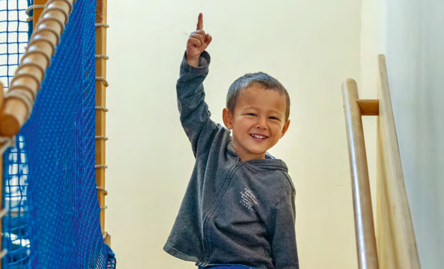
Abbildung 44: Hier kann ich mitbestimmen!