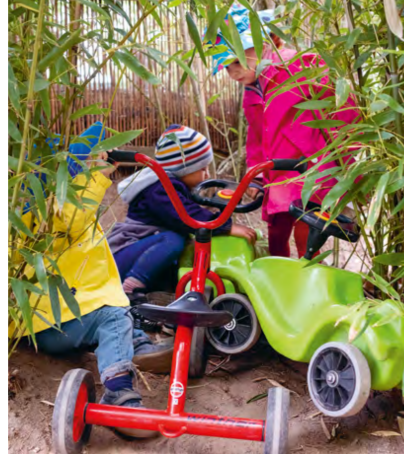
Abbildung 45+46: Die Kinder verstecken sich im Bambuswald oder hinter dem Schrank, um ungestört zu spielen.