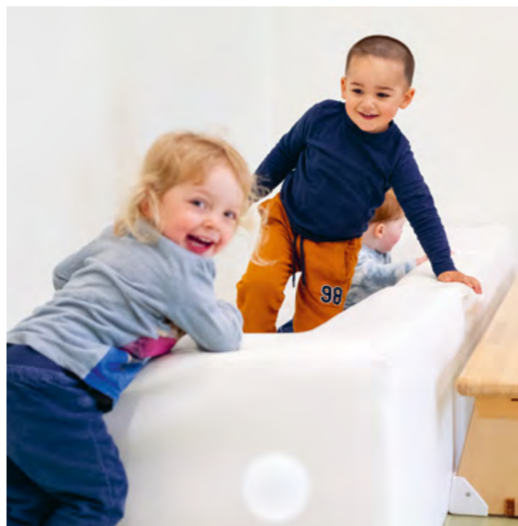
Abbildung 2: Das Bällebad im Snoezelenraum ist sehr beliebt.

In der Gruppe üben die Kinder, wie Gemeinschaft funktioniert.