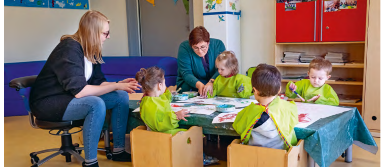
Abbildung 11: Gemeinsame Kunst – Jedes Kind schafft ein eigenes Werk.