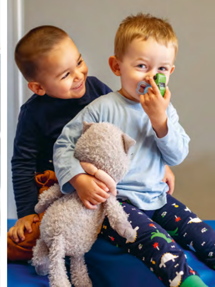
Abbildung 42+43: In der Krabbelstube wird alles gemeinsam gemacht.