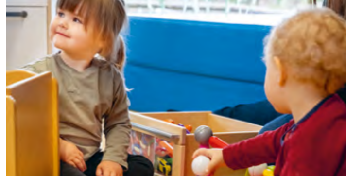
Abbildung 3+4: Jedes Kind kann mitmachen.

Jedes Kind, das in einer unserer Integrativen Kindereinrichtungen betreut wird, hat bereits viele Erfahrungen in verschiedensten Bereichen gesammelt [Basiskompetenzen]. Wir unterstützen die Kinder dabei, ihre Erfahrungen zu erweitern und Fähigkeiten zu erwerben. So werden die Kinder für das Leben stark. Dabei fördern wir zum einen individuelle Kompetenzen des Kindes, wie zum Beispiel Problemlösen oder das Selbstwertgefühl [Individuumsbezogene Kompetenzen]. Zum anderen sind die Kinder in unseren Einrichtungen mit anderen Menschen zusammen und wir stärken sie darin, empathisch, kommunikativ und kooperativ zu sein [Kompetenz zum Handeln im sozialen Kontext]. Dabei möchten wir den Kindern auch Kreativität und Werte des sozialen Miteinanders vermitteln. So werden die Kinder stark, um Veränderungen und Belastungen erfolgreich zu bewältigen und schwierige Situationen als Herausforderung zu begreifen [Resilienz].