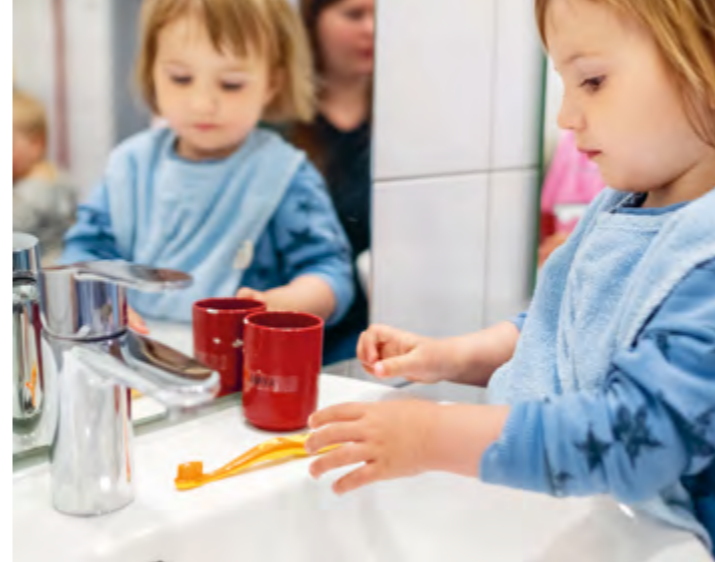
Abbildung 28: Nach dem Frühstück putzen die Kinder ihre Zähne.