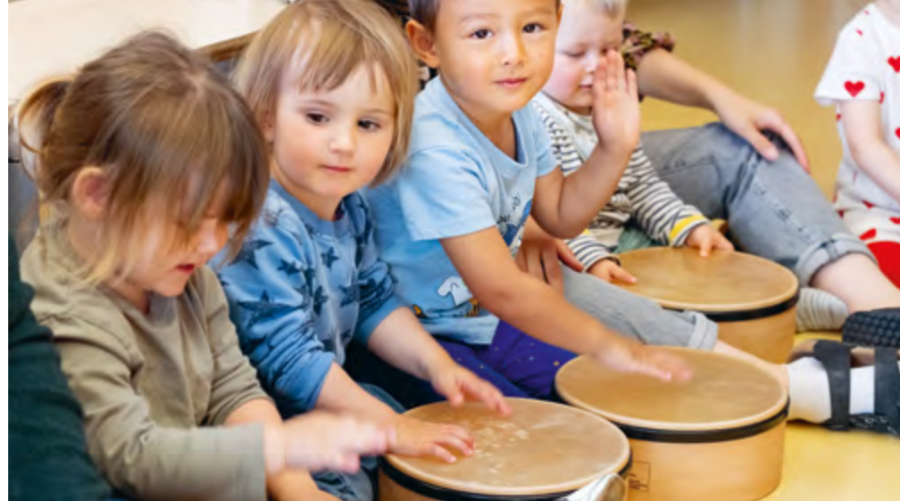
Abbildung 31: Musizieren.