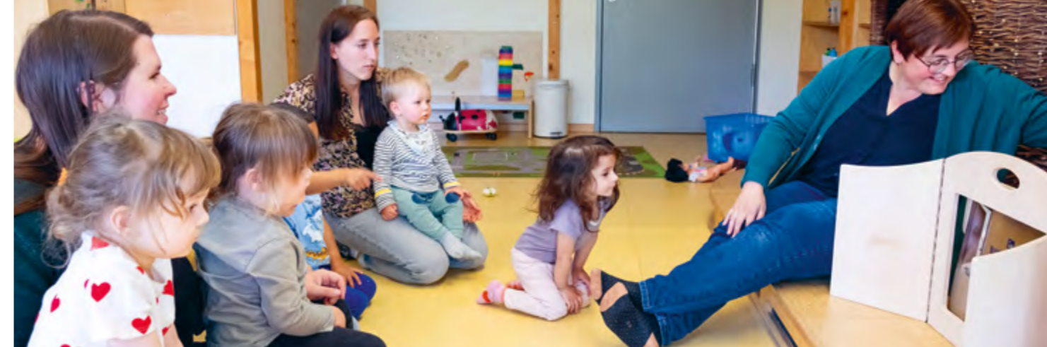
Abbildung 40: Die Kinder sind ganz gespannt auf die Geschichte im Buchtheater.