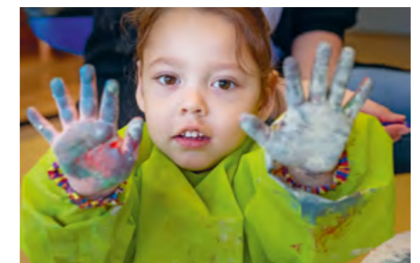
Abbildung 12: Jedes Kind hinterlässt seinen eigenen kreativen Fingerabdruck.

Gemeinsames Singen und Musizieren fördert nicht nur das soziale Lernen und die Kontaktfähigkeit, sondern wirkt sich zudem auch positiv auf die Sprachentwicklung der Kinder aus. Die kindliche Freude daran, Töne zu produzieren und zu entdecken, kann in gemeinsamen Musik- und Singkreisen gut aufgegriffen werden.