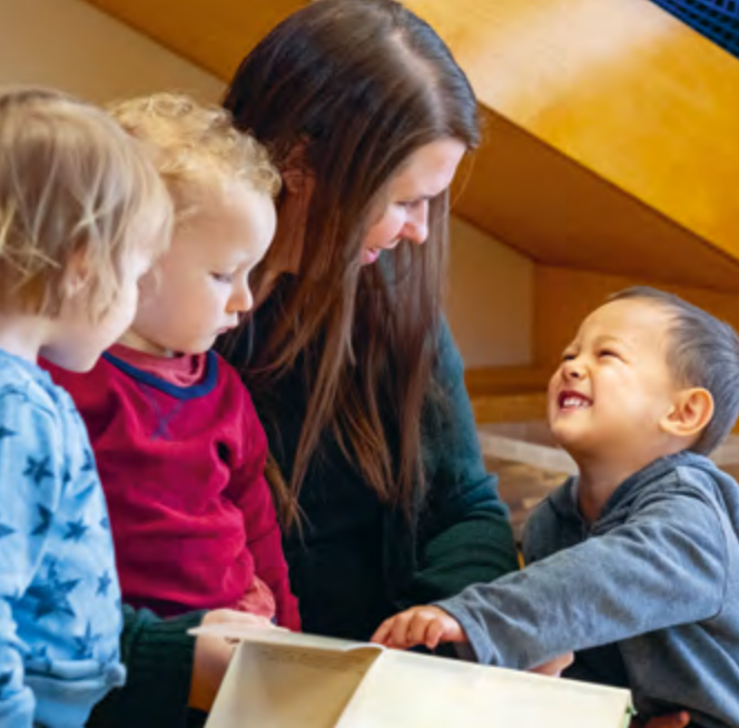
Abbildung 9: Beim Lesen von Büchern kommen wir ins Gespräch.