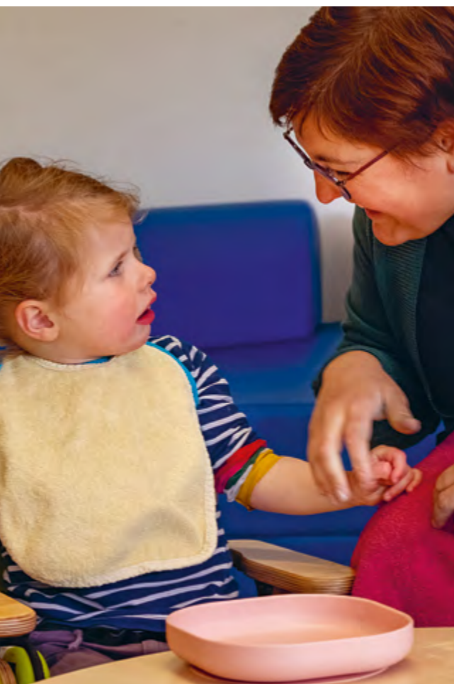
Abbildung 38: Kommunikation macht Bedürfnisse klar.