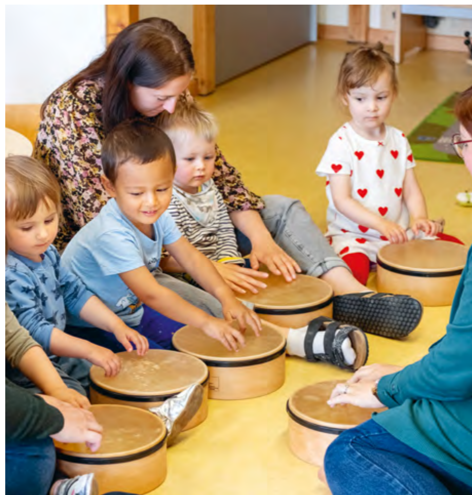
Abbildung 39: Gemeinsames Trommeln im Singkreis.