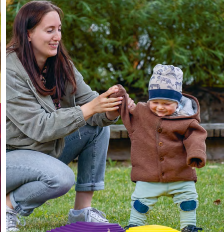
Abbildung 7: Soziale Beziehungen stärken bei der Bewältigung von Herausforderungen.