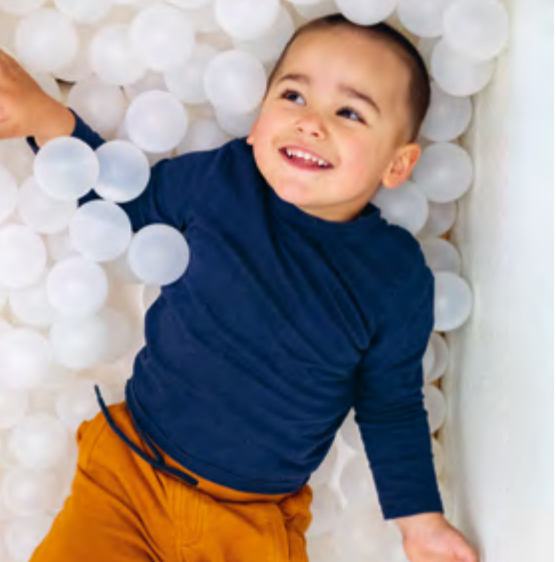
Abbildung 30: Angebote im Snoezelenraum.