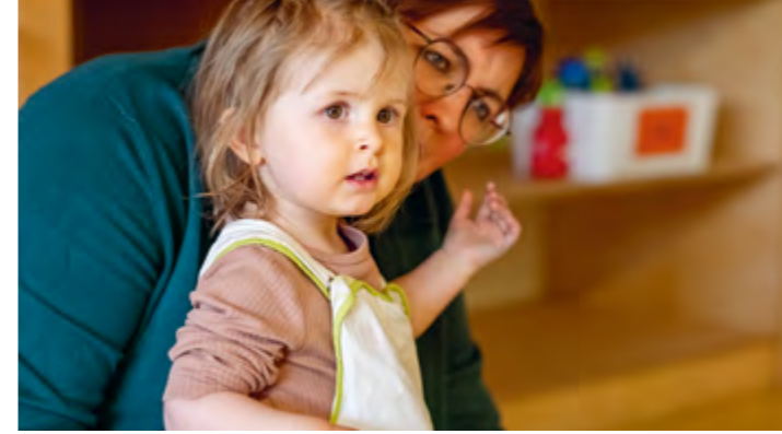
Abbildung 20+21: Übergänge, zum Beispiel beim Ankommen oder Einschlafen, werden eng begleitet.

Beobachtung ist eine Grundlage unserer pädagogischen Tätigkeit. Dadurch erfahren wir viel über die Interessen und die Entwicklung der Kinder. Wir dokumentieren unsere Beobachtungen und tauschen uns darüber aus. So können wir gezielt auf die Bedürfnisse der Kinder eingehen und das pädagogische Handeln planen und reflektieren. Die Bildungs- und Erziehungsziele können auf diese Weise konkret verfolgt werden. Unsere Mitarbeiter*innen befinden sich in einem ständig laufenden Prozess, ihre pädagogischen Tätigkeiten zu reflektieren. Im Team erhalten sie auch Feedback von ihren Kolleg*innen.