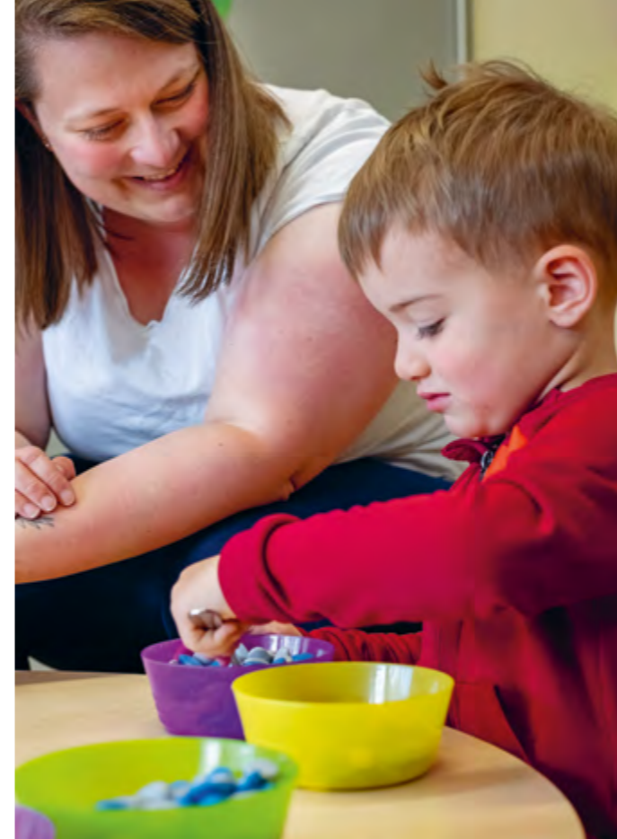
Abbildung 6: Spielerisches Üben der Handmotorik.

Wir möchten, dass die Kinder so selbständig wie möglich sind und werden. Damit sie so eigenständig wie möglich handeln können, üben die Kinder in unseren Einrichtungen die sogenannte „Lebenspraxis“. Dazu gehört zum Beispiel das möglichst selbständige Essen und das möglichst selbständige An- und Ausziehen. So bemerken sie auch, was sie schon können. In den Kindern entsteht dadurch Selbstbewusstsein. Das erleichtert es ihnen, einen eigenen Standpunkt zu vertreten und innerlich selbständig zu werden.