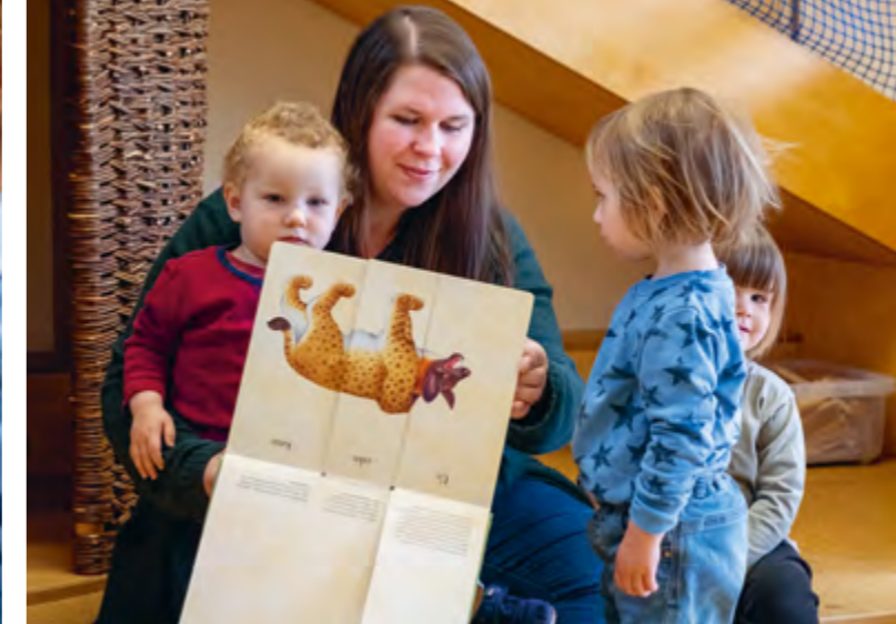
Abbildung 29: Das Lesen von Büchern hat einen großen Stellenwert.