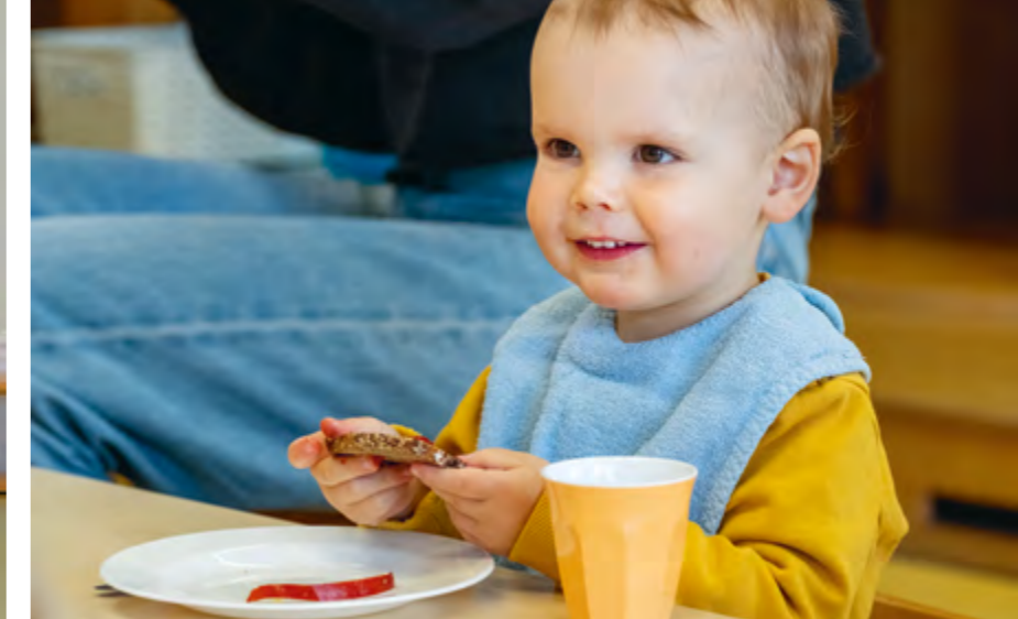
Abbildung 33: Kochen und Backen.

Lesen: In jeder Gruppe gibt es ein großes Bücherregal mit passender Literatur für das Kleinkindalter. Die Kinder suchen sich dort gerne Bücher aus, die sie alleine ansehen oder sich vorlesen lassen. Die gemütlichen Kuschecken in der Gruppe laden dazu ein. Bücher eignen sich gut, um mit den Kindern ins Gespräch zu kommen und ihren Wortschatz zu erweitern. Ab und zu wird mit dem Kamishibai-Erzähltheater der ganzen Gruppe eine Geschichte erzählt.