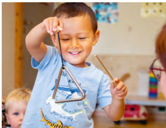
Abbildung 5: Im Singkreis testen Kinder verschiedene Instrumente.

Die Kinder üben sich in größtmöglicher Selbstständigkeit.