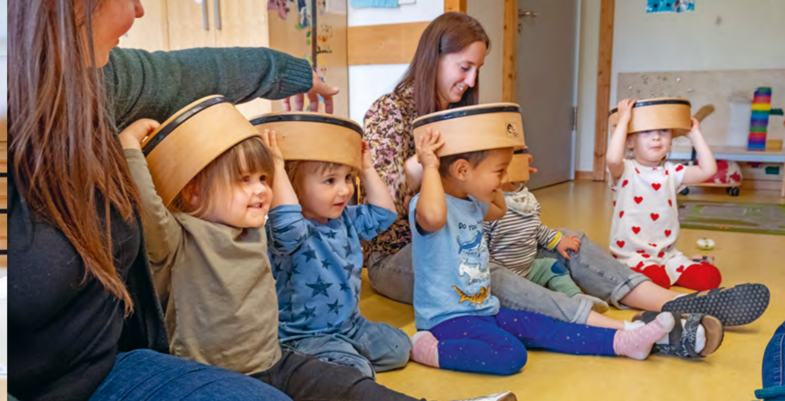
Abbildung 48: Quatsch im Singkreis.