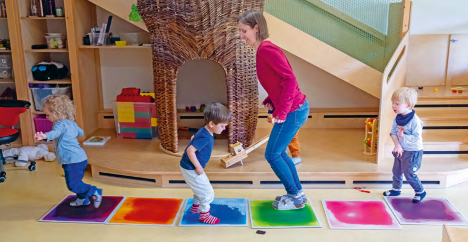
Abbildung 47: Spaß beim Hüpfen.