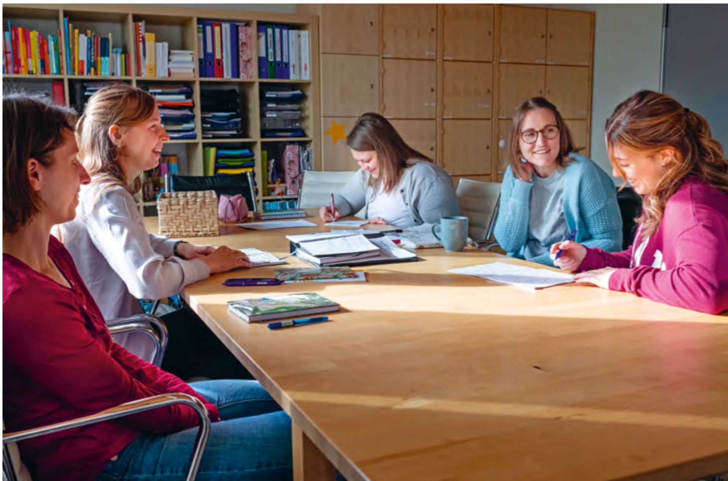
Abbildung 36: Besprechungen bringen Austausch und Struktur.