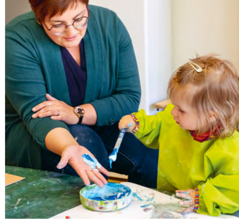
Abbildung 24+25: Gute Zusammenarbeit mit den Eltern ist Grundlage für eine gute Beziehung zu den Kindern.

Besonders wichtig ist uns eine gute und vertrauensvolle Zusammenarbeit mit den Eltern [Bildungs- und Erziehungspartnerschaft]. Die Eltern sind die wichtigsten Bezugspersonen für die Kinder. Daher sehen wir sie als die Expert*innen für ihre Kinder. Die Betreuung der Kinder basiert auf dem Vertrauen zwischen Eltern und Mitarbeiter*innen. Wir wünschen uns deswegen einen Dialog auf Augenhöhe miteinander, um die Kinder adäquat begleiten zu können. Gemeinsam können wir den Kindern eine möglichst gute Entwicklung ermöglichen.