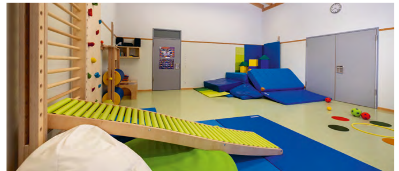
Abbildung 1: Ein buntes Angebot im Turnraum.