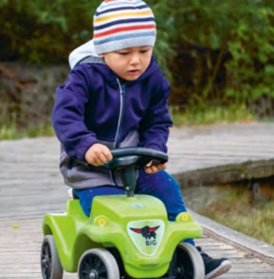
Abbildung 34: Tretauto fahren im Außengelände.