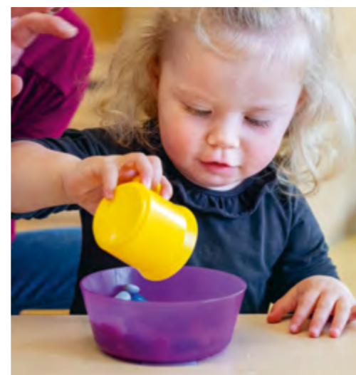
Abbildung 13+14: Beim Experimentieren mit verschiedenen Materialien gewinnen Kinder erste naturwissenschaftliche Erkenntnisse.