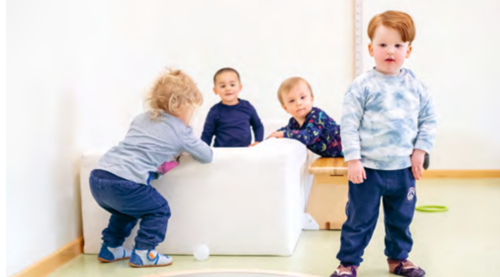
Abbildung 35: Nachmittags treffen sich die Kinder gruppenübergreifend.

Um 11:30 Uhr essen die Kinder in ihren jeweiligen Gruppen zu Mittag. Genau wie beim Frühstück stehen auch beim Mittagessen neben der Freude am Essen die Gemeinschaft und die Eigenständigkeit der Kinder im Vordergrund. Die Kinder sammeln Erfahrungen im Umgang mit Besteck und Tischkultur und werden nach ihren jeweiligen Fähigkeiten unterstützt, sich Essen und Getränke selbstständig zu nehmen.