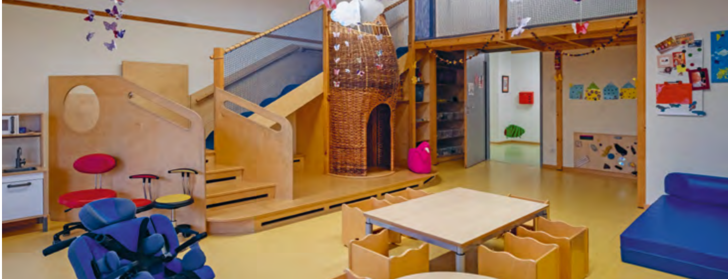
Abbildung 27: In diesem Gruppenraum spielt sich der größte Teil des Tages ab.