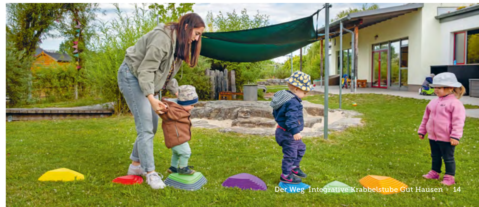
Abbildung 17: Die Kinder beschreiten in der Krabbelstube ihren eigenen Weg.

Wir leben einen geregelten Tagesablauf, bei dem die Kinder Stabilität erfahren und sich so auf neue Bildungsprozesse gut einlassen können.