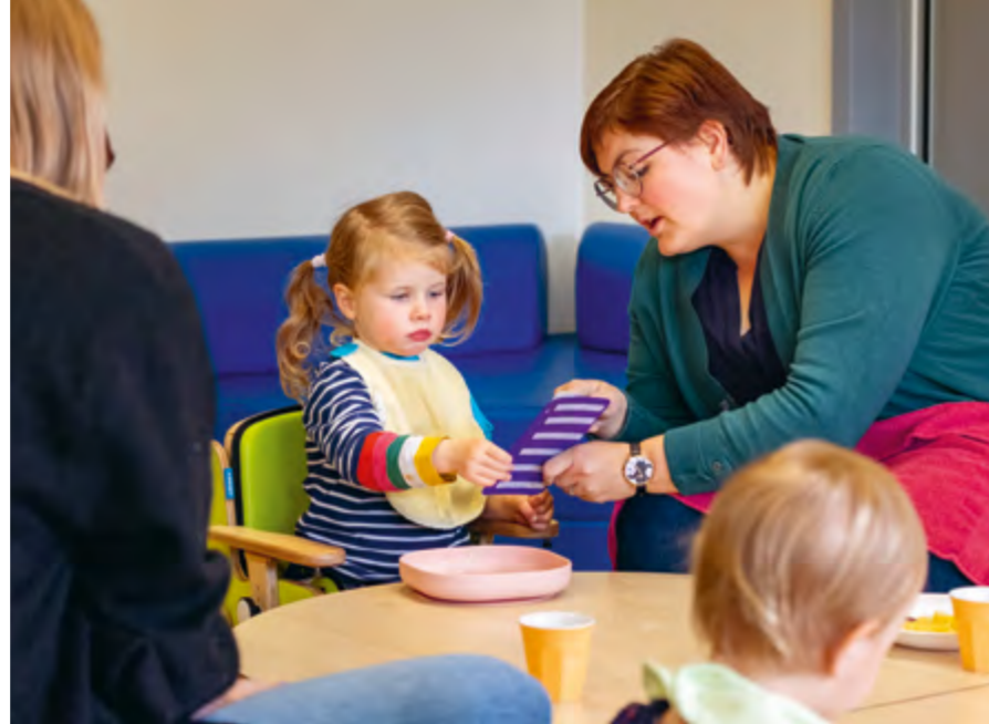
Abbildung 10: Sprachliche Begleitung gibt Orientierung.