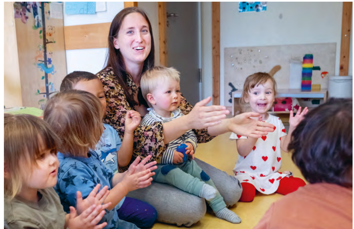
Abbildung 37: Der Singkreis macht viel Freude.