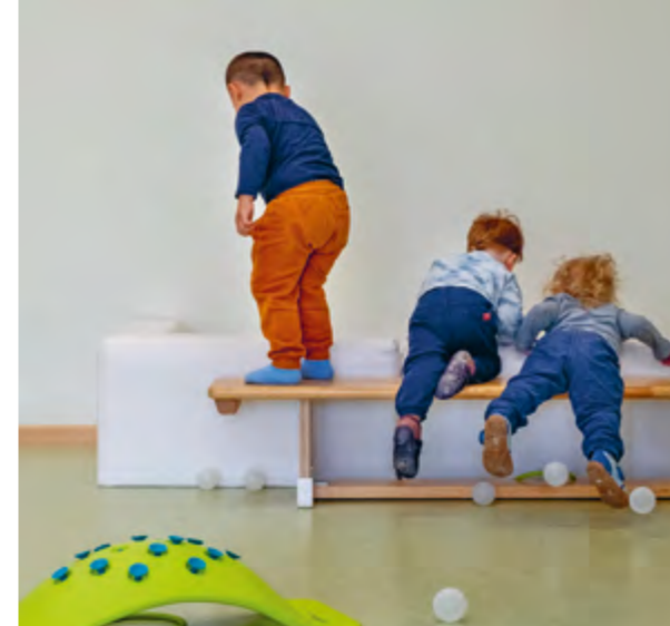
Abbildung 32: Turnen und Bewegen.