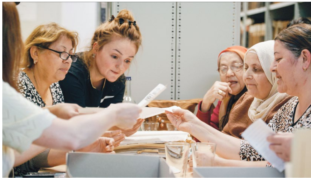
Erst nach über 30 Jahren können die Überlebenden die an sie gerichteten Briefe lesen.