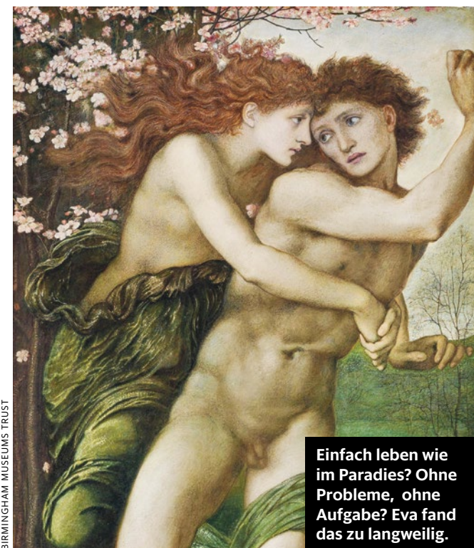
BIRMINGHAM MUSEUMS TRUST

Einfach leben wie im Paradies? Ohne Probleme, ohne Aufgabe? Eva fand das zu langweilig.