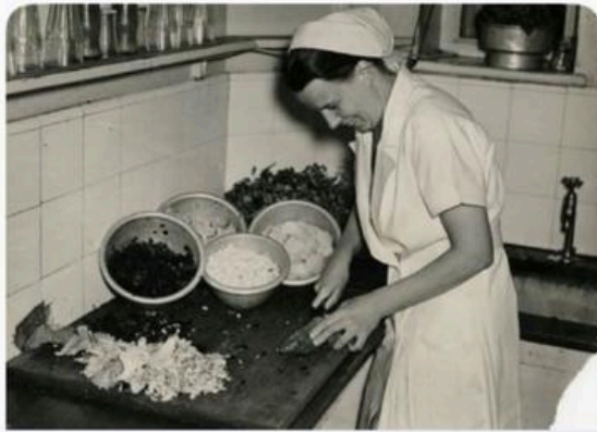
Feministisches Frankfurt Vegetarische Gaststätte