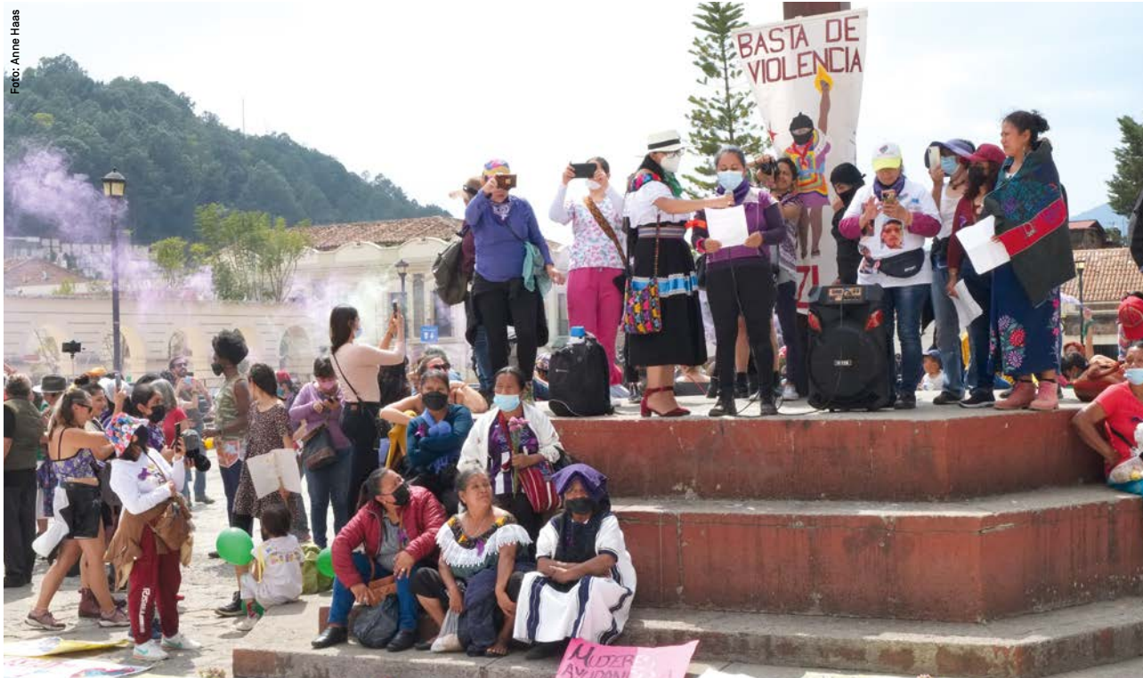
In Chiapas kämpfen indigene Communitys um die Anerkennung ihrer Rechte, hier bei einer Kundgebung zum 8. März.