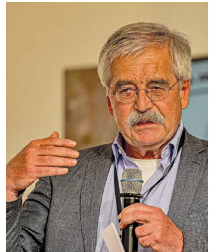
Ganz oben: Bei dem Jubiläumssymposium der Stiftung 2024 diskutierten die Teilnehmenden im medico-Haus über „Visionen einer anderen Globalität“.