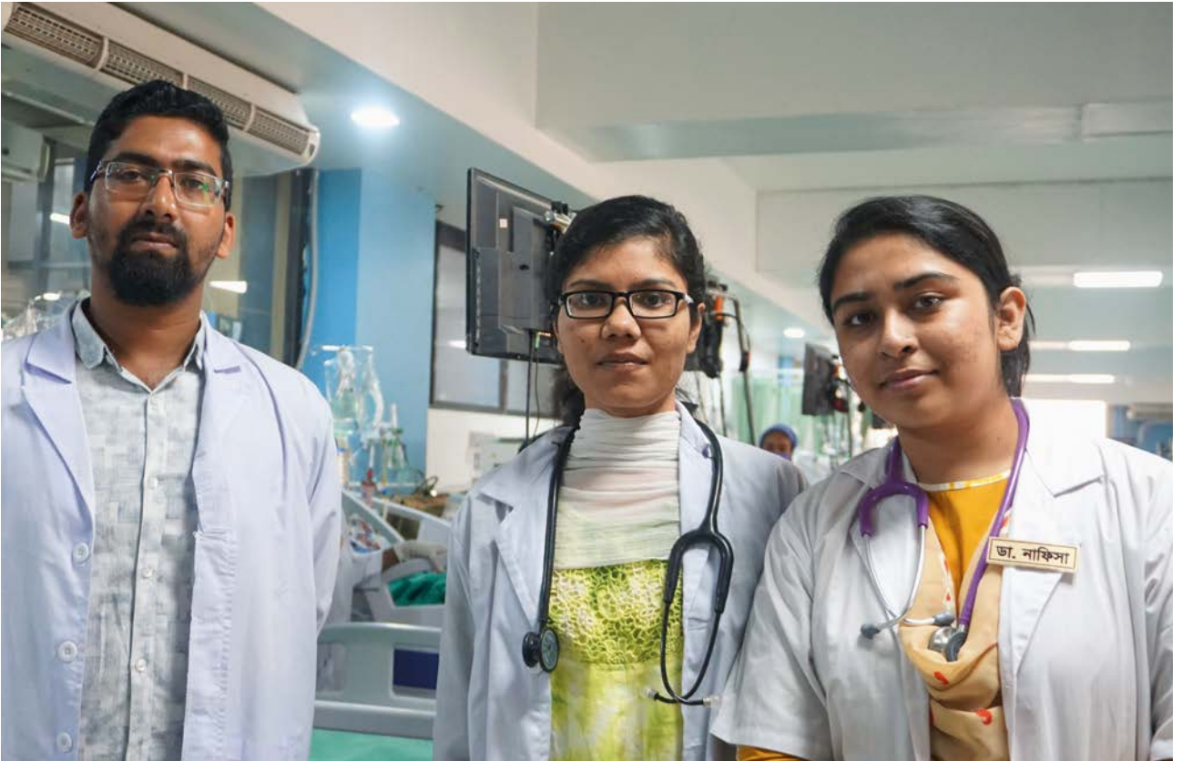
Die Gesundheitsdienste von Gonoshasthaya Kendra organisieren die medizinische Versorgung von Textilarbeiter:innen.