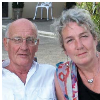
Ein Mietshaus auf St. Pauli für die Stiftung.