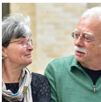
Das Unternehmerpaar aus Gauting gehört zu den Gründungstiftern.

Nachhaltige Veränderungen brauchen Zeit und einen langen Atem. Vermögen in eine Stiftung einzubringen, ist ebenfalls ein auf Dauer angelegtes Engagement. Hier erklären Menschen ihre Motivation, sich für die Stiftung einzusetzen.