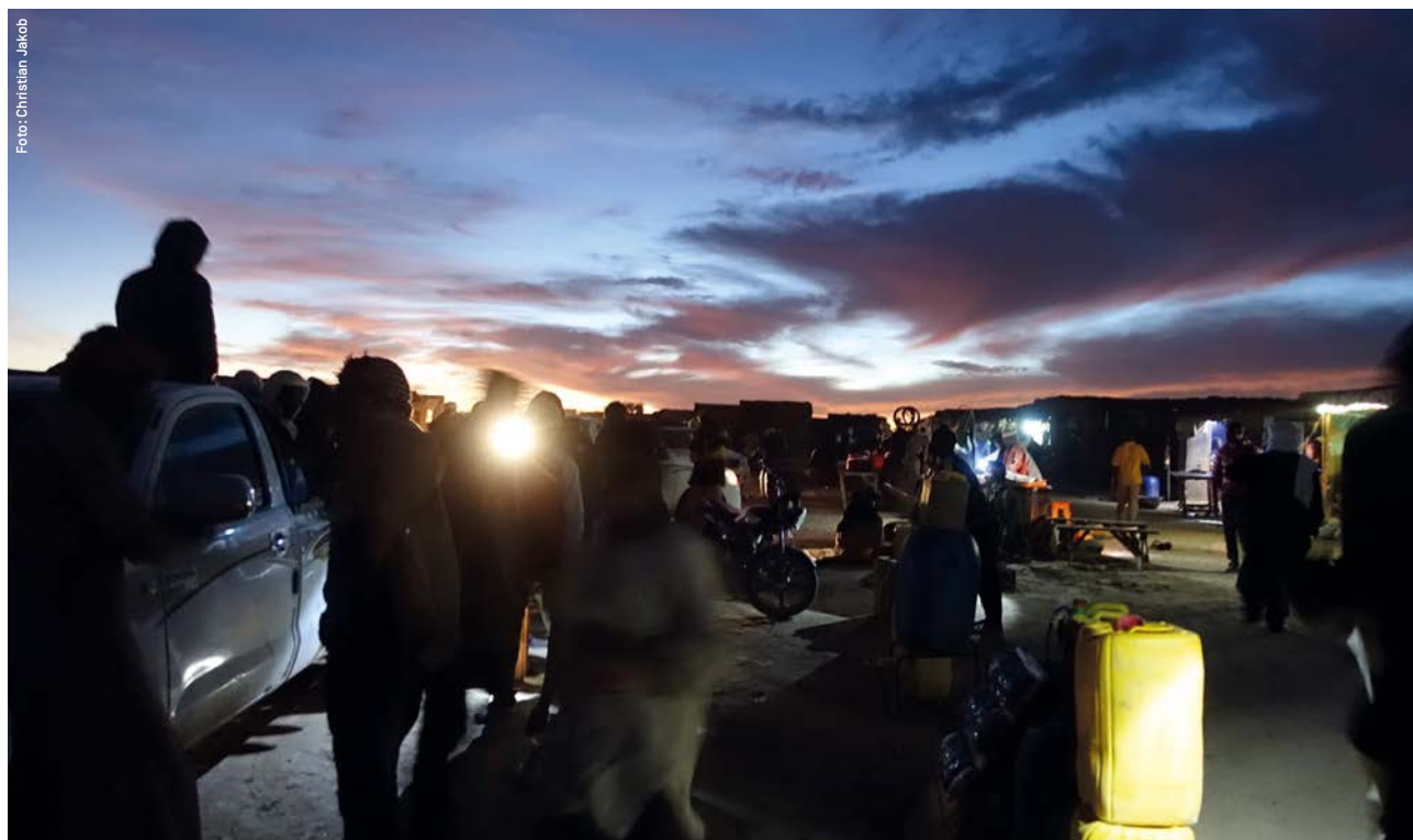
Aufklärung über Gefahren und Möglichkeiten, Protest gegen Schikanen und Entrechtung: Ein zivilgesellschaftliches Netzwerk in der Sahelregion versucht, das Sterben in der Wüste zu verhindern.

Über Jahre hinweg hat die EU Niger zum strategischen Frontstaat der eigenen Migrationsabwehr auf- und ausgebaut. Das änderte sich mit dem dortigen Putsch im Sommer 2023. Seither verläuft die Hauptmigrationsroute aus West- und Zentralafrika wieder legal über Niger. Doch die Reisen bleiben lebensgefährlich und Abschiebungen aus Algerien und Libyen nehmen weiter zu. Alarmphone Sahara (APS), ein transnationales Netzwerk von Aktivist:innen in Afrika und Europa, unterstützt Migrant:innen in Not. Durch die Dokumentation von Menschenrechtsverletzungen entlang der Migrationsroute, das Aufklären über die gefährlichen Bedingungen der Reise, die Rettung und Versorgung von gestrandeten Migrant:innen in der Sahara, psychosoziale Betreuung und eine Gemeinschaftsküche steht APS für die praktische Verteidigung der Menschenrechte aller ein.