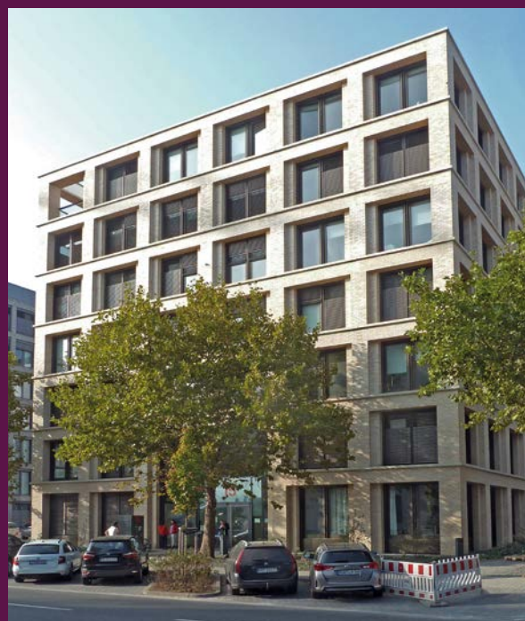
Von der Stiftung finanziert: das medico-Haus in Frankfurt

Ermutigt von diesen Erfahrungen hat die medico-Stiftung über Erbbau- und Darlehensverträge auch Gelder in emanzipatorischen Wohnprojekten angelegt. Ein Beispiel: Zusammen mit der Stiftung trias hat sie auf einem ehemaligen Gelände des US-Militärs in Mannheim ein Grundstück gekauft und dem sozial-ökologisch-künstlerischen Projekt BARAC im Erbbaurecht zur Verfügung gestellt. Während der Erbpachtzins der medico-Arbeit zugute kommt, wird in dem Projekt „eine Sozialutopie“ aus Wohnen, Kunst und Inklusion verwirklicht. Auch Flüchtlinge haben hier Zuflucht gefunden.