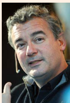
Ilija Trojanow, Schriftsteller und Journalist, Wien