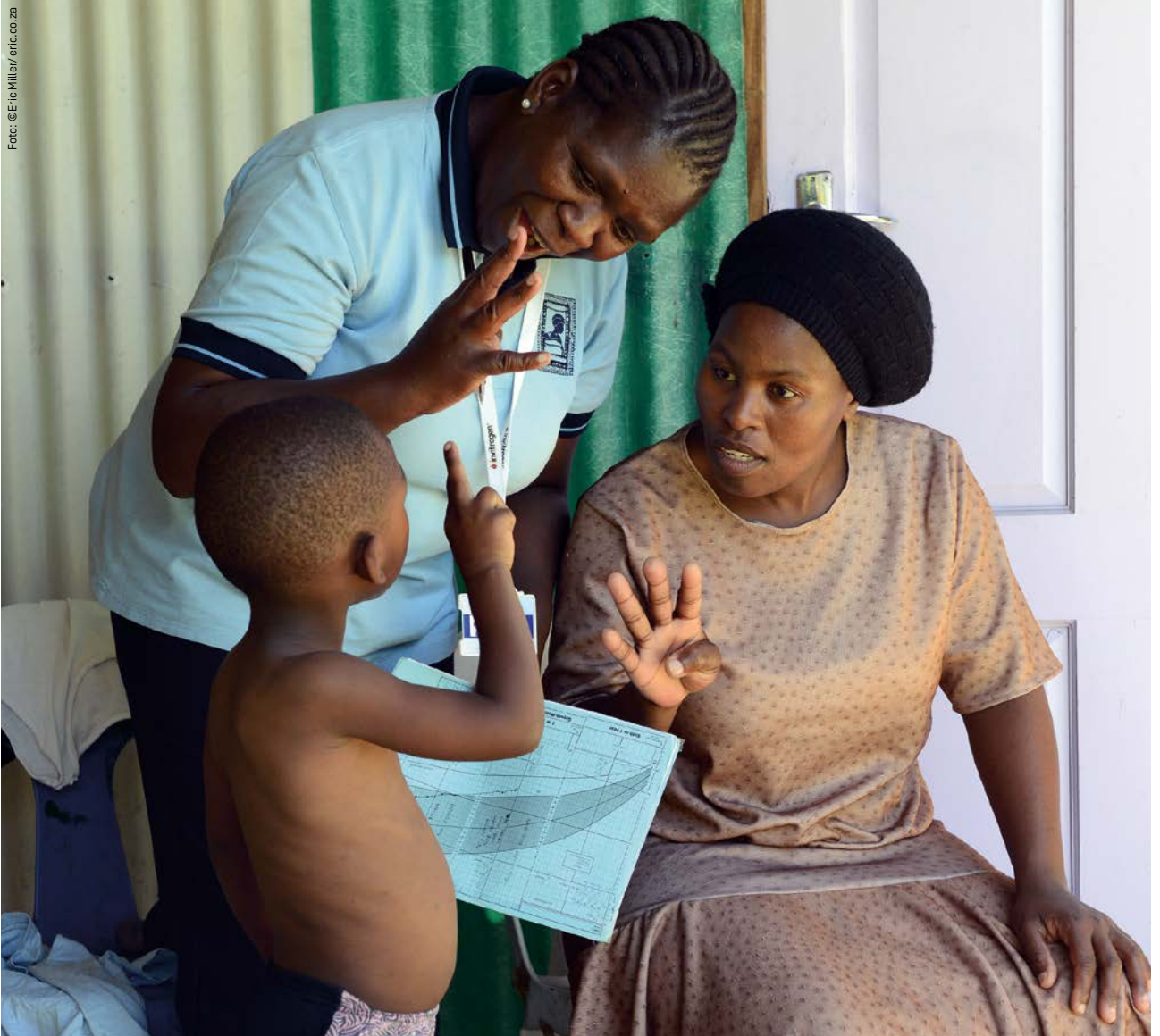
Basisgesundheitsstationen wie hier in Südafrika kämpfen gegen Armutserkrankungen. Doch Gesundheit ist mehr als die Abwesenheit von Krankheit. Ziel ist die Schaffung von gesellschaftlichen Verhältnissen, die allen ein gutes Leben ermöglichen.