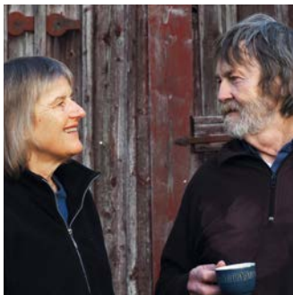
Das Paar aus dem mittelfränkischen Petersaurach unterstützt die Stiftung von Anfang an.