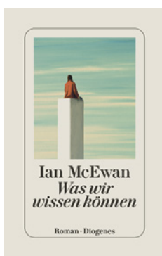
Ian McEwan: Was wir wissen können, Diogenes 2025, 28 Euro

Bei aller Kritik an der Dummheit der Menschen, die die Erde, wie wir sie kennen, trotz besseren Wissens zerstören, ist die Geschichte doch nicht hoffnungslos. Sie feiert den fehlbaren Menschen, die Schönheit des Geistes und der Literatur, die Natur, die Liebe und das Leben.