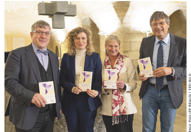
Pressekonferenz zur Veröffentlichung der neuen evangelischen Friedensdenkschrift am 10. November in Dresden.

Die neue Friedensdenkschrift macht das deutlich, indem sie den