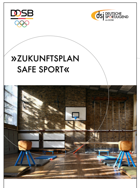
Zukunftsplan Safe Sport