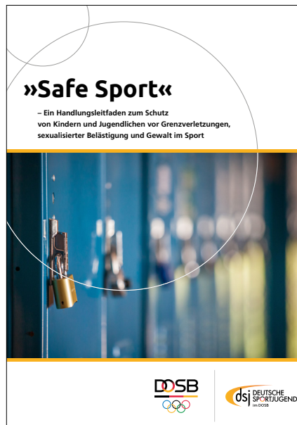
Safe Sport – Ein Handlungsleitfaden zum Schutz von Kindern und Jugendlichen vor Grenzverletzungen, sexualisierter Belästigung und Gewalt im Sport