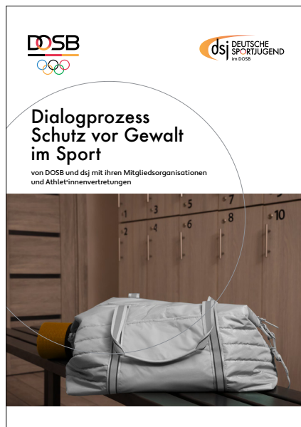
Dialogprozess Schutz vor Gewalt im Sport (rein digital)