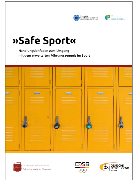
Safe Sport – Handlungsleitfaden zum Umgang mit dem erweiterten Führungszeugnis im Sport