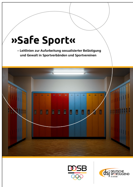
Safe Sport – Leitlinien zur Aufarbeitung sexualisierter Belästigung und Gewalt in Sportverbänden und Sportvereinen