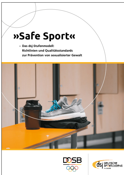
Safe Sport – Das dsj-Stufenmodell (rein digital)